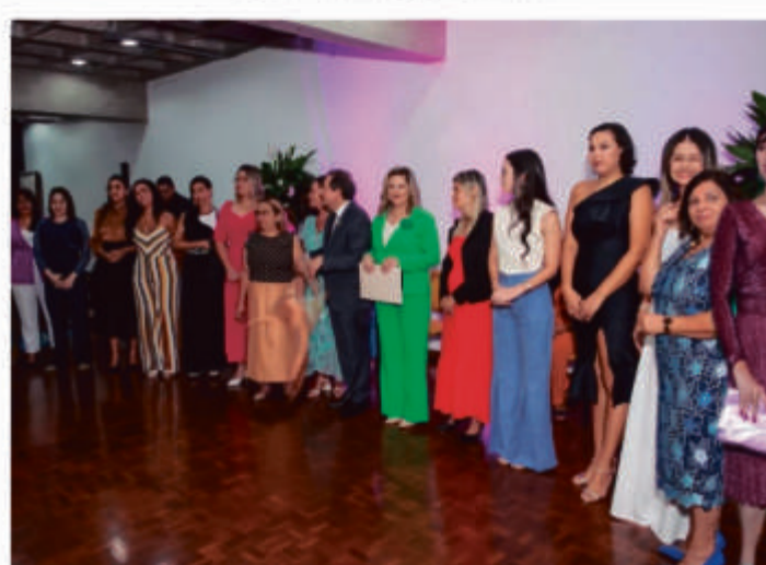
ASSOCIADAS FUNDADORAS DO CME