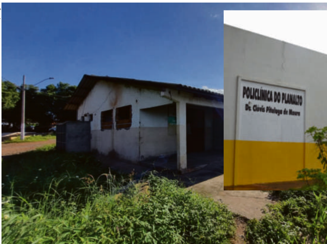
A atual situação da policlínica do bairro Planalto: a obra se encontra parada e o quadro de evolução, não tem acontecido, levando em consideração que demorará mais do que o previsto

O Gabinete Estadual de Intervenção na Saúde de Cuiabá iniciou a obra de reforma e am-