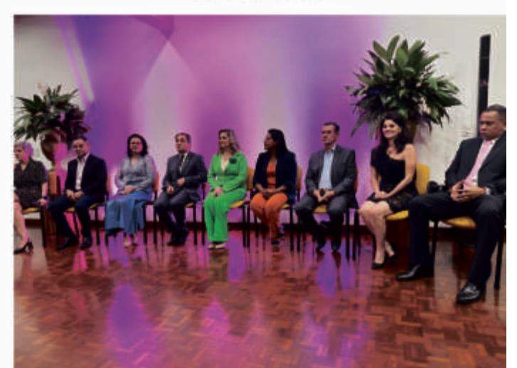
DISPOSITIVO DE AUTORIDADES