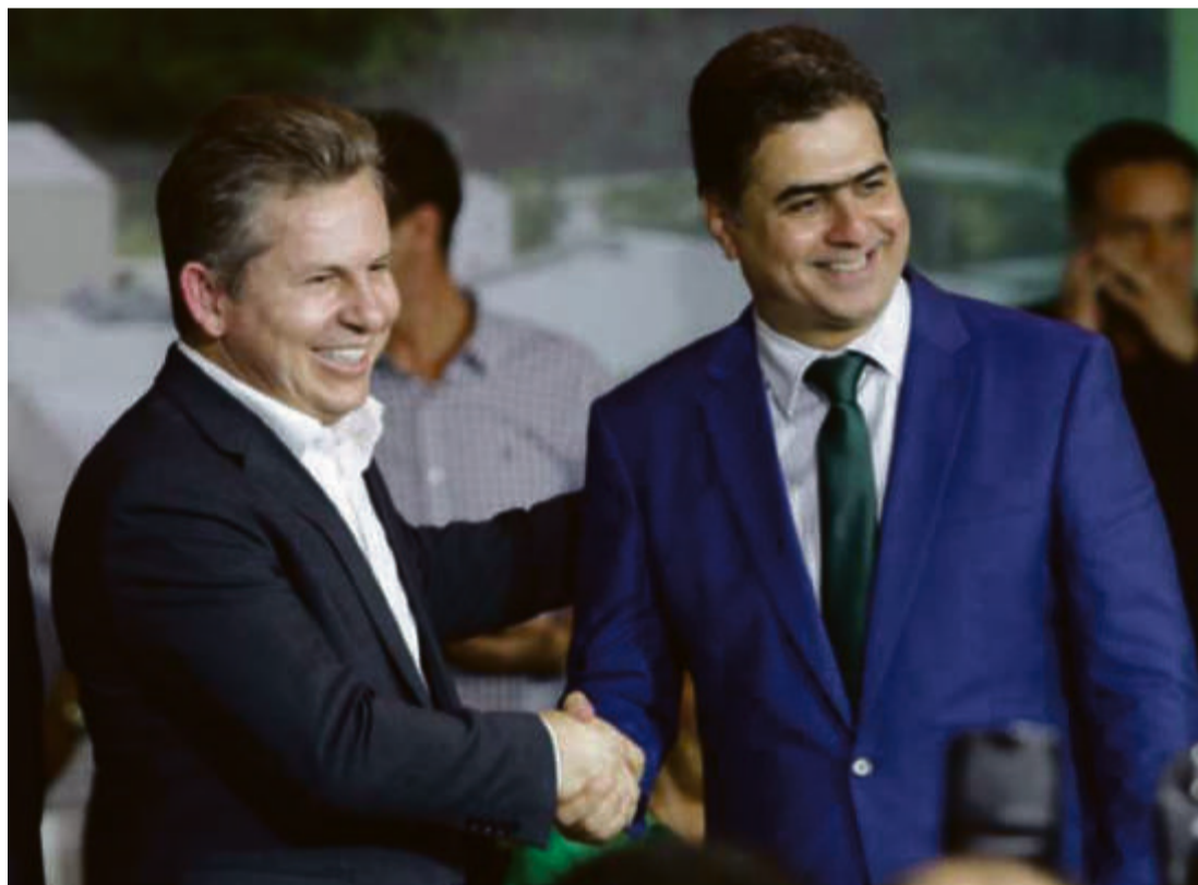
O primeiro passo para a reaproximação dos antes aliados e hoje inimigos políticos partiu do prefeito cuiabano, que na semana passada oficializou a solicitação para uma reunião com o governador Mauro Mendes

Por meio da Secretaria de Estado de Infraestrutura e Logística (Sinfra), o Governo do Estado também assinou a ordem de serviço para o início das obras de um Complexo Viário na Avenida Miguel Sutil, em Cuiabá. A obra receberá um investimento de R$ 62,8 milhões e prevê a realização de três obras no entorno da trincheira Jurumirim.