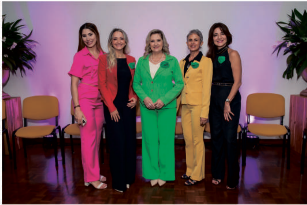
DIRETORIA DO CONSELHO DA MULHER EMPRESÁRIA - CME DA ACCUIABÁ