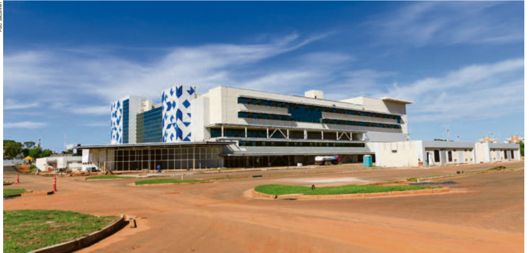
A estimativa é de que a conclusão da construção ocorrerá em 2024, com a inauguração prevista para 2025

A estrutura contará com possibilidade de realizar até 1.990 internações mensais, 652 procedimentos cirúrgicos, 3.000 consultas especi-