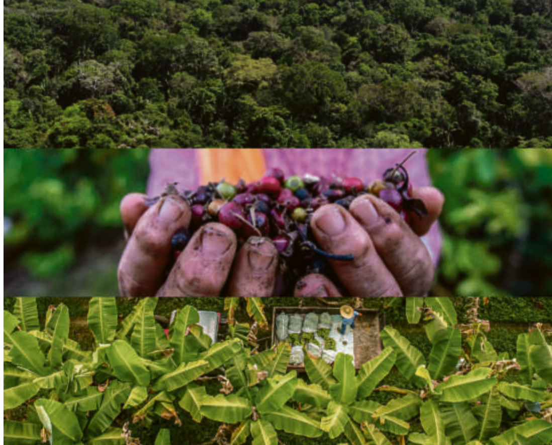
O último dos direcionadores diz respeito à conservação dos ecossistemas naturais e à transição para sistemas alimentares mais saudáveis

Para o enfrentamento dos desafios, direcionar os esforços pela promoção da justiça