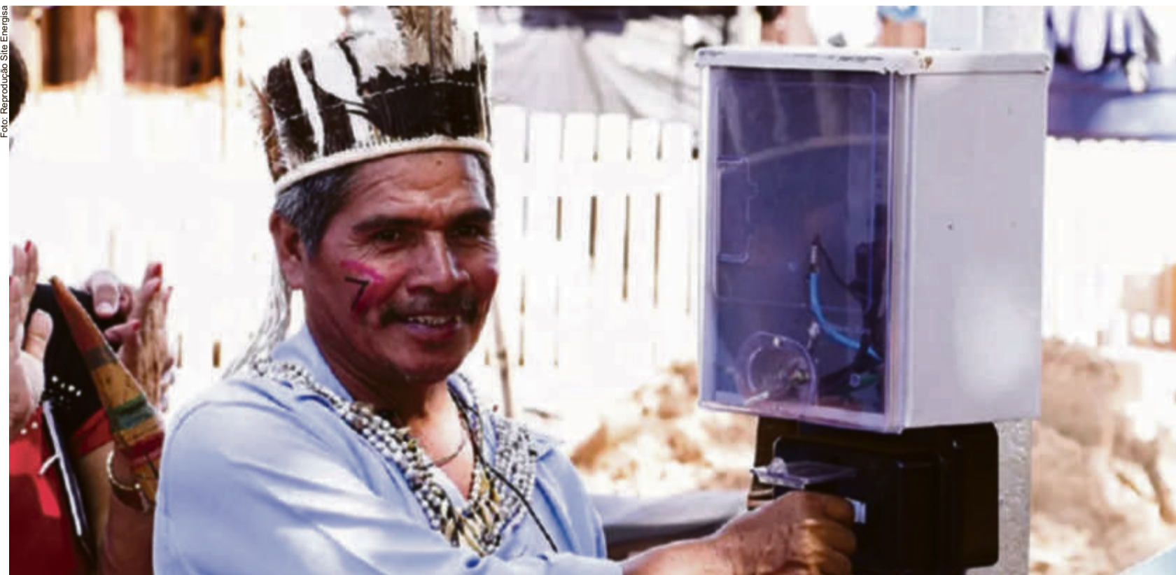
O benefício pode ser de até 100% nas faturas de energia para os indígenas e quilombolas, atingindo mais de 7.500 famílias em Mato Grosso

A partir do reforço da Energisa para encontrar as famílias, foram feitas parcerias com o Governo do Estado e secretarias municipais de assistência social para levar as informações sobre o cadastro à população, principalmente em regiões com comunidades indígenas.