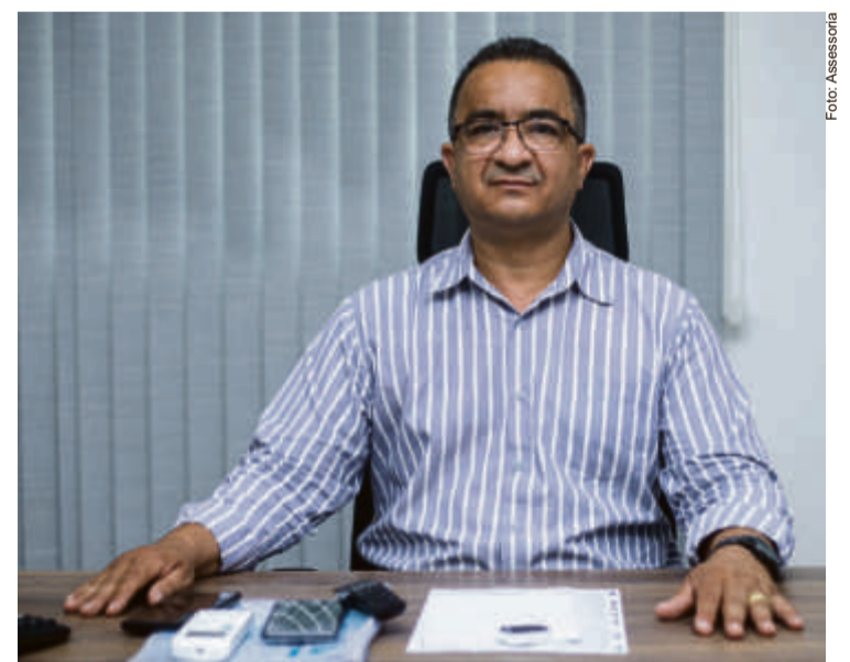
O vereador reforça que com a filiação ao MDB seu trabalho, desenvolvido nos últimos anos, terá continuidade. Afirma ainda que a mudança de partido marca um passo significativo em sua trajetória política e reflete um compromisso renovado com as bandeiras que tem defendido ao longo de sua carreira pública

“Minha filiação ao MDB não apenas consolida o meu compromisso com as demandas