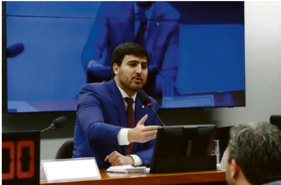
Procuramos o presidente Lula e o ministro Jader Filho para solicitar e posteriormente garantir que os nossos municípios fossem contemplados, assegurando mais moradias dignas para o povo mato-grossense.” destacou Pinheiro Neto

O Ministério das Cidades divulgou que mais de 75 mil moradias foram selecionadas