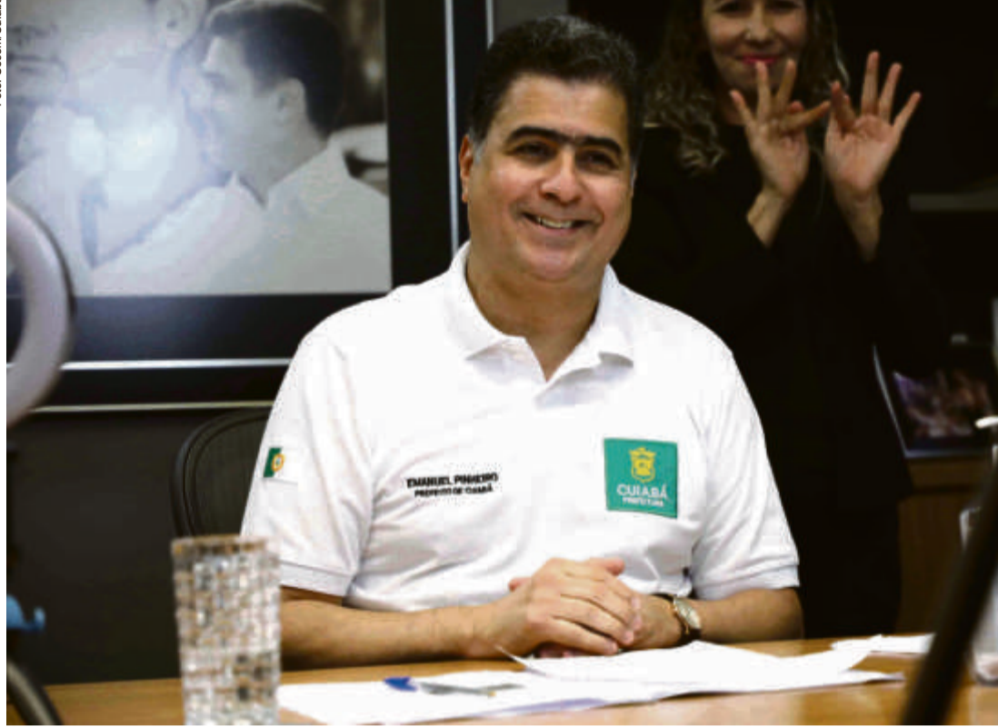
“Toda a minha jornada na vida pública foi e é voltada para construir políticas que garantam que nossa gente viva com dignidade e em uma cidade cada vez mais humana, inclusiva e preparada para o futuro”, declarou o prefeito

“Esta via é a maior da história de Cuiabá, com 17,34 quilômetros de pista dupla, ciclovia e iluminação LED, conectando o distrito industrial à Rodovia Manoel Piero. Antes des-