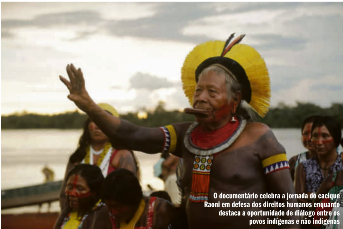
O documentário celebra a jornada do cacique Raoni em defesa dos direitos humanos enquanto destaca a oportunidade de diálogo entre os povos indígenas e não indígenas