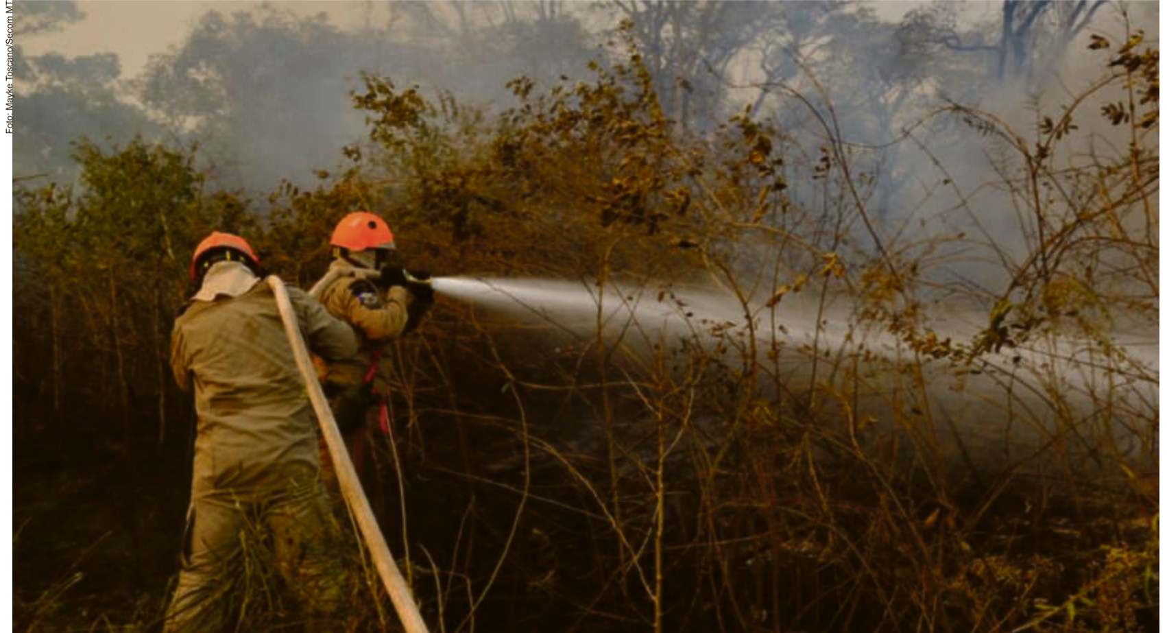
Pela proposta, será instalada uma base de controle na delegacia da polícia Militar na rodovia estadual. Serão aparelhados e apoiados por profissionais qualificados

Fechadas essas etapas, serão realizadas fiscalizações intensas no período entre julho e outubro, período em que os focos de calor ocorrem com maior frequência no estado. Os números de emergência serão afixados ao longo da autoestrada principal.