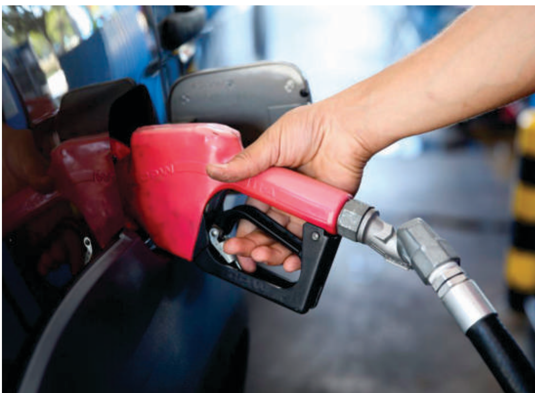
Fornecedor direto dos postos, algumas distribuidoras reajustam sem justificar os motivos à revenda

Valor apurado nos primeiros dias do ano chegou a R$ 152,3 milhões, acima dos R$ 143,9 milhões arrecadados no mesmo período de 2022