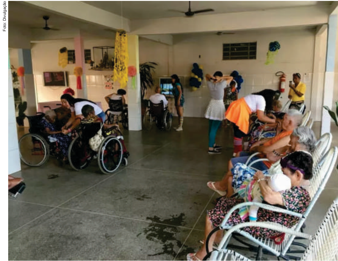
A edição deste ano contempla o Abrigo Bom Jesus de Cuiabá, uma instituição da sociedade, é do povo e mantida com ajuda de voluntários, entidades e empresários

O Bazar da AL Social é um completo ciclo de solidariedade: a sociedade doa peças, a equipe da Assembleia Social higieniza e coloca à venda, a população compra a baixo custo, todo o dinheiro é revertido a uma entidade filantrópica.