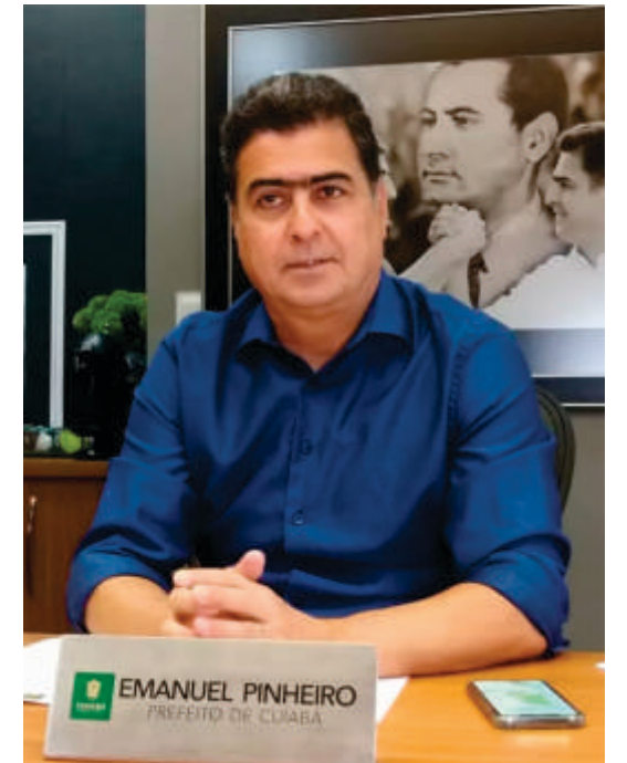
O prefeito afirmou que a auditoria havia sido pedida por ele no bojo da defesa do processo de intervenção da SMS