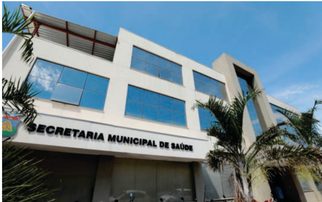
A auditoria foi instalada no último dia 14 de fevereiro e irá se debruçar sobre a contabilidade da SMS cuiabana

Para o chefe do Executivo Municipal cuiabano, o trabalho que o TCE-MT fará deve acabar de vez com as especulações de que há “rombo” nas contas da Secretaria de Saúde do município. “Temos certeza que Com esta auditoria realizada pelo TCE, o Município de Cuiabá