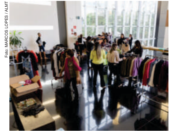
Bazar da AL Social é um completo ciclo de solidariedade: a sociedade doa peças, a equipe da Assembleia Social higieniza e coloca à venda, a população compra a baixo custo