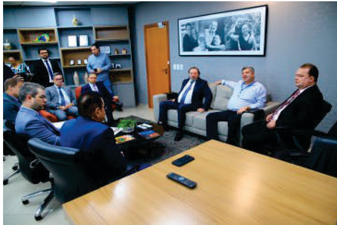
O Código de Processo de Contas vem sendo desenvolvido há meses pela equipe da Presidência, em acompanhamento à Consultoria Jurídica Geral e à Secretaria de Normas e Jurisprudência (SNJur) do TCE-MT

A expectativa é que o projeto de lei seja votado ainda neste ano para que, a partir de 2023, todos os processos referentes ao con-