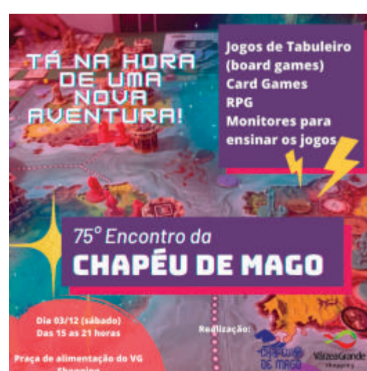
A maioria dos jogos é para pessoas a partir de 14 anos, mas a Chapéu também traz alguns jogos para crianças a partir de 8 anos

Equipe Chapéu: O mundo eletrônico é cada dia mais atraente e é notável de que apesar das pessoas estarem conectadas, as interações são sempre solitárias. A Chapéu de Mago surgiu da iniciativa de um grupo de amigos, liderados pelo Álvaro Duran, que queriam promover encontros ao vivo para jogar jogos de tabuleiro. Então criaram o grupo e passaram a divulgar o lugar dos Encontros na Internet. Nestes eventos alguns membros levam vários jogos e a Chapéu oferece o serviço de monitoria, onde ensina os jogos disponíveis. O principal objetivo é promover o hobby dos jogos de tabuleiro modernos e RPG. A maioria das pessoas que gostam de jogos de tabuleiro já jogou os jogos clássicos, como Banco Imobiliário (Monopoly), Jogo da Vida e War (Risk), mas a proposta da Chapéu é