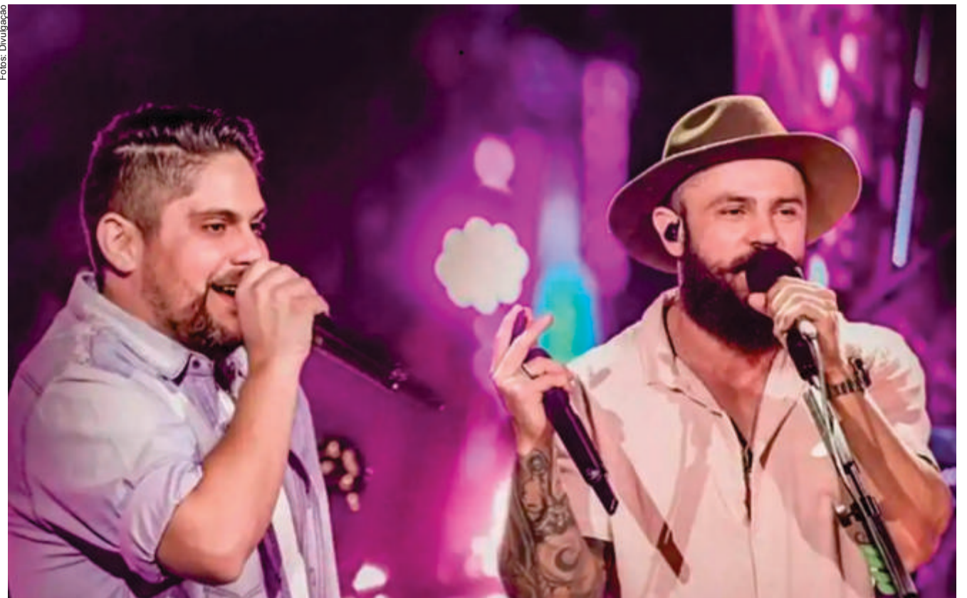
A dupla Jorge & Mateus vai comandar o último grande show popular de 2022, no Univag, com produção do empresário Elson Ramos

nais como as do cantor e compositor Luth Peixoto, consagrado por seus muitos anos de ribalta. Os bons negócios na noite cuiabana abraçam todos os públicos e a proximidade da Copa do Mundo já tem garantido muita festa popular para animar o Fan Fest Cuiabá 2022, que pretende agregar as multidões para vibrarem durante os jogos da seleção brasileira de futebol, comandada por Neymar Jr, no Qatar. O Fan Fest está programado para o Parque de Exposições da Acrimat, no bairro do Porto, nos dias 24 e 28 de novembro e 2 de dezembro. Animação juntando torcida, música e futebol é o que não vai faltar.