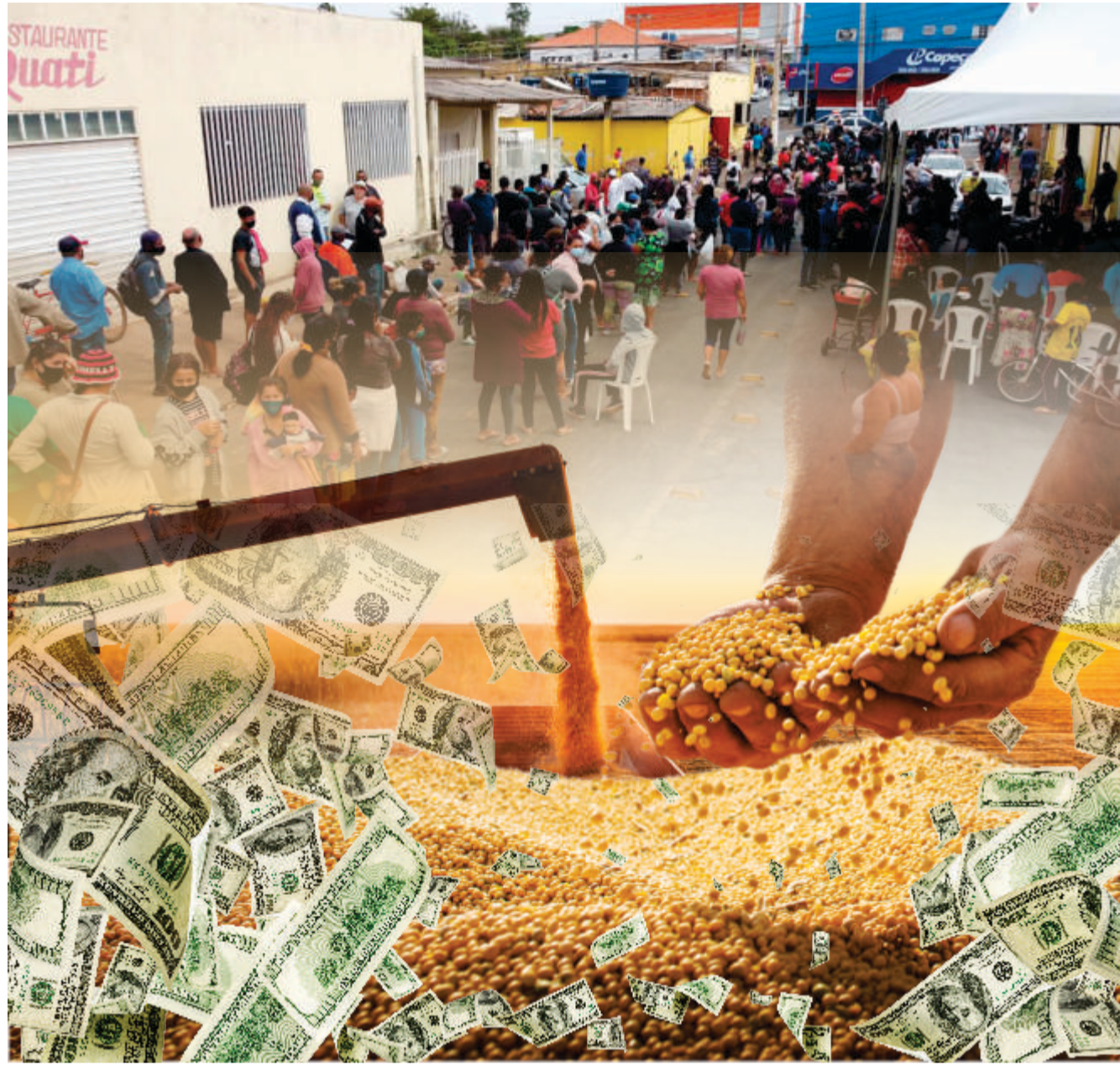
Enquanto os milionários do agronegócio de Mato Grosso esbanjam dinheiro com candidatos como Jair Bolsonaro, a população em geral enfrenta os dissabores de viver em meio à mais profunda crise econômica desde 2002. A pobreza e a fome se alastra no estado campeão do agronegócio e considerado o “celeiro do mundo”