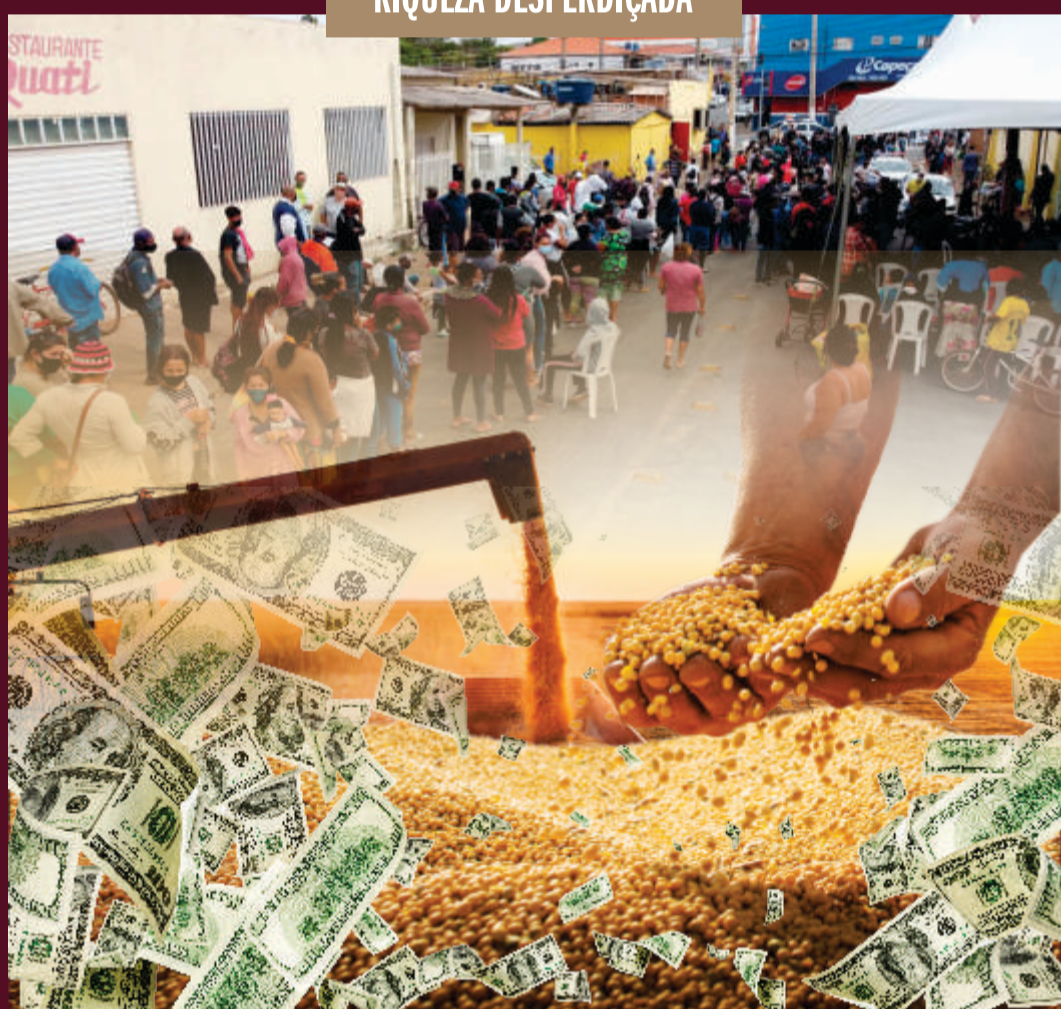
Credito das Fotos: Imagem dinheiro, campo de soja e produtor - Licenciada Adobe Stock - Imagem da 'Fila dos Omeletes' - Por Rogério Fleminho/Arquivo Noticias - Arte e montagem - César Simoni