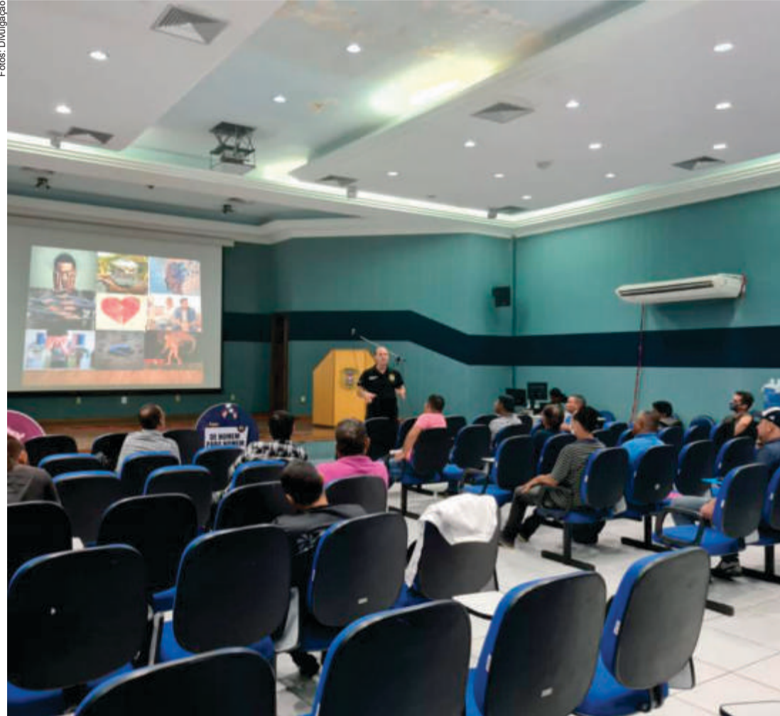
Atividades são desenvolvidas na sede da Acadepol onde desde a sua criação mais de 1500 homens já passaram pelo projeto