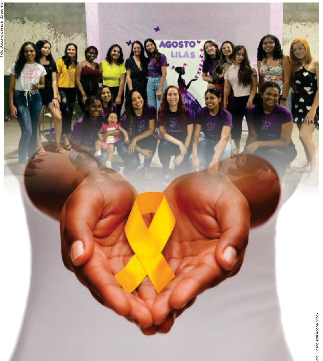
O foco do projeto é ajudar jovens a lidar com as doenças psicológicas, e quebrar o tabu que existe a respeito do tratamento

Em entrevista ao Jornal Centro Oeste Popular, uma das idealizadoras contou que a ideia