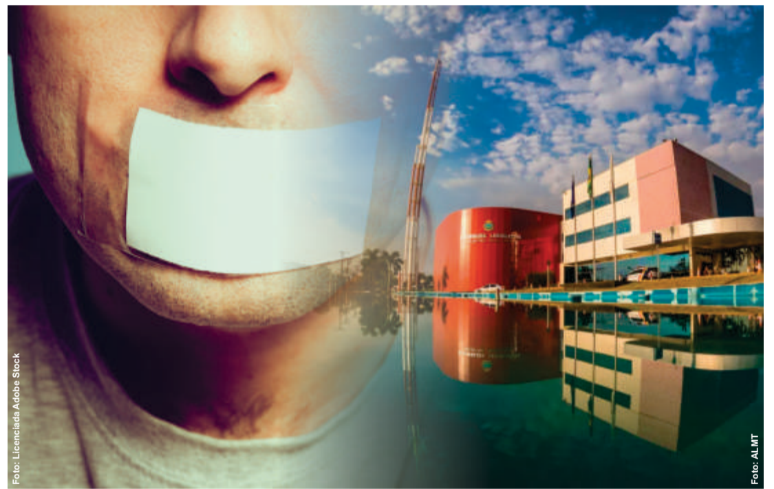
Todos os fatos passaram despercebidos pelos 24 deputados estaduais. Nenhum deles se manifestou na tribuna e em plenário e tampouco utilizaram suas redes sociais para questionar a lisura da licitação

Priorizando novos mandatos, as sessões da Assembleia Legislativa tradicionalmente realizada nas quartas-feiras tornou-se inexistente. Mesmo com salário mensal de R$ 20 mil, verba indenizatória de R$ 65 mil e outros benefícios mensais, os deputados estaduais abdicaram de trabalhar e exercer suas funções básicas é elaborar leis e fiscalizar atos do Executivo.