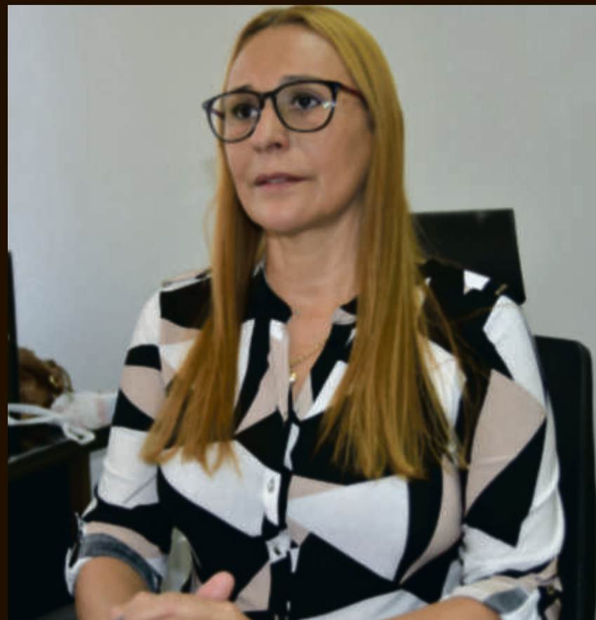
Secretária Municipal de Educação se nega a dar informações do referido contrato trazendo "nuvens" sobre o mesmo

Aditivo aumentou contrato vencido a mais de um ano de R$15,6 milhões para R$19,5 milhões enquanto denúncias apontam má qualidade serviços da terceirizada que atende alunos portadores de necessidades especiais na rede municipal de educação