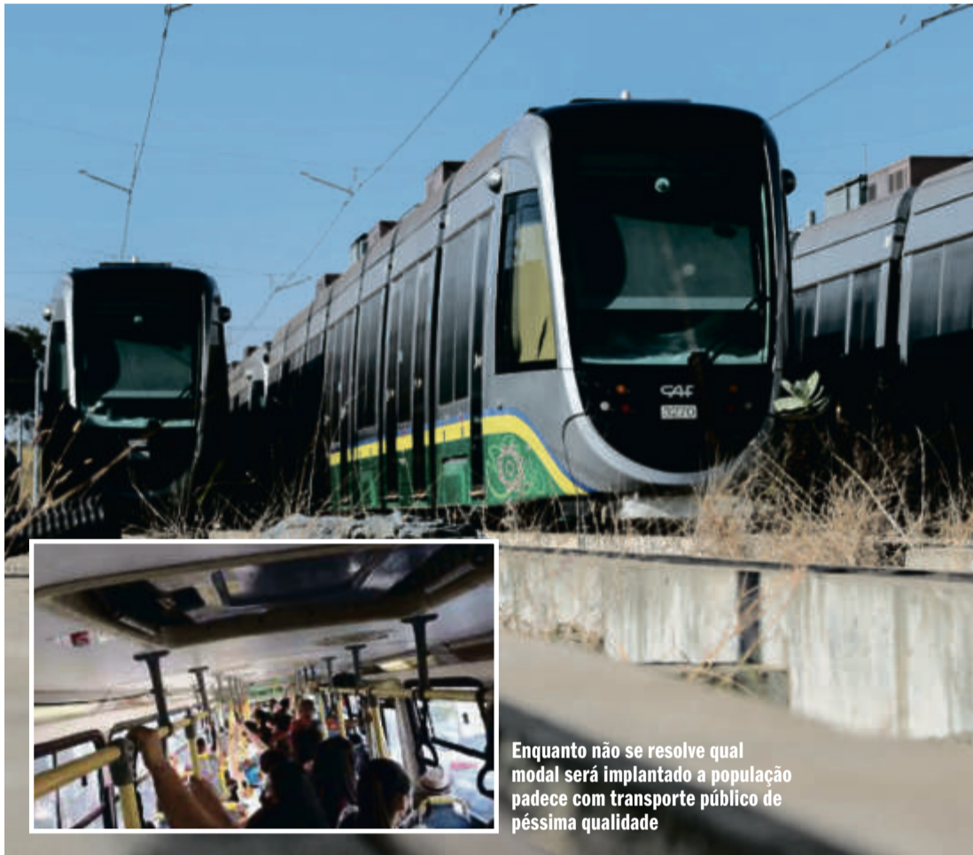
Com investimento de mais de 1 bilhão de reais, em 2013, ante denúncias de irregularidades, a obra foi embargada pela Justiça e segue paralisada até hoje

Baracat assegura que é a favor do modal que assegure rápida resolução do transporte -