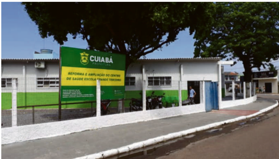
Na Saúde, a atenção primária, conta com três novas unidades Básicas de Saúde, nos bairros João Bosco Pinheiro/1º de Março, Ribeirão do Lipa e Alvorada

“Um de nossos compromissos de gestão é a construção de fontes luminosas em praças e rotatórias da cidade, que além de contribuir para