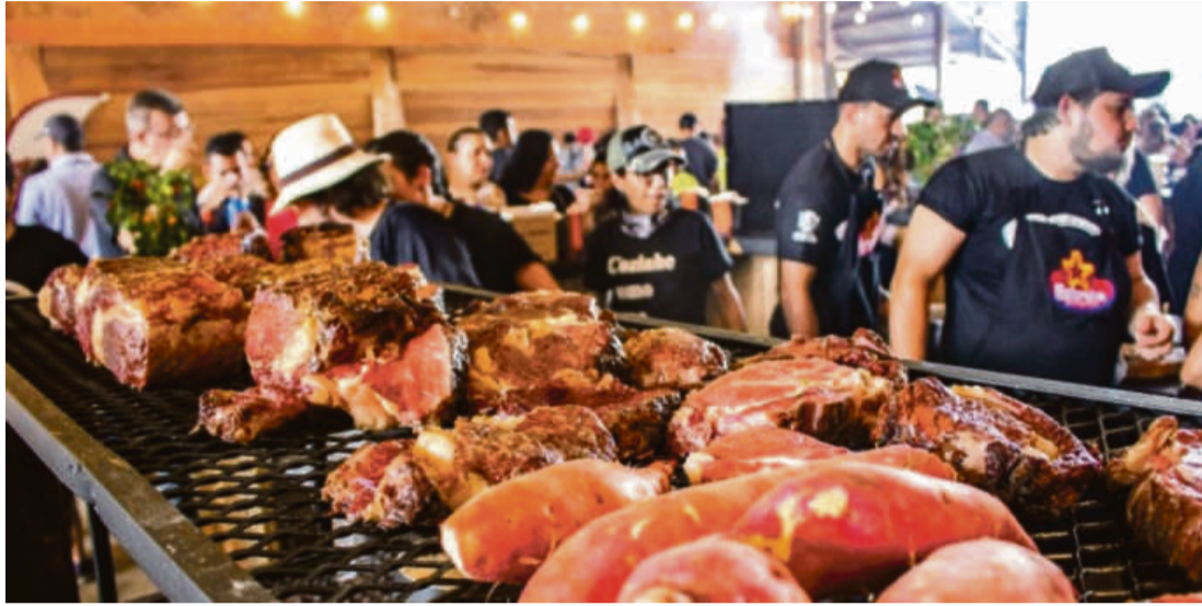
Nesta edição, entre as novidades oferecidas, também terá o galeto, Joelho de porco, smash burger, stinko bovino, o varal de peixes e a famosa carne de rã. Toda a alimentação será servida no "open food".

"Uma estação com atendimento a muitas pessoas foi um desafio! Digo sempre que sou muito abençoado por Deus. Os cinco primeiros amigos que convidei para me ajudar,