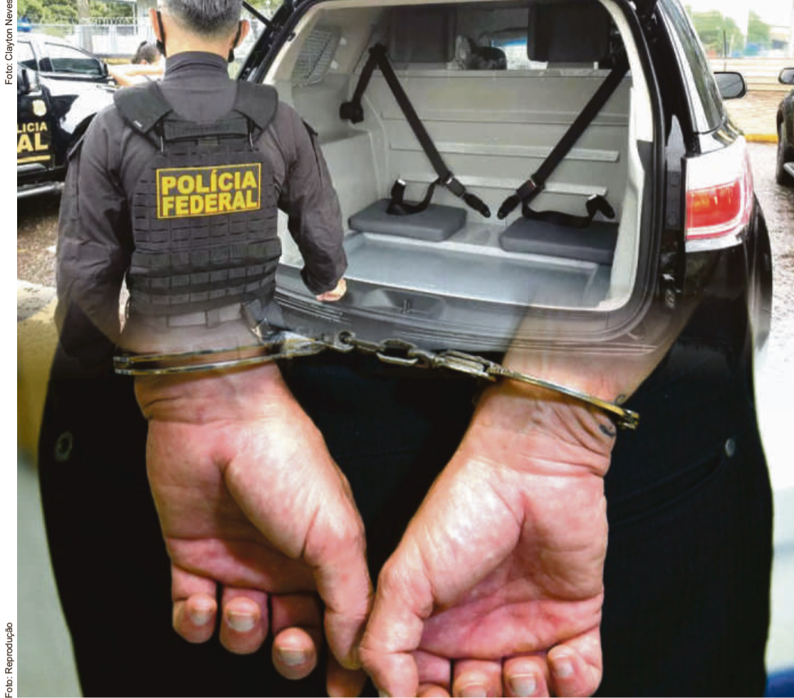
O suposto envolvimento de destacada figura nos meios políticos com o narcotráfico internacional, revelado pela Operação Descobrimto, no entanto, causou forte impacto nos bastidores partidários e do Governo do Estado

Fontes do COP junto às autoridades policiais e do MPF/MPE confirmaram esta semana que outras operações virão nos próximos meses. "Há casos que estão em reta final de apuração. Infelizmente, criminosos continuam agindo, iludidos de que não serão descobertos e que ficarão impunes. Eles estão enganados. As forças policiais e a Justiça trabalham em silêncio e nunca dormem", disse um dos delegados que comandam investigações que envolvem políticos.