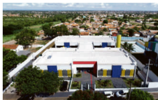
O CMEI Serginho tem capacidade para atender cerca de 400 crianças de 0 a 5 anos e 11 meses, em dois turnos, matutino e vespertino

amenizar o clima quente da nossa capital, também deixará nossa cidade mais bela e charmosa”, afirmou, ressaltando que o próximo ponto a receber uma fonte será na avenida Dante Martins de Oliveira, em frente ao supermercado Comper. Emanuel vem mantendo um ritmo acelerado de obras, com todas as regiões de Cuiabá sendo contempladas.