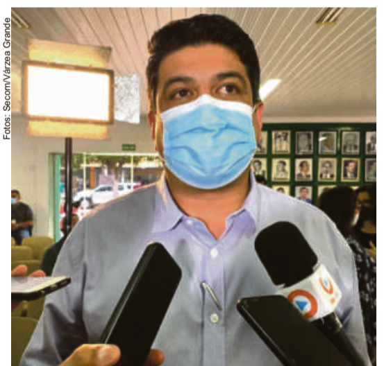
Kalil frisa que houve garantia por parte da empresa de que em maio, uma nova frota estará à disposição dos munícipes, com veículos zero quilômetro

“Nós queremos um sistema que funcione e atenda aos usuários, pois eles pagam pelo serviço prestado”, declarou o prefeito de Várzea Grande que defendeu um entendimento entre