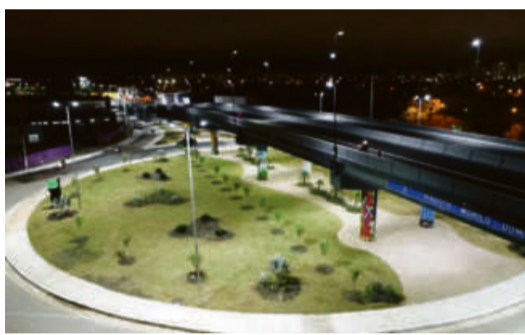
No quesito mobilidade, destaca-se os dois primeiros viadutos construídos com recursos próprios da Prefeitura de Cuiabá