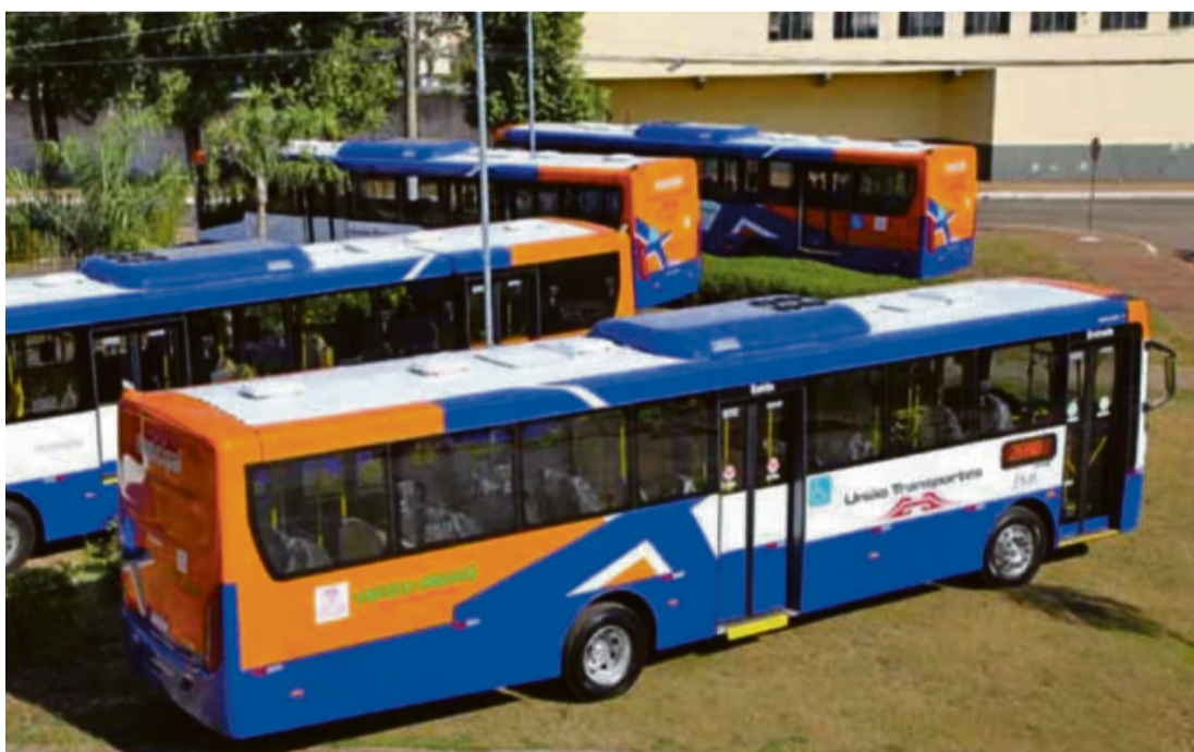
Reclamações por conta da má qualidade dos serviços são constantes por parte dos usuários

Ele ainda destacou que vem conversando com a Ager, responsável pelo transporte inter-