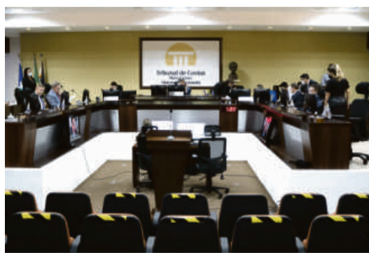
Atualmente o TCE é composto por 7 conselheiros titulares, fato que não ocorria desde 2011