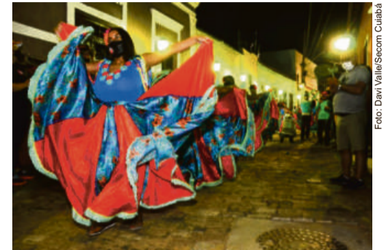
Gestão tem adotado medidas que garantem a volta à normalidade, porém, mantendo as medidas de biossegurança