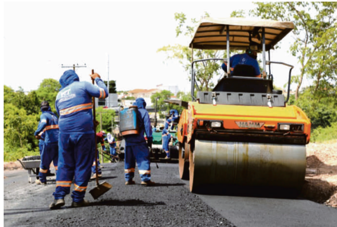
Prefeitura está concluindo uma licitação onde será contratado em torno de R$ 190 milhões pelos próximos dois anos para serem investidos em tapa buracos, recapeamento e asfalto novo