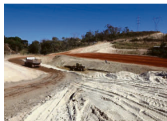
No setor de infraestrutura, o Contorno Leste, que é a maior obra estruturante em planejamento da atual gestão