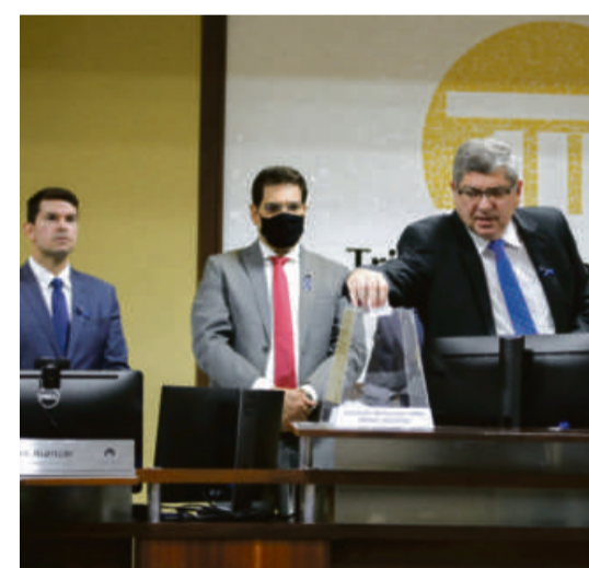
Maluf lembrou da importância histórica do momento para o TCE-MT, que após dez anos realizou a primeira eleição com o quadro de conselheiro recomposto em sua integralidade

"O Tribunal é uma organização que reúne o maior acervo sobre a administração pública do Estado, tem um corpo diretivo e técni-