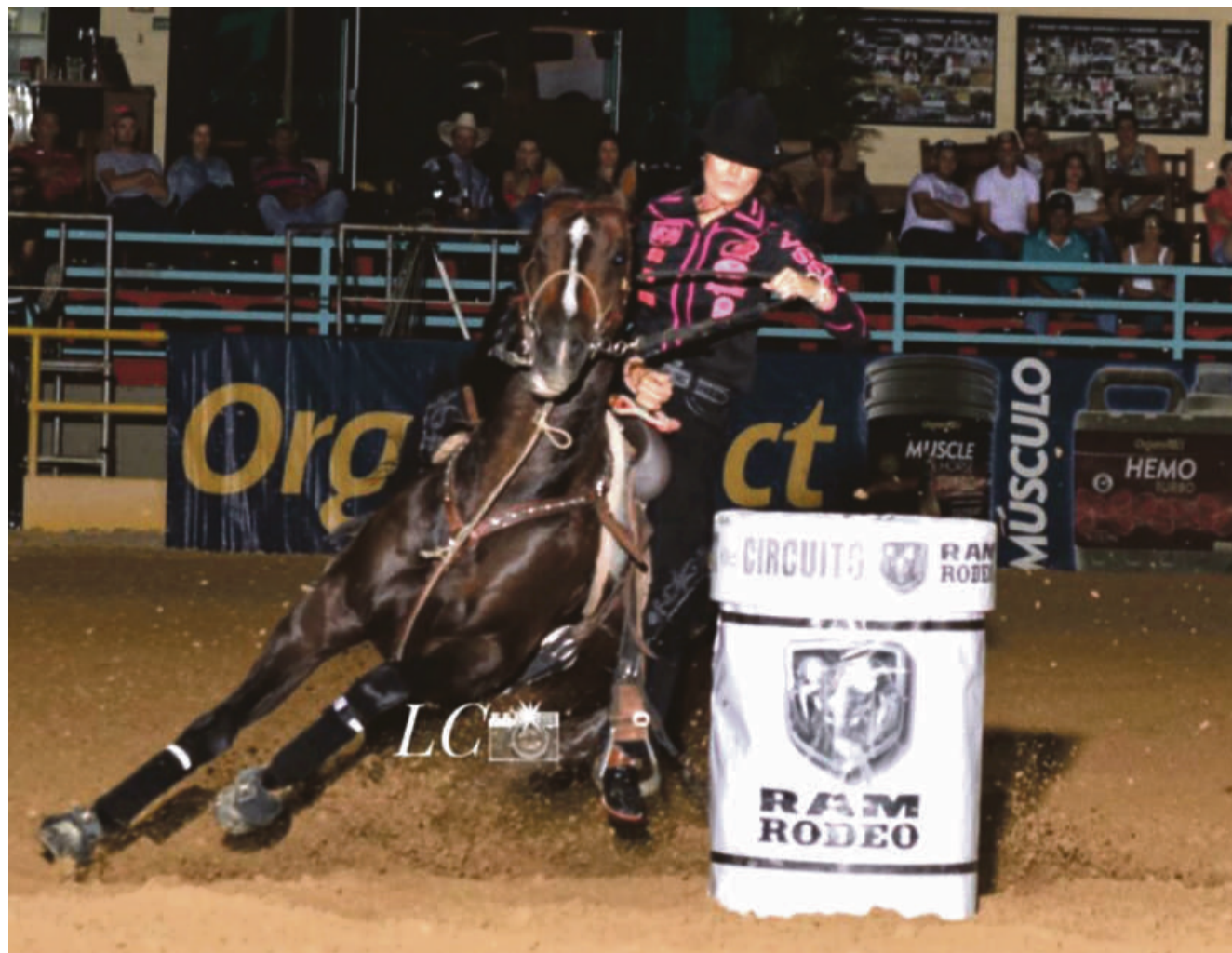
Competição contará com 840 participantes, sendo apenas um representante mato-grossense

“Acredito que todo criador quando inicia uma criação é um dia poder ganhar o prêmio máximo da raça que é o campeonato nacional, parti-