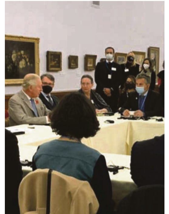
O governador também apresentou ao príncipe as estratégias do Estado para neutralizar as emissões de carbono até 2035

Charles, herdeiro do trono britânico, defendeu mais investimentos em tecnologia para que a produção de alimentos em Mato Grosso continue a ocorrer de forma sustentável, com redução de impacto ambiental, e também mais "ousadia" dos governos de todo o planeta contra o aquecimento global.