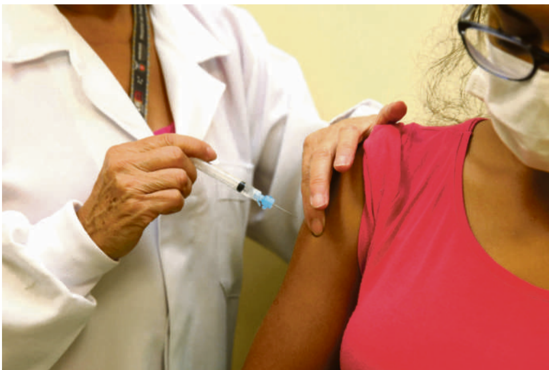
Mesmo já tendo recebido o imunizante, todos podem se contaminar e transmitir o vírus, retomando toda a escala de propagação de covid-19 no país