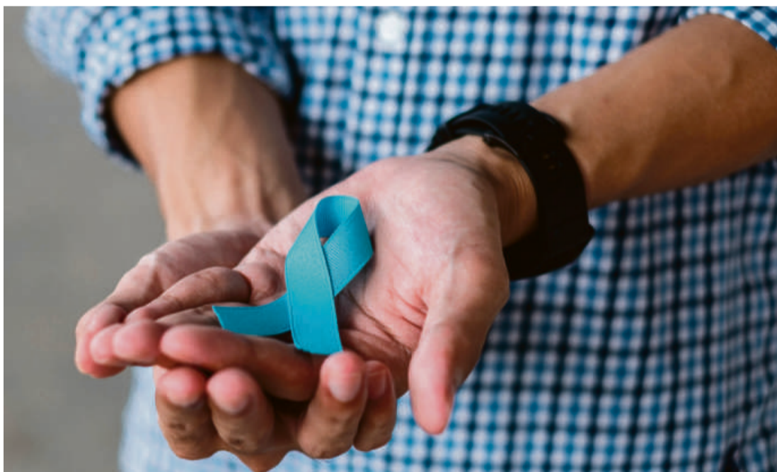
Em 2020, houve o registro de 275 óbitos por câncer de próstata e, em 2021, foram registrados 161 óbitos até o momento

A Secretaria encaminhou, aos 141 municípios, orientações voltadas para a reorganização das ações de saúde. Dentre essas orientações, está a manutenção de espaços masculinos em todo o ciclo de vida, a desconstrução de barreiras de acesso à saúde do homem, os incentivos para que um homem cuide da sua saúde e o planejamento de estratégias que incluem prevenção,