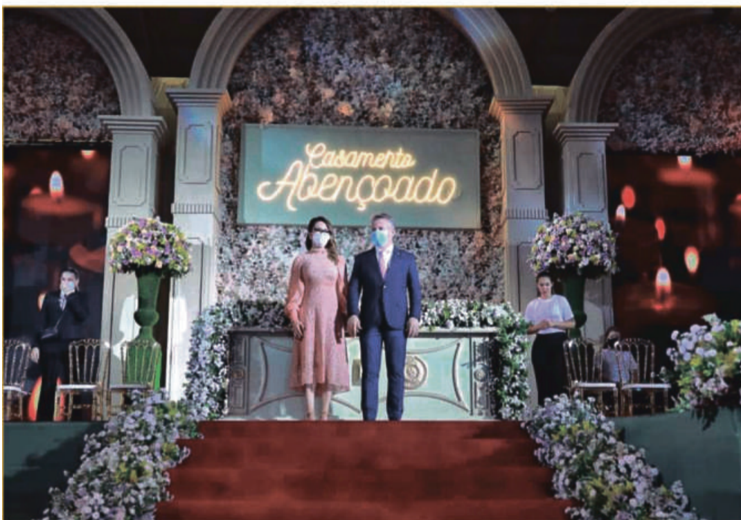
Governador Mauro Mendes e a primeira dama Virginia Mendes