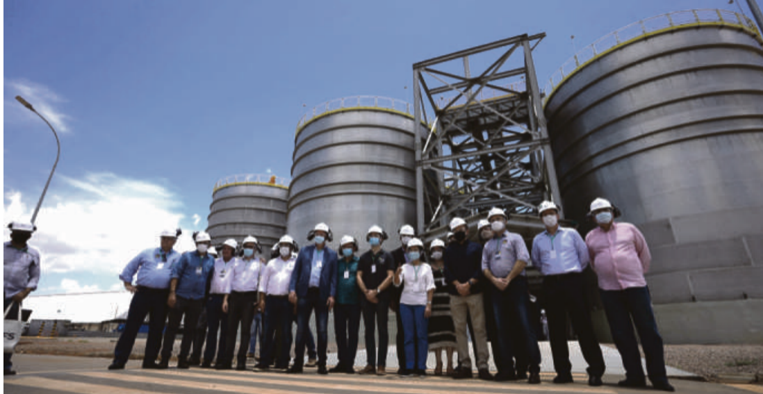
FS já tem 2 unidades em operação, em Sorriso e em Lucas do Rio Verde, e contém 4 unidades em projeto, Primavera do Leste, Campo Novo do Parecis, Querência e Nova Mutum

A nova usina é uma unidade eficiente do ponto de vista estratégico para FS, pois aumenta a proximidade com os fornecedores da região e amplia as chances de negócio. Além de ter capacidade de armazenar 600 mil toneladas de mi-