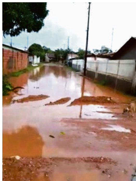
Com o início do período chuvoso, outra preocupação toma conta de moradores pois ruas se transformam em verdadeiros córregos

uma gota nas torneiras. Não temos asfalto, saneamento. Com o período das chuvas a situação se agrava e fica pior".