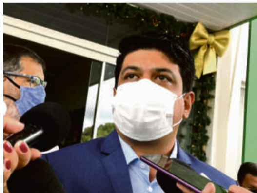
As promessas de campanha feitas por Kalil Baracat não saíram do papel para solucionar problemas crônicos que atingem os bairros

Segundo uma publicação da prefeitura de Várzea Grande no último dia 19, o município deve gastar R$ 1,48 milhão para a contratação da Pontes Comércio e Prestação de Serviços Ltda, empresa que funciona no Jardim Imperador e venceu a licitação para o fornecimento dos caminhões pipa. A publicação informa ainda que deverão ser disponibilizados caminhões pipa com capacidade de 8 mil a 20 mil litros.