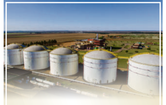
A FS é a primeira usina de etanol do Brasil que utiliza milho em 100% da produção. Hoje, com duas unidades no Mato Grosso, em Lucas do Rio Verde e em Sorriso, a empresa já é a maior produtora de etanol de milho do país, com capacidade para 1,4 bilhões de litros por ano. Além do etanol, a empresa possui tecnologia de ponta para a fabricação de produtos para Nutrição Animal, conhecidos pela sigla DDG (Dried Distillers Grains) óleo de milho e bioeletricidade.

Porém, mesmo com o cenário, a companhia registrou um aumento de 115% na venda do biocombustível na comparação anual. Além da entrada em operação da Unidade Sorriso, a abertura de novos mercados consumidores contribuiu para esse grande resultado positivo.