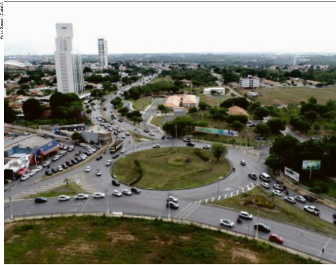
Melhoria na mobilidade urbana da Capital tem sido uma evolução constante promovida pela gestão Emanuel Pinheiro

“O prefeito Emanuel Pinheiro tem feito um trabalho de articulação em Brasília para conseguir os recursos necessários para essas importantes obras. Além dessas duas obras, também está nos planos do Município a construção de uma trincheira no Círculo Militar que está orçada em cerca de R$ 62 milhões. O