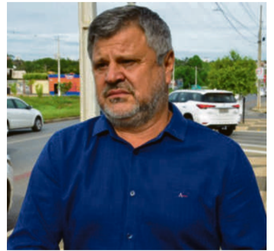
De acordo com Stopa as obras na Miguel Sutil vão transformar, modernizar e elevar Cuiabá para outro patamar

A melhoria na mobilidade urbana da Capital tem sido uma evolução constante promovida pela gestão Emanuel Pinheiro. Desde que assumiu o comando do Palácio Alencastro, em 2017, o prefeito tem feito importantes investimentos na área de infraestrutura. Além dos mais de 50 bairros pavimentados, nesse período, Cuiabá ganhou os dois primeiros viadutos construídos diretamente pelo Municí-