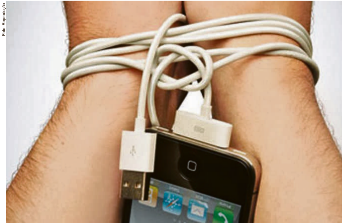
Pacientes enfrentam sintomas de abstinência quando os jogos são retirados, como por exemplo, irritabilidade, ansiedade e tristeza