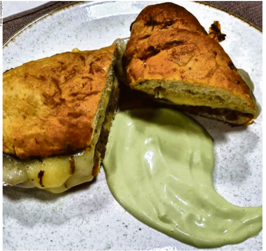
Trazendo a originalidade, sabor e lembranças de um belo final de semana na casa dos avós com toda família reunida

"Empreender não é algo fácil, existem muitas barreiras, ainda mais num período de alta do desemprego, preços altíssimos como combustível e alimentos, mas apesar de toda a dificuldade tem sido satisfatório principalmente por todo o feedback que temos recebido dos nossos cli-