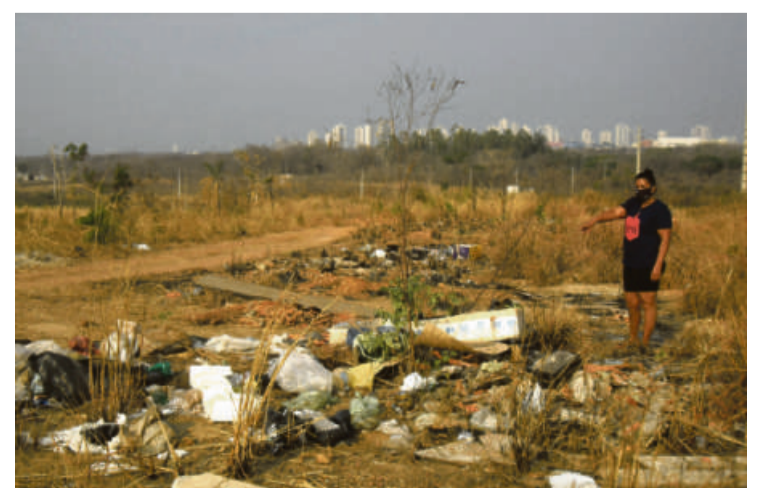
“Estrada da Guarita” - foram transformadas em verdadeiros depósitos de lixo a céu aberto

“Moro aqui há cinquenta anos e nunca vi tanto lixo e cachorro assim na vida”, resume Dalila Silva ao mostrar o crime ambiental à vista de todos.