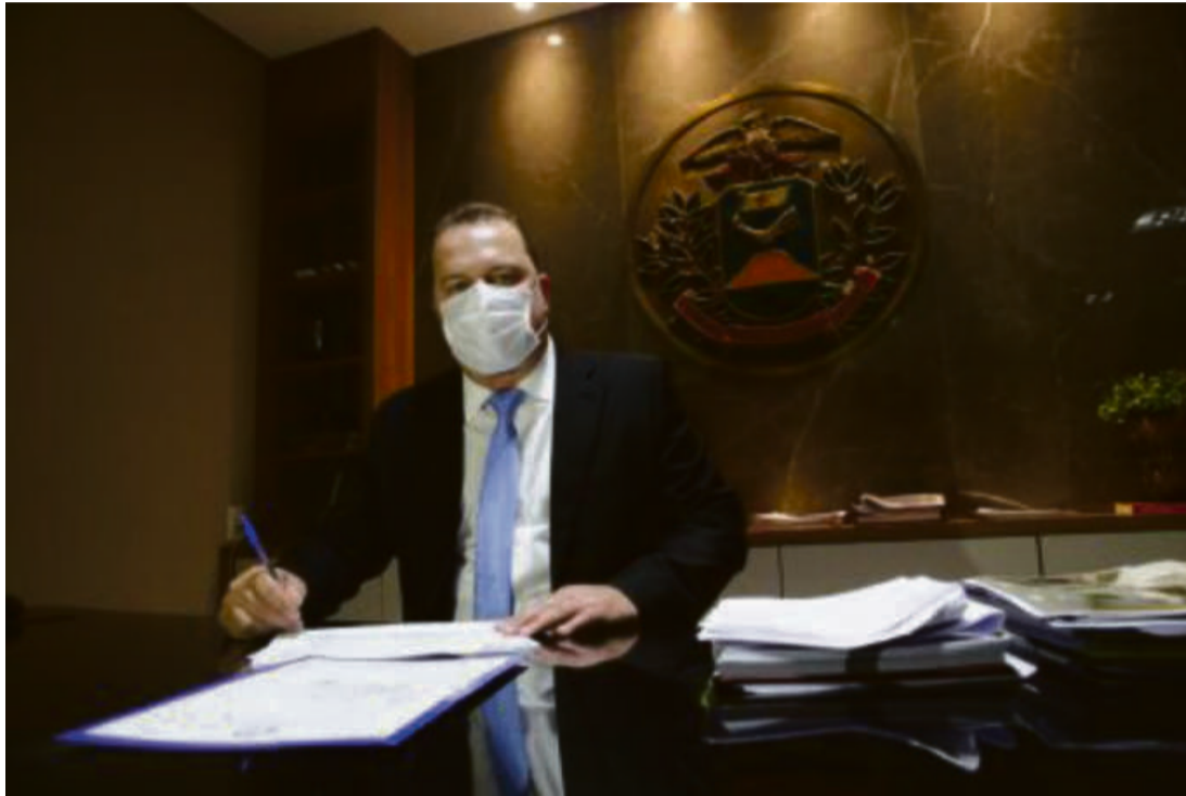
Parlamentar diz que todas ações têm a aprovação e incentivo dos deputados estaduais, que não têm medido esforços para cumprir políticas públicas

Uma das principais bandeiras do deputado é as redes de proteção social à população de Mato Grosso. Exemplo, é o programa de distribuição de renda "Ser Família", assim como a sua edição extra, o "Ser Família Emergencial", que atualmente atende a mais de 100 mil famílias de baixa renda que estão passando dificuldades por conta das ações de combate ao novo coronavírus. Do montante total investido, R$ 10 milhões são oriundos dos cofres do Legislativo.