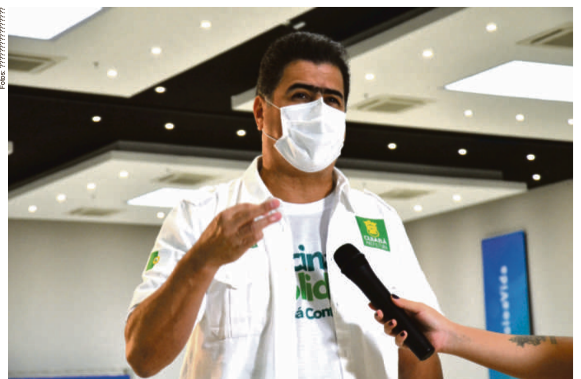
“Já que decidiram Cuiabá como uma das sub-sedes da Copa América, então que pelo menos contemple as cidades-sede com um lote maior para imunizar a população”, defende

ção do Governo Federal, Estadual e Confederação Brasileira de Futebol (CBF), não posso barrar”, disse.