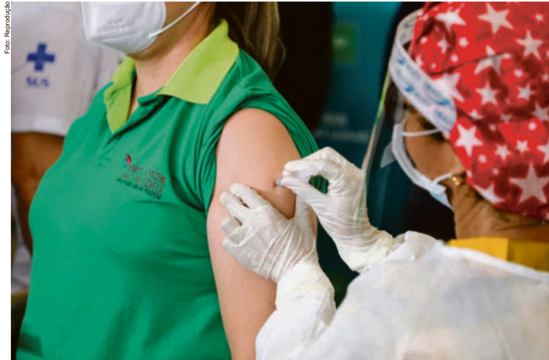
Na bula do imunizante, por exemplo, vem escrito que o paciente pode sentir dor local, no corpo, febre, cefaleia, vômito, diarreia, náusea, calor e mal estar

Na bula do imunizante, por exemplo, vem escrito que o paciente pode sentir dor local, no