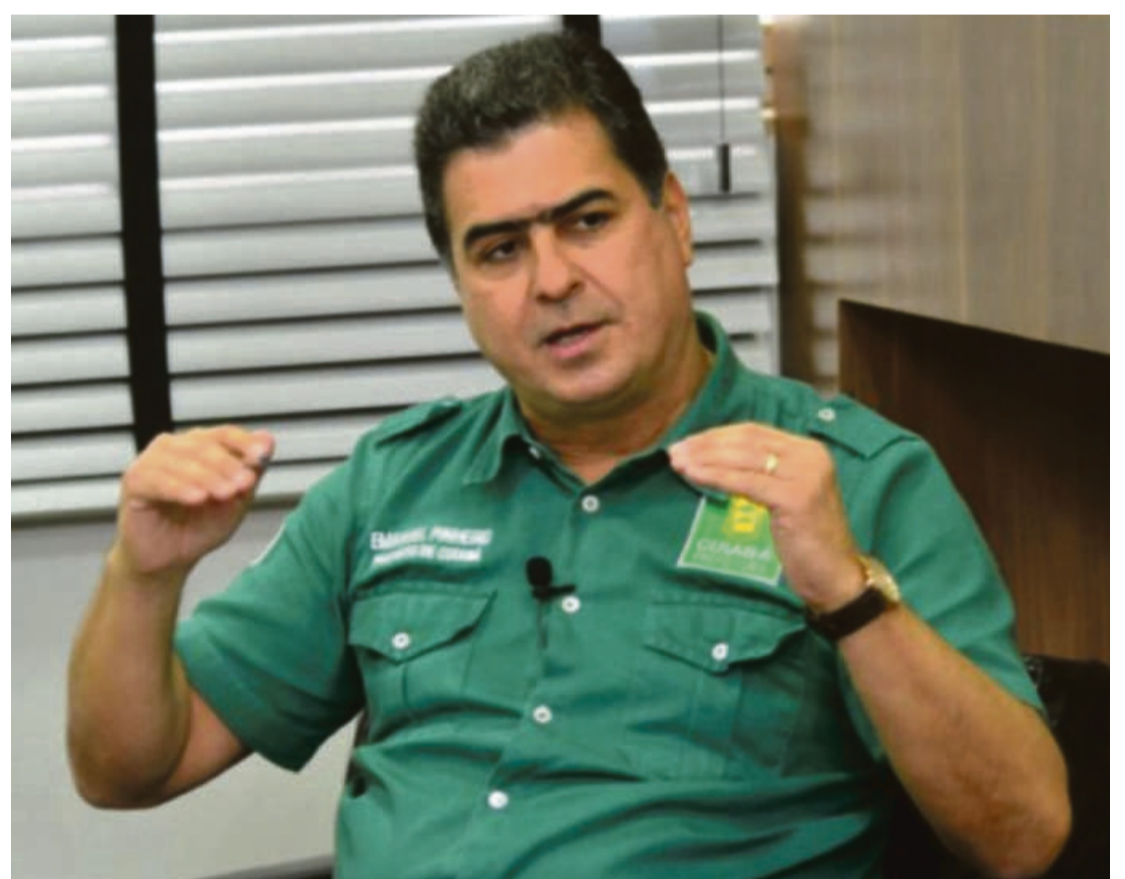
O chefe do Palácio Alencastro lembra que mesmo antes do anúncio do Ministério da Saúde, ele havia autorizado a abertura do cadastro para os profissionais da Educação serem vacinados