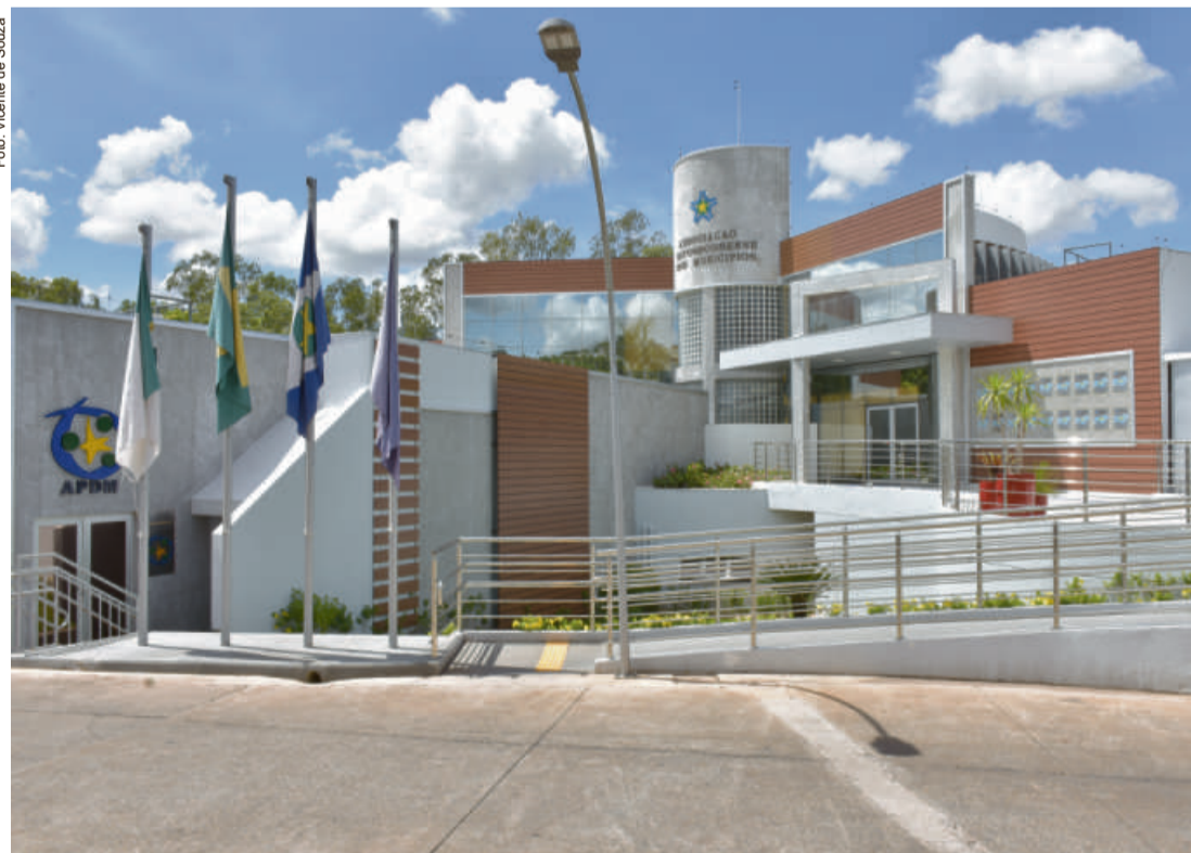
A data também foi lembrada por lideranças nacionais e estaduais que parabenizaram a AMM pelos 38 anos e destacaram a importância da instituição como pilar do movimento municipalista em Mato Grosso