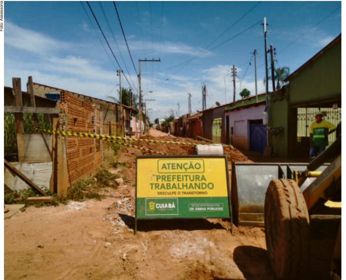
O projeto alcançará quatro ruas do bairro, onde já começaram com a escavação e implantação de uma nova tubulação

“Ninguém conhece melhor a realidade das comunidades que os próprios moradores. São eles que lidam, diariamente, com os problemas de cada uma das ruas. Nos casos de alagamento, não é diferente. Quem sofre é o morador. Por isso, é tão importante essa união dos representantes desses bairros com o poder público. No fim, todos ganham”, disse Stopa.