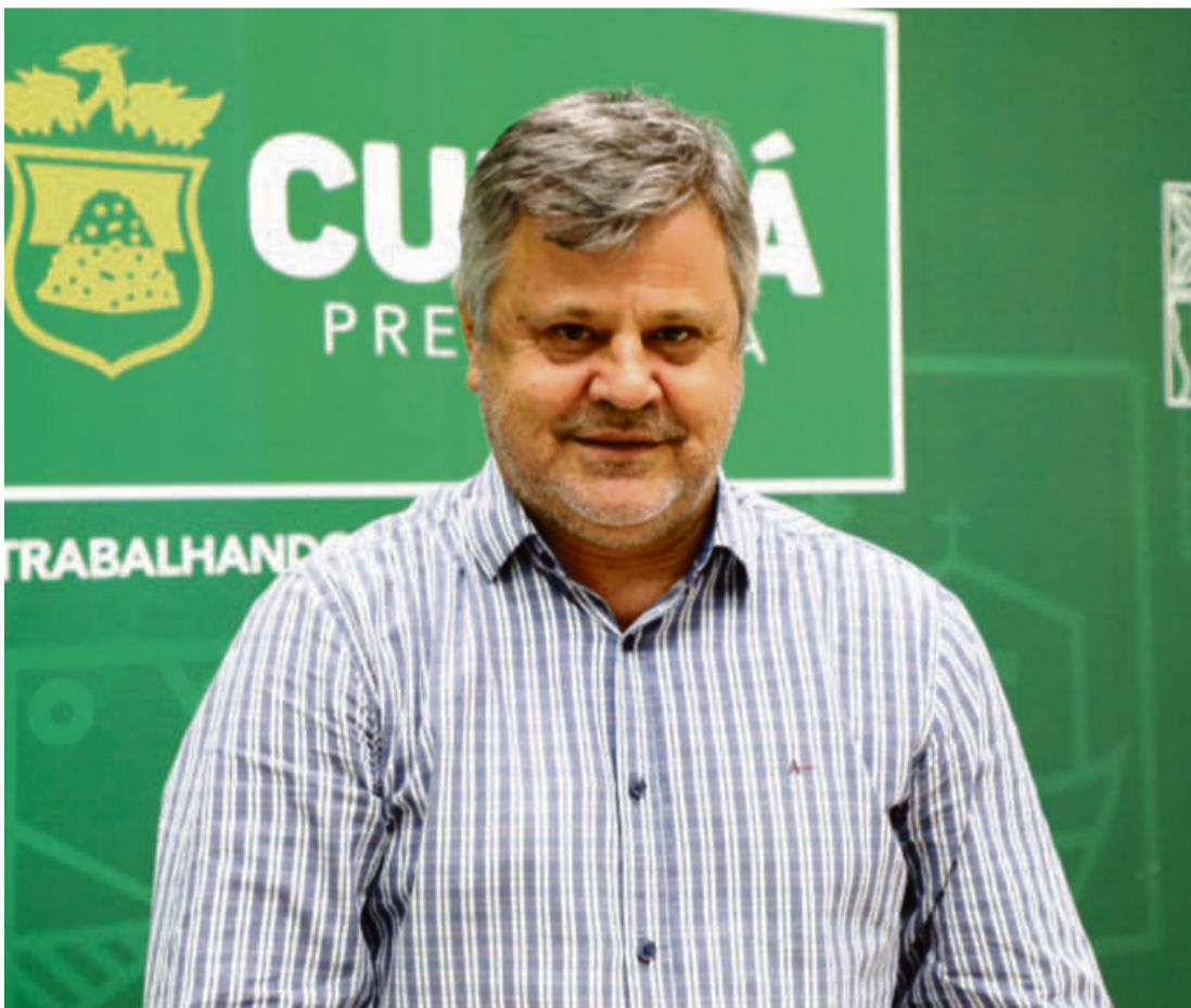
Lucas Leite Da Redação

A previsão para a conclusão da obra no bairro São Gonçalo é em cerca de 45 dias