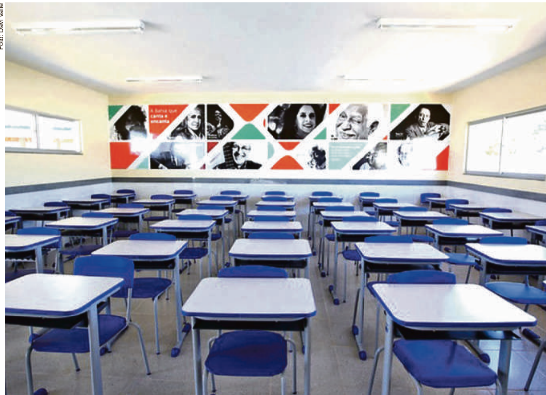
A partir de 2021, os registros aumentaram significativamente entre os trabalhadores da educação na ativa, e com faixa etária entre 30 e 50 anos

O primeiro e mais grave é que em um período de menos de duas semanas, cresceu 45% as notificações de mortes dos profissionais da rede. O número ainda não é exato, porque o sindicato registra apenas as subnotifica-