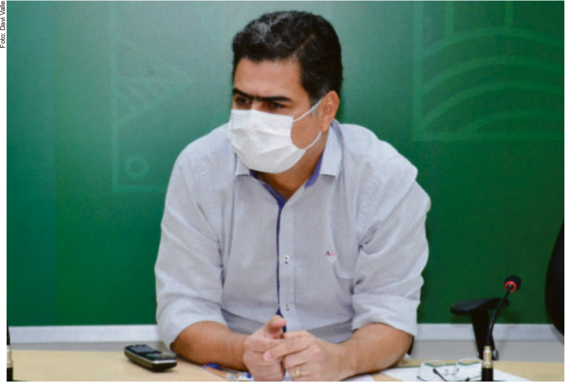
Emanuel não vem medindo esforços e vem trabalhando diuturnamente no combate à doença em Cuiabá

“Estamos trabalhando no limite, mas a Saúde é prioridade, o combate a covid-19 é prioridade, e eu vou fazer gestão, apertar os cintos,