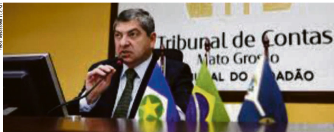
Maluf afirmou que mesmo diante de tantas dificuldades, órgão deu continuidade aos trabalhos em MT

Além disso, em relação à Covid-19, o TCE-MT também recomendou que os municípios mantenham atualizados os dados do sistema do Ministério da Saúde SIPNI sobre os vacinados