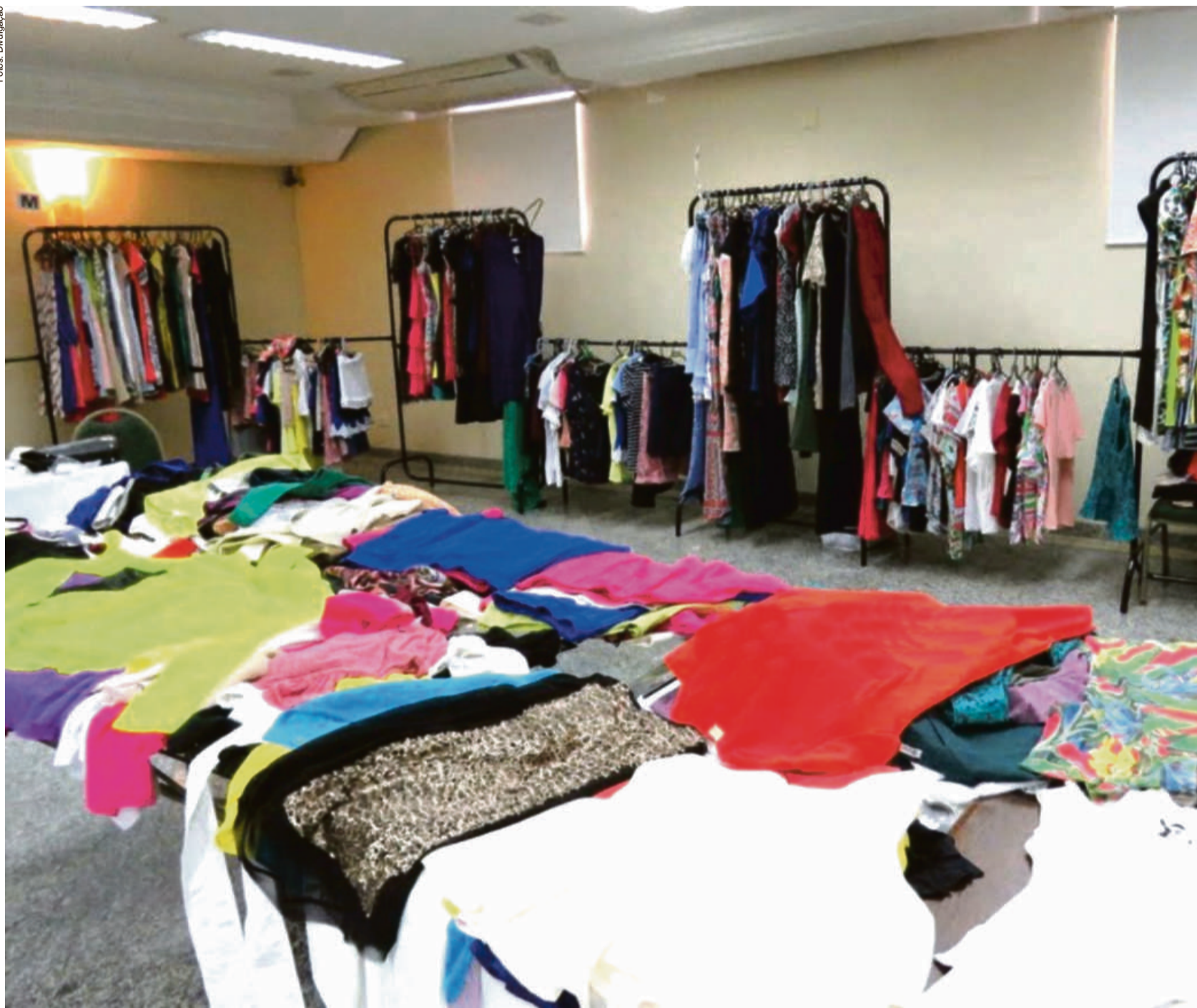
Cerca 200 peças já foram catalogadas, entre as peças que já estão disponíveis, os valores variam de R$ 200 a 2.300 reais

Além das ações sociais que a primeira-dama coordenada no Governo do Estado por meio da UNAF e da SETASC, na sua minha vi-