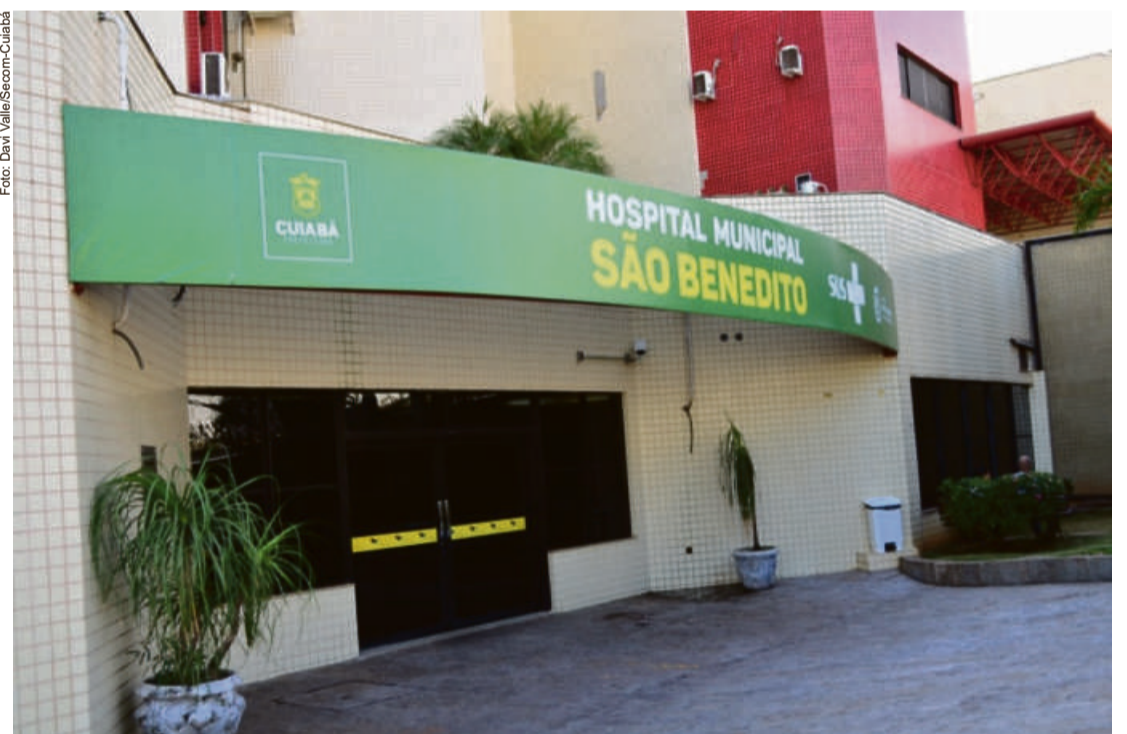
Além do reforço na terapia intensiva, Cuiabá passará a contar com mais 109 leitos de enfermaria exclusivas para pacientes com covid-19, sendo 18 na Unidade de Pronto Atendimento (UPA) do Verdão

que a Capital mais precisa, já que os casos de coronavírus estão aumentando e os leitos de UTI e Enfermarias estão ficando em falta.