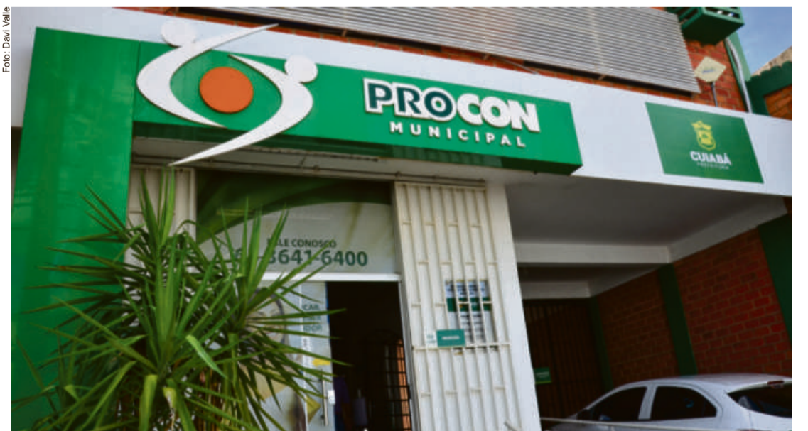
Ação é realizada pela Associação Brasileira de Procons- ProconsBrasil e acontece exclusivamente de forma on line

Neste momento, o consumidor fará o seu relato da situação e informar que deseja participar