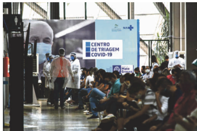
Mauro Mendes afirma que Centro de Triagem é um sucesso pois ajuda a salvar milhares de vidas

O local fornece serviços de atendimento inicial a casos de covid-19, como forma de ajudar na atenção básica da Baixada Cuiabana. Cerca de 378 profissionais - entre médicos, enfermeiros, técnicos de enfermagem, equipe administrativa e outros -, trabalham no Centro de Triagem.