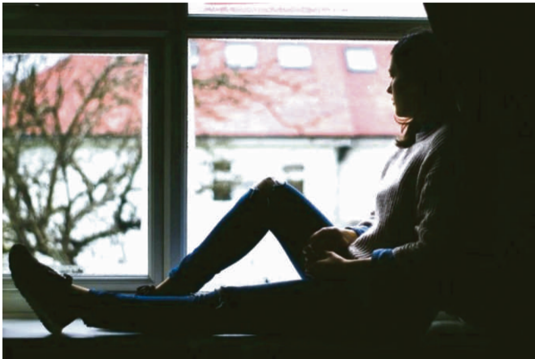
Estudo relatou níveis significativos de propensão a ansiedade e depressão associadas aos impactos da pandemia

Reinventar-se foi a forma como eles acharam de continuar no mercado de trabalho.