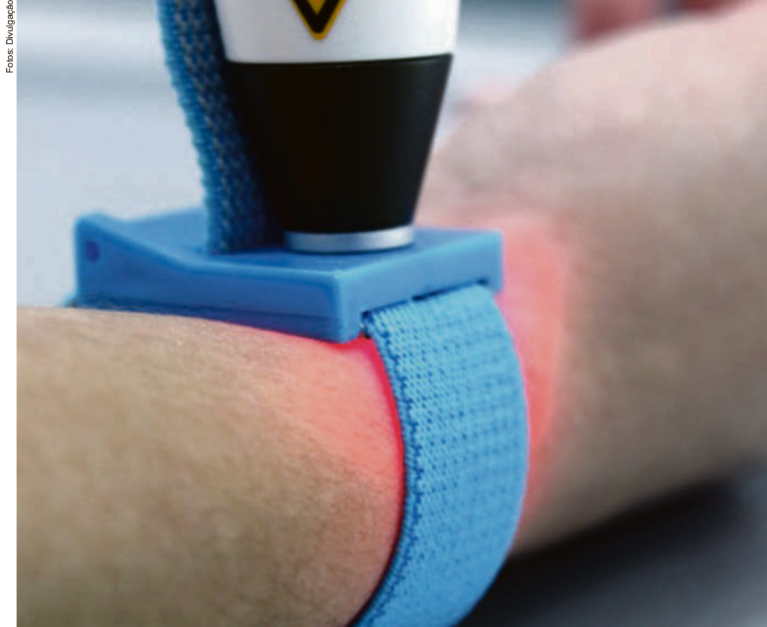
A técnica não deve ser usada em pacientes portadores de fotossensibilidade, arritmias complexas e insuficiência cardíaca, neoplasias hematológicas, glaucoma não controlado, em grávidas ou se a área for tatuada

“O laser combate a dor, ajuda na cicatrização da pele, favorece a melhora na capacidade