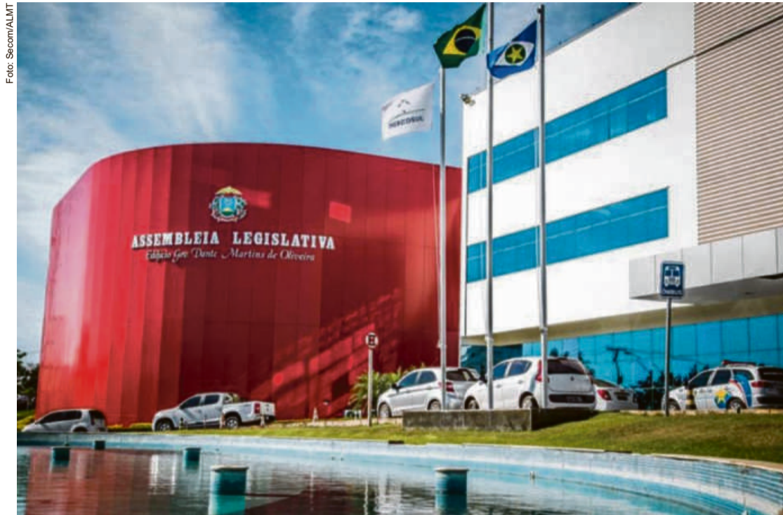
Além de Janaina, pelo menos 15 deputados testaram positivos para a covid-19 durante o período de pandemia. O deputado Fávero, já é considerado caso de reinfeção da doença

No dia 25 de fevereiro, a Presidência da Casa, anunciou o fechamento do local por 12 dias após o aumento de casos da doença. Porém, precisou se estender já que além de servidores