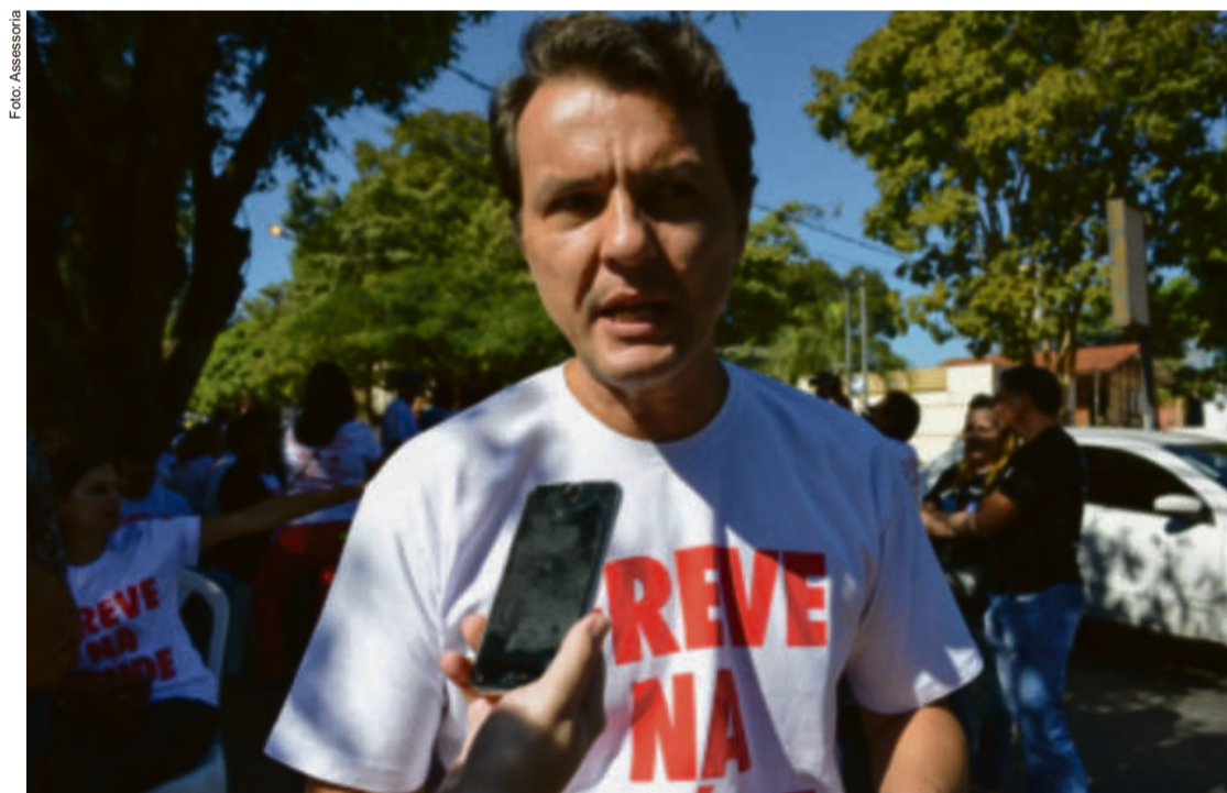
"Sou cuiabano e filho de cuiabanos e lutarei dia e noite para ajudar nosso povo a superar a pandemia da covid-19 com nosso trabalho na área do turismo"

"O certo é que muitas pessoas deixaram de sair de casa ou tiveram que fechar as portas. Então para o sistema não entrar em colapso nós vamos ouvir as necessidades das empresas do ramo e assim planejar, organizar e executar as ações", disse.