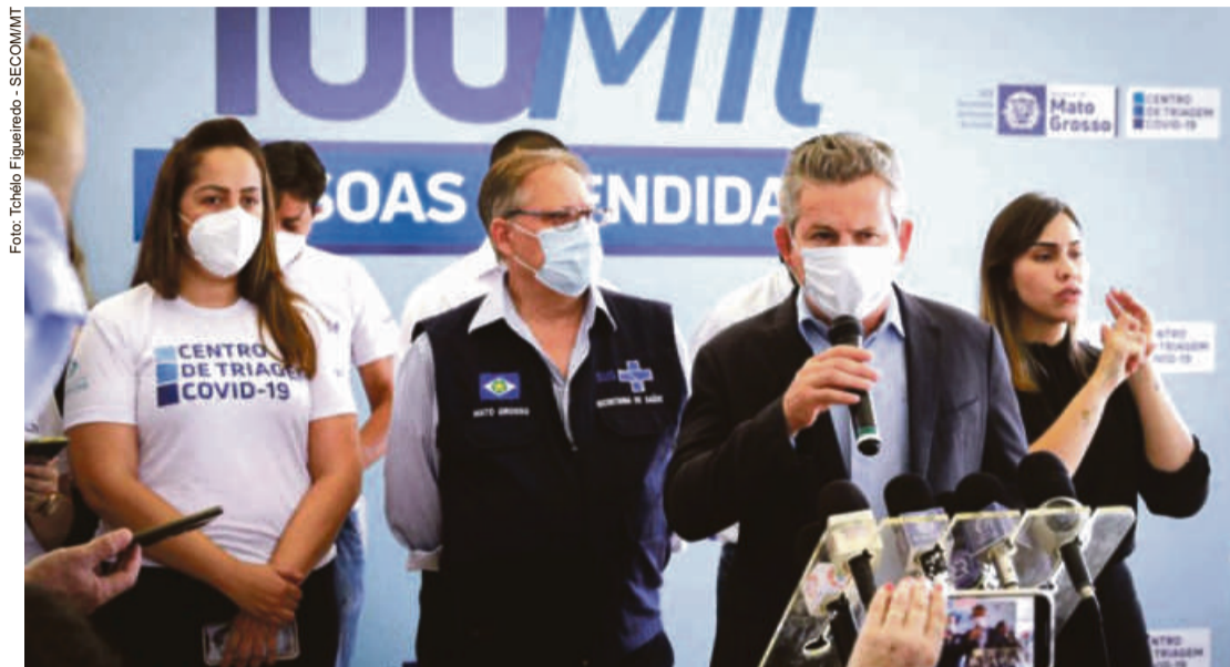
Centro de Triagem tem contribuído para a redução do número de internações hospitalares e de óbitos causados pelo coronavírus

“O Centro de Triagem Covid-19, instalado na Arena Pantanal, em Cuiabá, é um sucesso que ajuda a salvar centenas, milhares de vida”, afirma o governador Mauro Mendes.