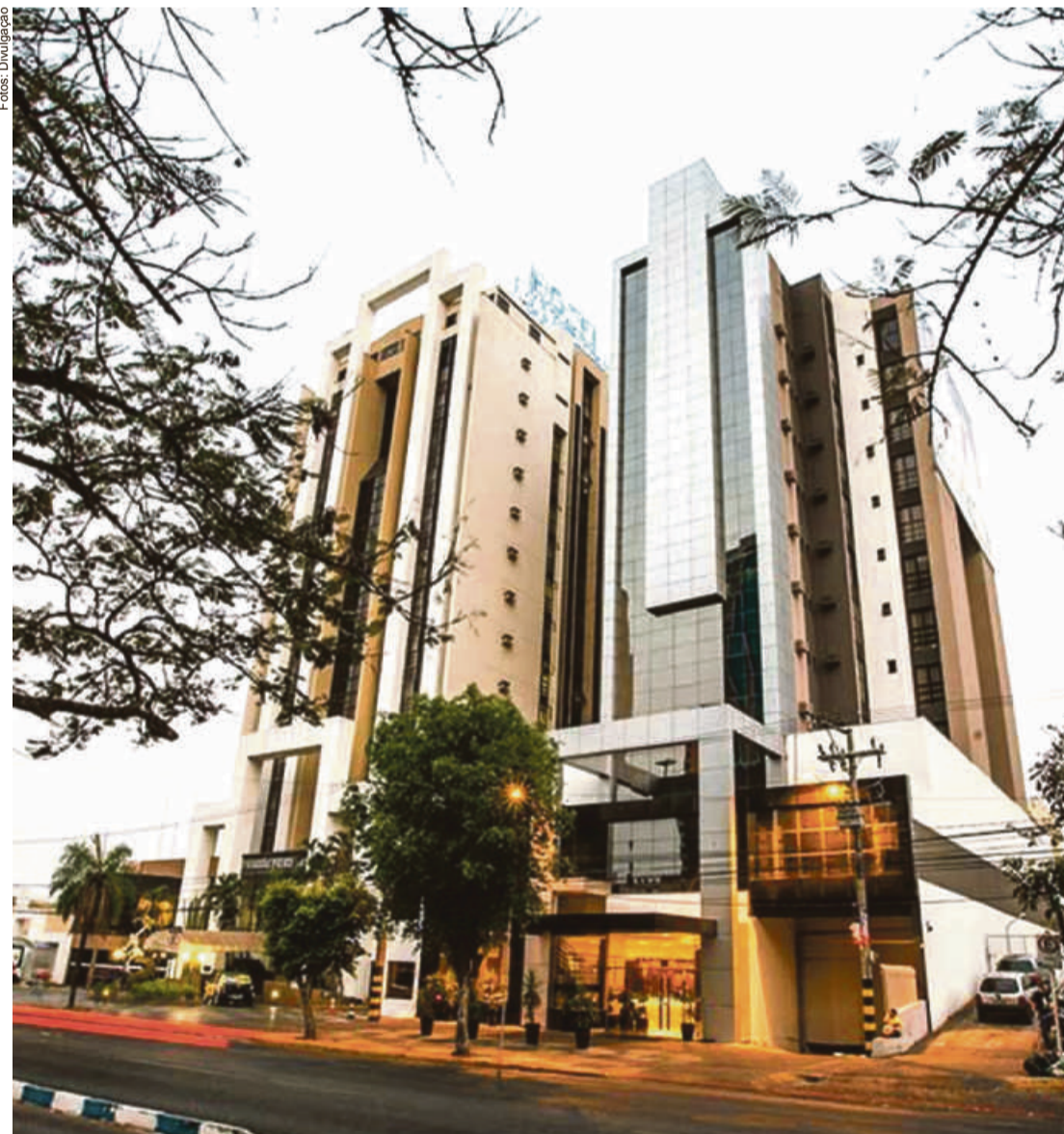
Rede de Hotéis Mato Grosso caminha rumo à expansão, planejando novos investimentos, remodelagem e renovação dos hotéis existentes

"Nós acreditamos que é devido a essa segunda onda da covid, o pessoal está bem preocupado e tem evitado viajar novamente", pontua.