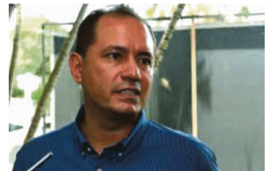
Empresário ressalta que para atravessar período de crise, a Rede vem enxugando as despesas ao máximo e aguardando a questão da vacina

O empresário cita que há também um lado positivo da situação, com o Governo do Estado tendo feito investimentos na área do turismo, com grandes projetos, principal-