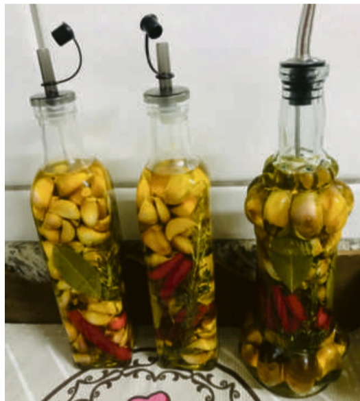
Azeites são feitos com produtos de primeira qualidade, pimenta, alho, ervas entre outros