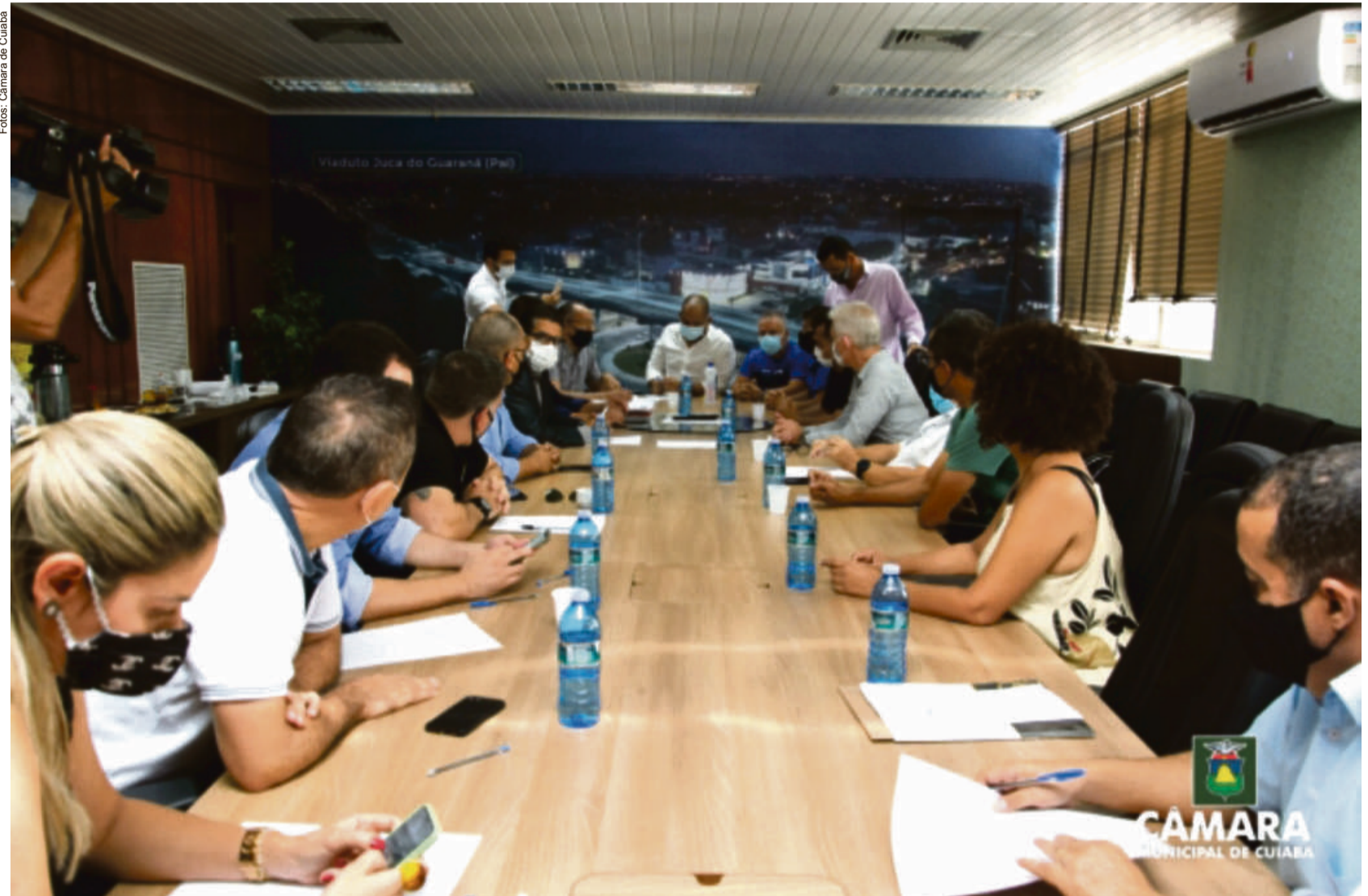
E o mais importante é que a prioridade da nova diretoria será garantir o direito de cada vereador de legislar e fiscalizar

O Legislativo cuiabano e estadual devem realizar audiências conjuntas para discutir mudança anunciado pelo governo do Veículo Leve sobre Trilhos (VLT) para o BRT (Ônibus de Transporte Rápido). As Casas de Leis