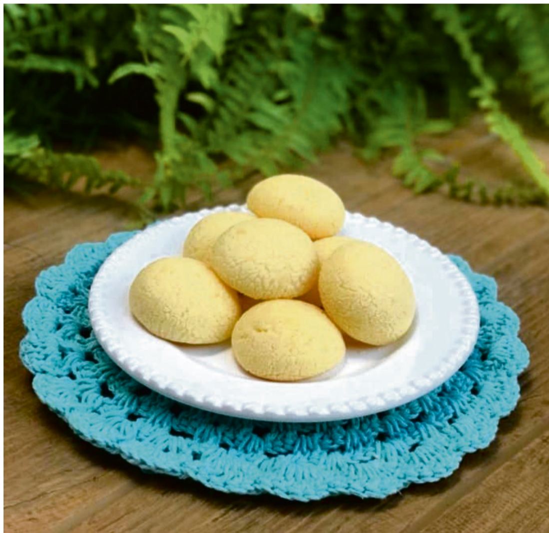
Prestes há completar um ano nos próximos meses, a procura pelos produtos têm aumento durante pandemia

Produtos artesanais conquistaram importantes clientes, e passaram a dar vazão à criatividade e novos sabores