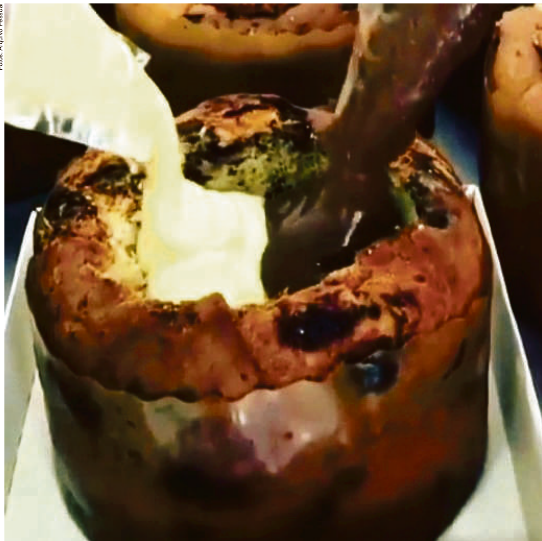
Panetones geralmente são recheados com frutas secas e chocotone, doce de leite e outros recheios