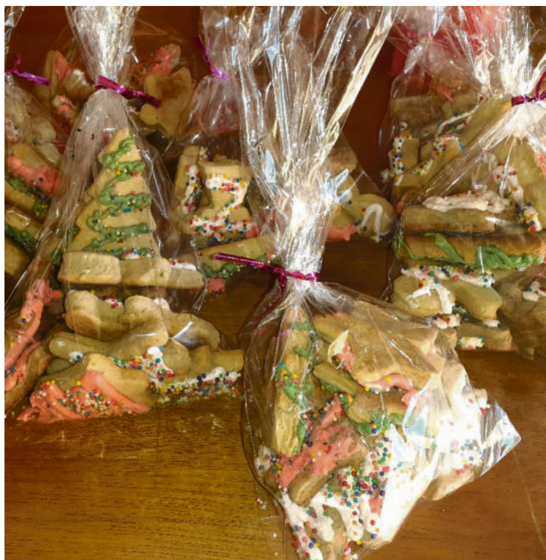
Além de panetones, uma boa opção de presentes é os biscoitos amanteigados que são vendidos em embalagens natalinas