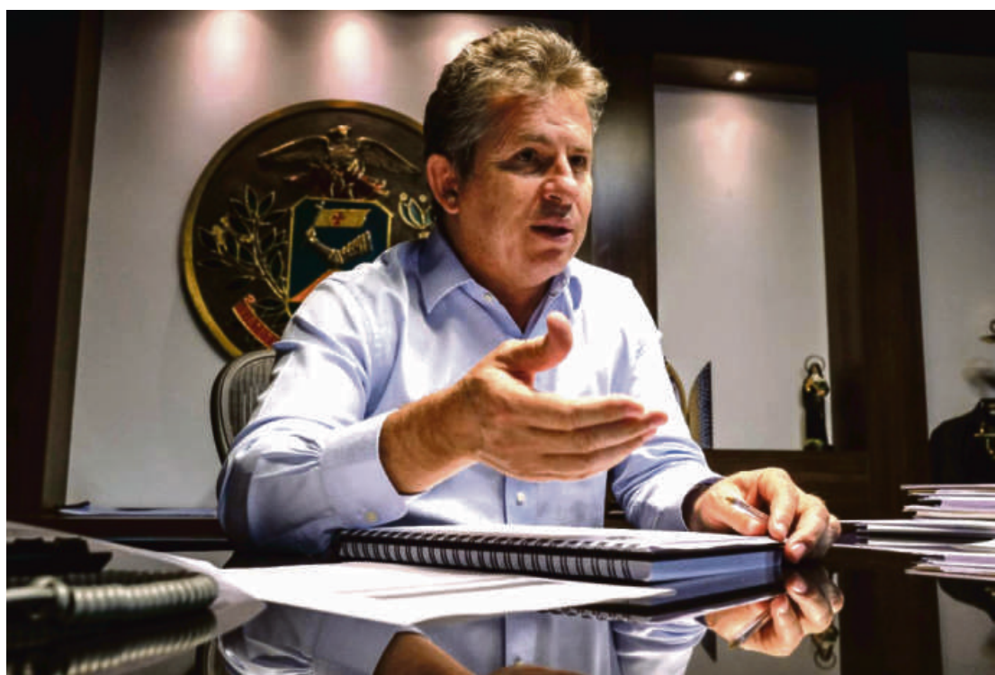
Mauro Mendes já deixou claro que vai trabalhar com os 141 prefeitos de Mato Grosso, sejam eles de qualquer partido, seja aliado ou não

“Tenho minhas convicções, já me posicionei claramente sobre alguns temas que foram abordados. Mas nunca coloquei as diferenças com qualquer político de Mato Grosso acima do interesse público. Eu governo para os mato-grossenses. Vou trabalhar com os 141 prefeitos de Mato Grosso, sejam eles de qualquer partido, seja aliado ou não. Fui eleito para trabalhar para os mato-grossenses e farei isso”, disse o democrata.