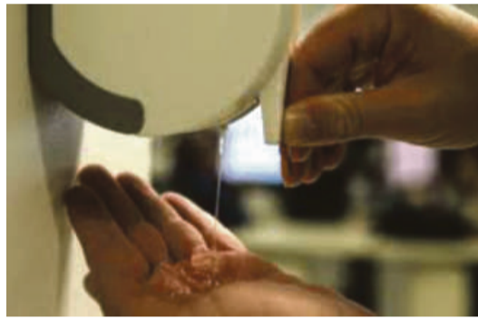
De acordo com as medidas implantadas pela Infraero todos os aeroportos tem que ter disponibilidade de álcool em gel, sabonete líquido e papel toalha

do, o secretário Gilberto Figueiredo, titular da SES, foi flagrado pelo CO Popular no local sem o uso da máscara.