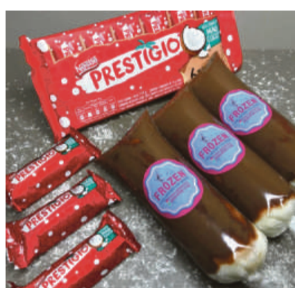
O geladinho ganhou roupa nova e está bem estiloso com mais sabor dentro do saquinho

“A ideia era vender mais no prédio onde moro e várias pessoas vendem seus produtos. No primeiro dia, me surpreendi não espera receber muitos pedidos. As vendas foram além do que esperava. Nesse primeiro dia, um representante do iFood conversou comigo sobre minha entrada na plataforma. Devido a grande quantidade de pedidos e ao bom re-