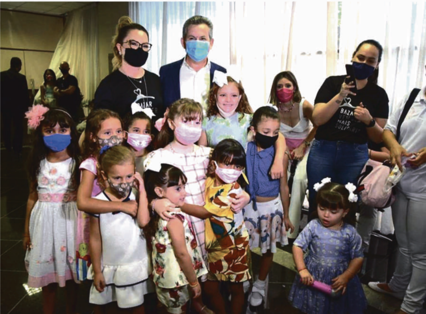
Governador Mauro Mendes e Virginia Mendes felizes com o sucesso do bazar