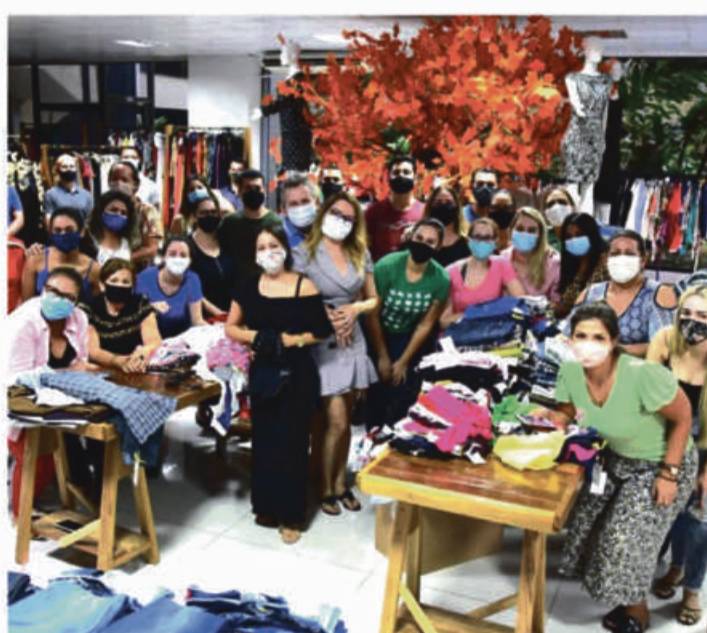
Bastidores do bazar Vem Ser Solidário