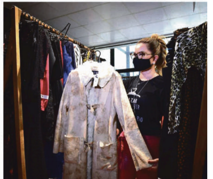
A primeira dama Virginia Mendes com peça exclusiva do bazar