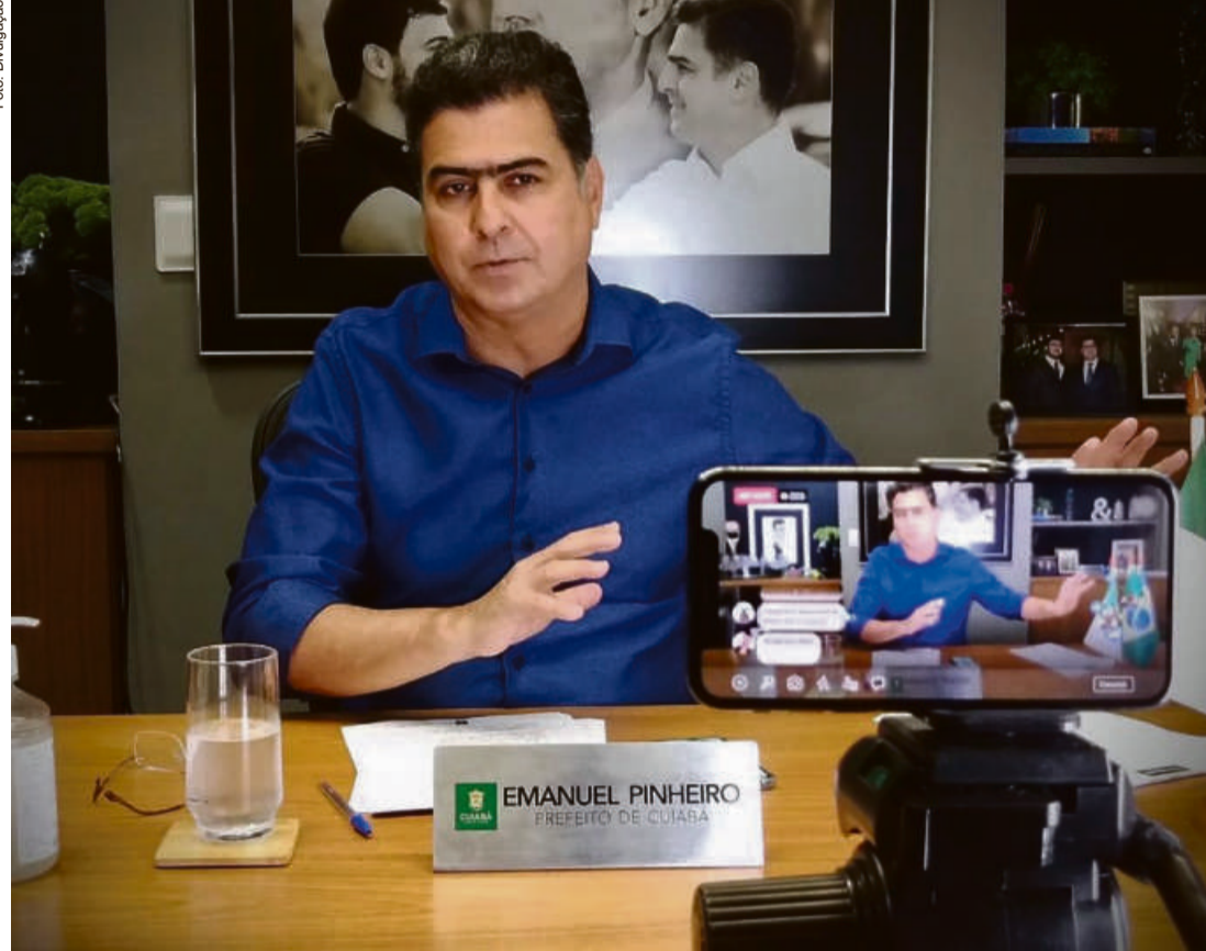
Prefeito Emanuel Pinheiro lembra que vai entregar muito mais obras que prometeu, beneficiando todos os bairros da Capital

Para se ter uma ideia, mesmo com as dificuldades, inclusive no âmbito financeiro, impostas