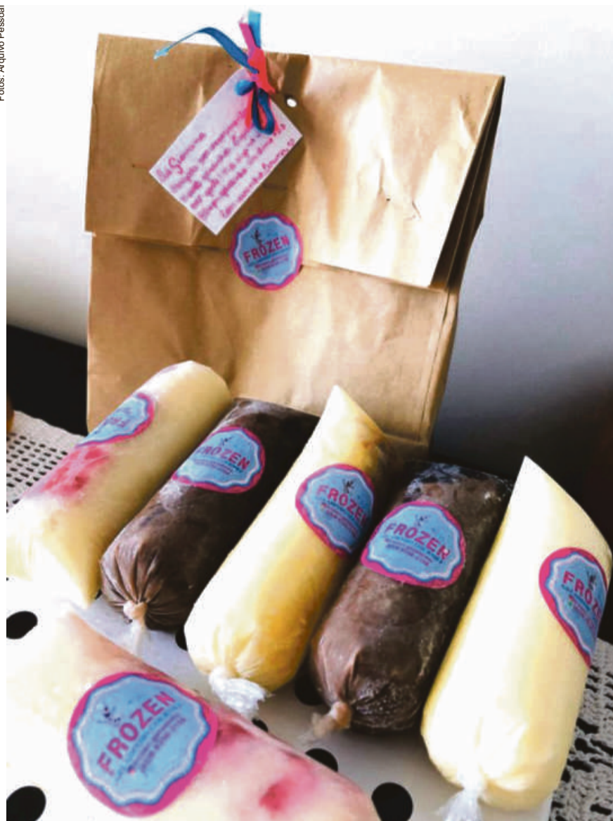
Com forte calor as pessoas optam por bebidas refrescantes e geladas, como por exemplo, o geladinho