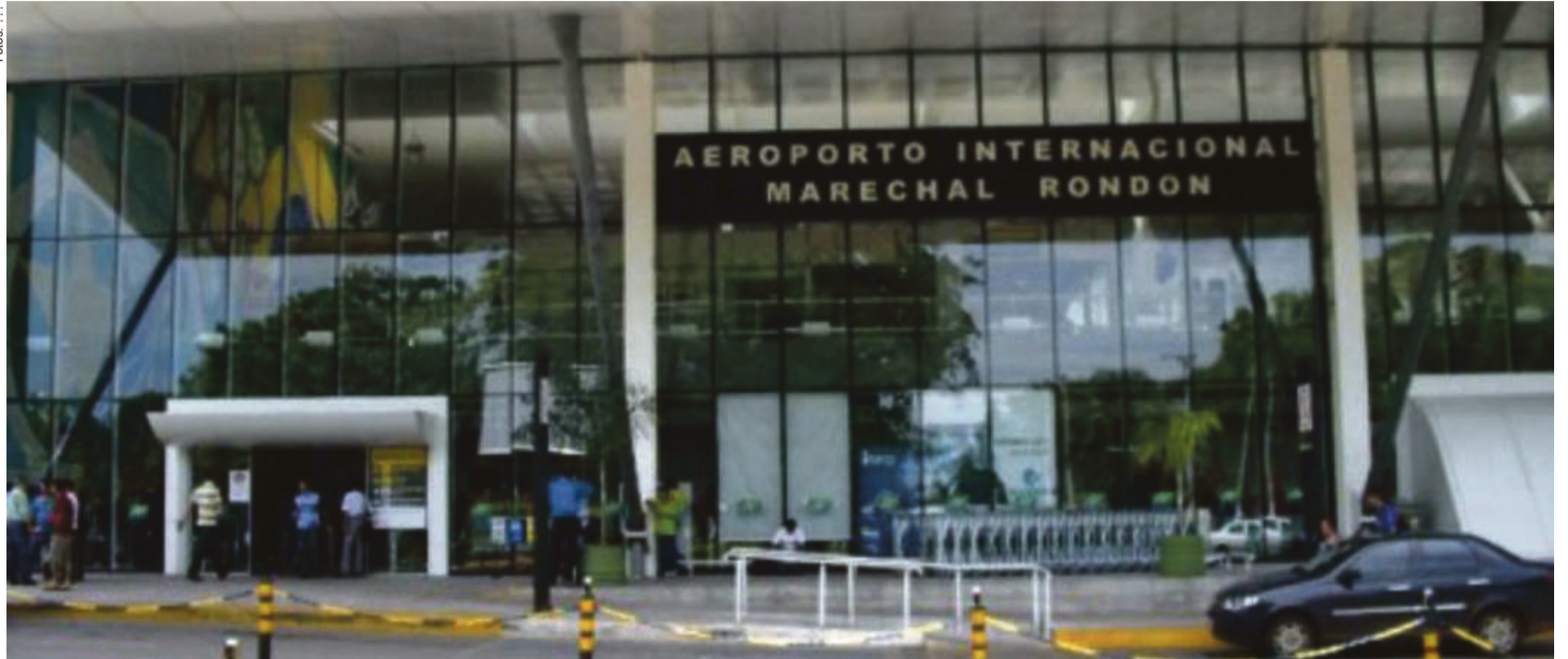
No Aeroporto Marechal Rondon, que foi privatizado e está sob a responsabilidade da concessionária COA, as regras sanitárias são desprezadas