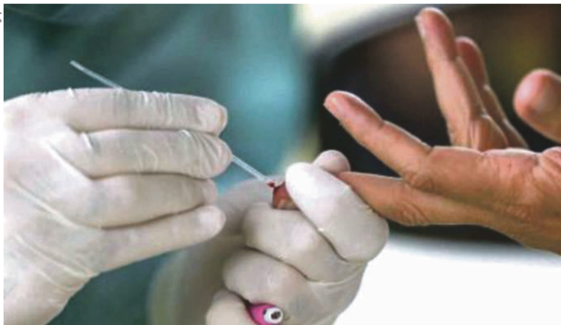
A metodologia utilizada será a estratégia quantitativa e transversal e a realização se dará por meio de teste de sangue