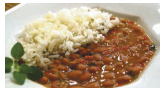
Ingredientes de um prato típico da cozinha, o arroz e o feijão formam uma importante combinação que fornece todos os aminoácidos essenciais para o corpo

Arruda acostumado a fazer a compra no mês uma rede de atacarejo em Várzea Grande aponta que os valores cobrados pelo preço do arroz, feijão e o óleo irão comprometer