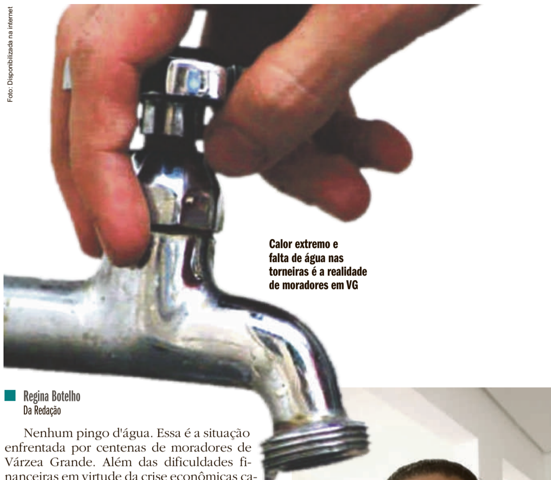
Calor extremo e falta de água nas torneiras é a realidade de moradores em VG

Vários fatores transformam um problema crônico de falta de água em um suplício para a população da segunda maior cidade de Mato Grosso