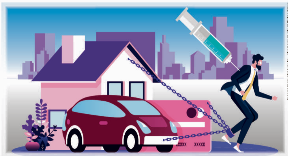
Imagens Ilustradas Free Pk - Montagem de arte de Kluber Simon

Sem contar a situação dos juros do país. Verdade seja dita... baixaram. Entre fevereiro e junho, os juros médios do rotativo do cartão caíram de 322,8% para 300,3% ao ano; as taxas do cheque especial foram de 130,6% para 110,2% ao ano. Seria até cômico se não fosse tão trágico.