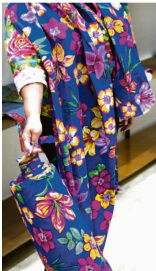
Loja Chita & Fuxico contempla em seu eixo estrutural a qualificação e a geração de renda, de mulheres em situação de vulnerabilidade social, por renda, vítimas de violência doméstica