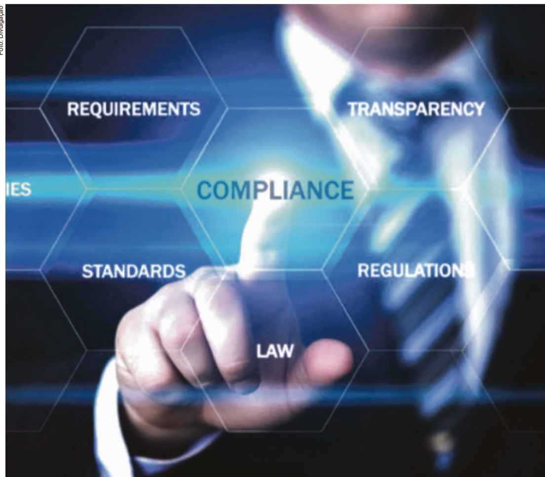
Compliance é o dever de estar em conformidade com atos, normas e leis, para seu efetivo cumprimento

Auxilia na organização íntegra dos partidos políticos e candidatos dando principalmente