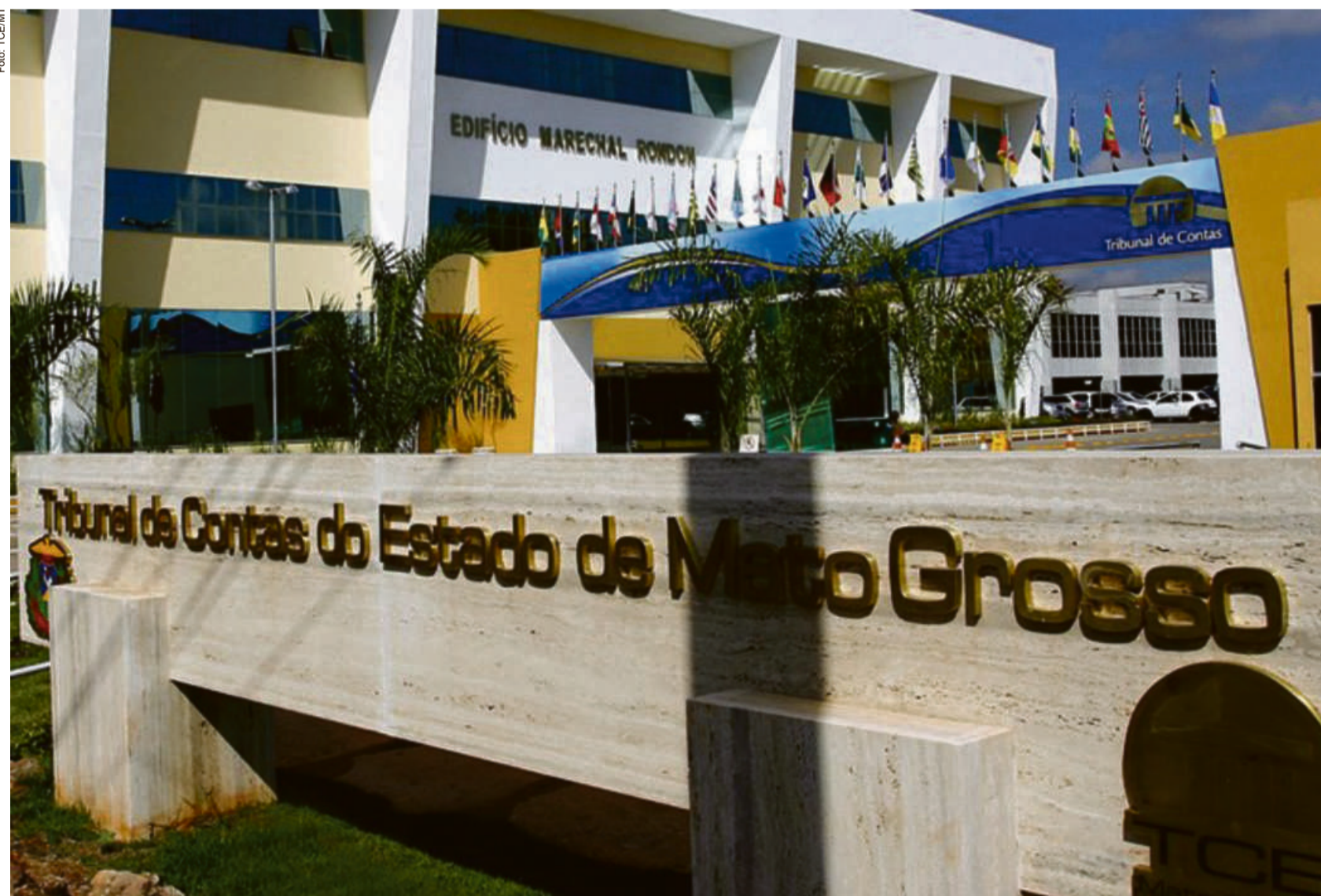
Logo na entrada do TCE-MT, os servidores e colaboradores têm a temperatura corporal aferida.

Os sete protocolos de biossegurança estabelecem diretrizes gerais para a limpeza e desinfecção das dependências do TCE-MT, Monitoramento de casos suspeitos e confirmados da Covid-19 no TCE-MT, diretrizes de biossegurança para comportamento individual, diretrizes para o controle de acessos, sinalização e adequação dos ambientes no TCE-MT, diretrizes gerais para a realização de eventos e treinamentos, diretriz geral para o transporte de passageiros do TCE-MT e diretrizes gerais para os serviços de alimentação.