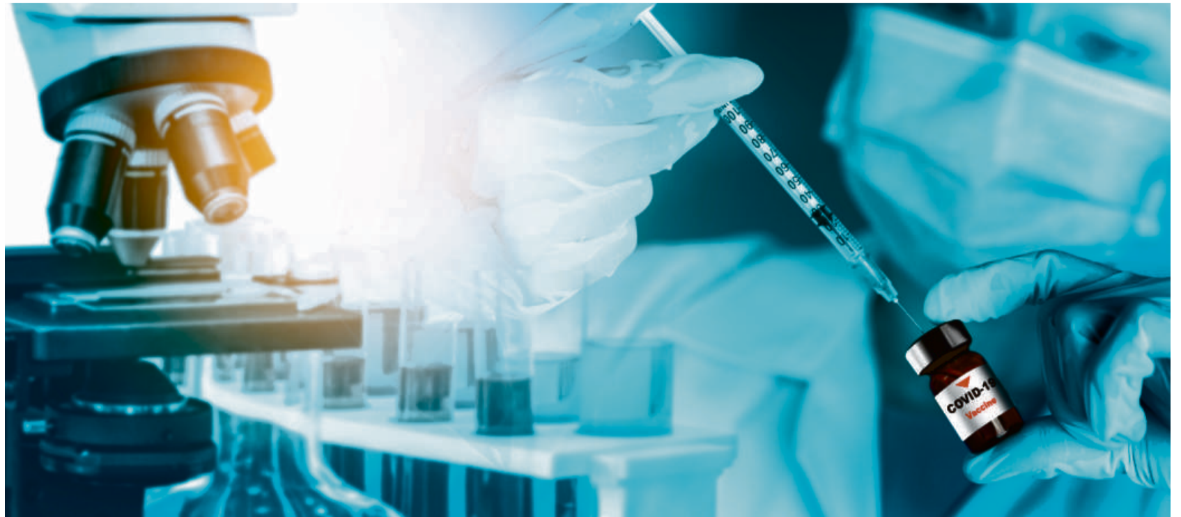
Coleta de dados está prevista para acontecer até o dia 23 deste mês e a redação final dos resultados deve ser divulgada em outubro

“Após a coleta, acreditamos que em 48 horas teremos a análise, uma vez que a capacidade de automatização do Lacen é alta e nos permite ter um tempo de resposta muito rápido na parte laboratorial”, comenta o secretário