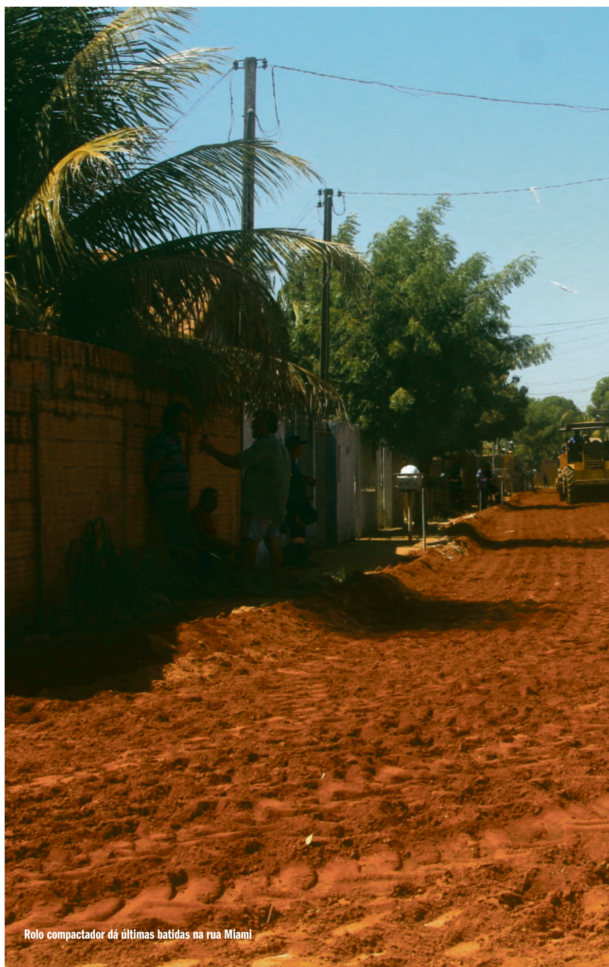
Rolo compactador dá últimas batidas na rua Miami

"Asfalto novo significa qualidade de vida, pois são ruas que antes eram de terra e agora estão asfaltadas. E essas obras incluem drenagem, construção de galerias pluviais, colocação de meio fio, guias e sarjetas, por fim, a pavimentação. Essa infraestrutura vai garantir que as águas das chuvas serão escoadas de forma correta, evitando transtornos aos motoristas e maior durabilidade ao pavimento, além de novo visual, limpeza e valorização de toda a cidade", destaca o prefeito.