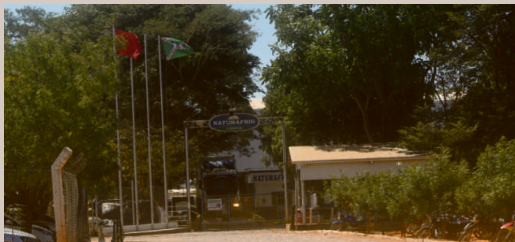
Frigorífico Naturafri abate 380 cabeças por dia e exporta para a china

Deputado federal foi o responsável pelo aporte de recurso no valor de R$ 4,8 milhões que estão sendo destinados à pavimentação do acesso ao frigorífico. Ele ressalta que a região é uma das que mais crescem no Estado e a obra de pavimentação vem de encontro ao desenvolvimento do município.