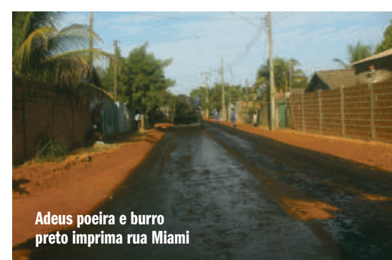
Adeus poeira e burro preto imprima rua Miami