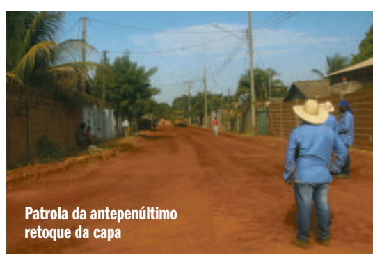
Patrola da antepenúltimo retoque da capa