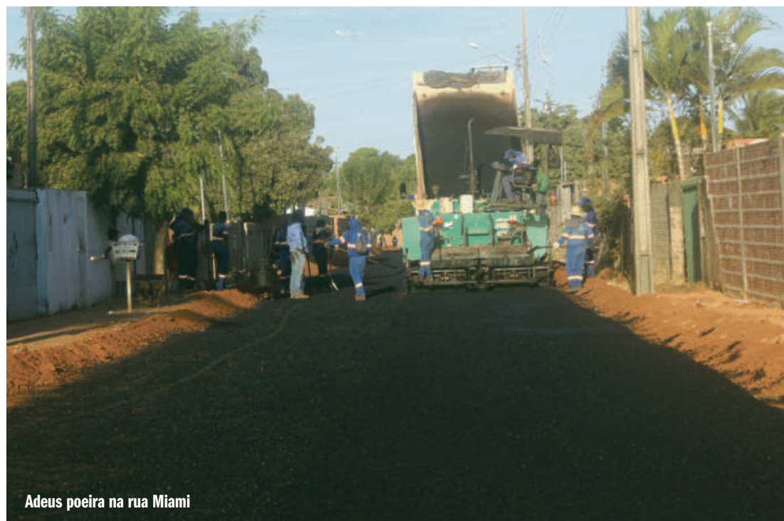
Adeus poeira na rua Miami