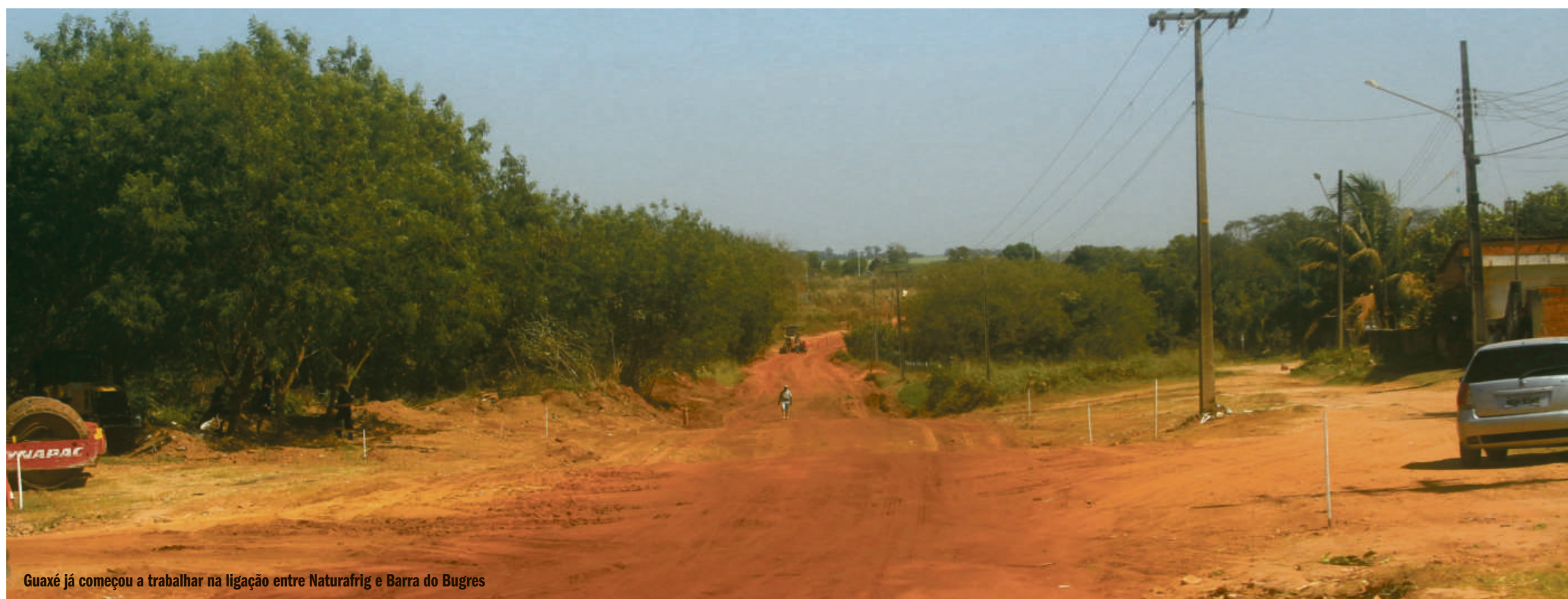
Guaxé já começou a trabalhar na ligação entre Naturafriq e Barra do Bugres