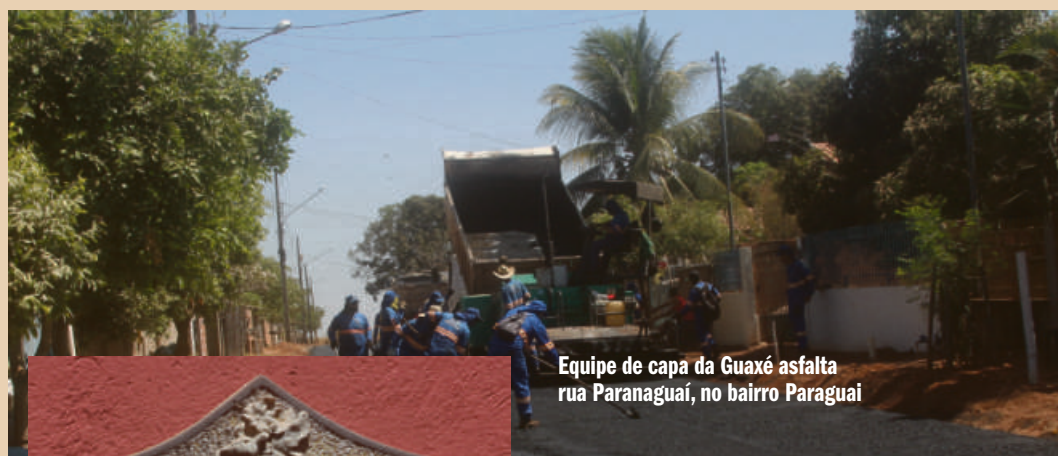
Equipe de capa da Guaxé asfalta rua Paraguai, no bairro Paraguai

Guaxe Construtora tem hoje 140 trabalhadores em várias frentes de trabalho, dando atenção especial à parte de drenagem e terraplanagem