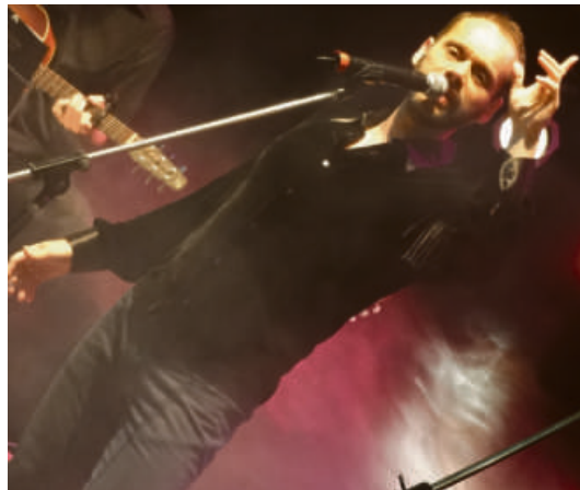
Live Solidária Musical terá a participação do cantor Carlos Navas que acontece no Estúdio Br 378

A live será transmitida pelo canal do artista no Youtube, compartilhada pelo Instagram da BPW Cuiabá @bpwcuiaba e do próprio Navas.