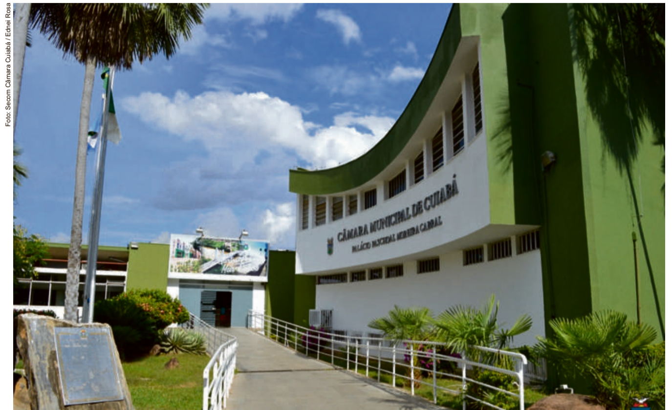
Câmara continua desacreditada frente à população, que vê os interesses dos vereadores sobressaírem aos da população

O MPC apontou inúmeras irregularidades no projeto que concedeu o reajuste aos servidores efetivos do órgão, entre elas a falta de consideração ao previsto na Lei Comple-