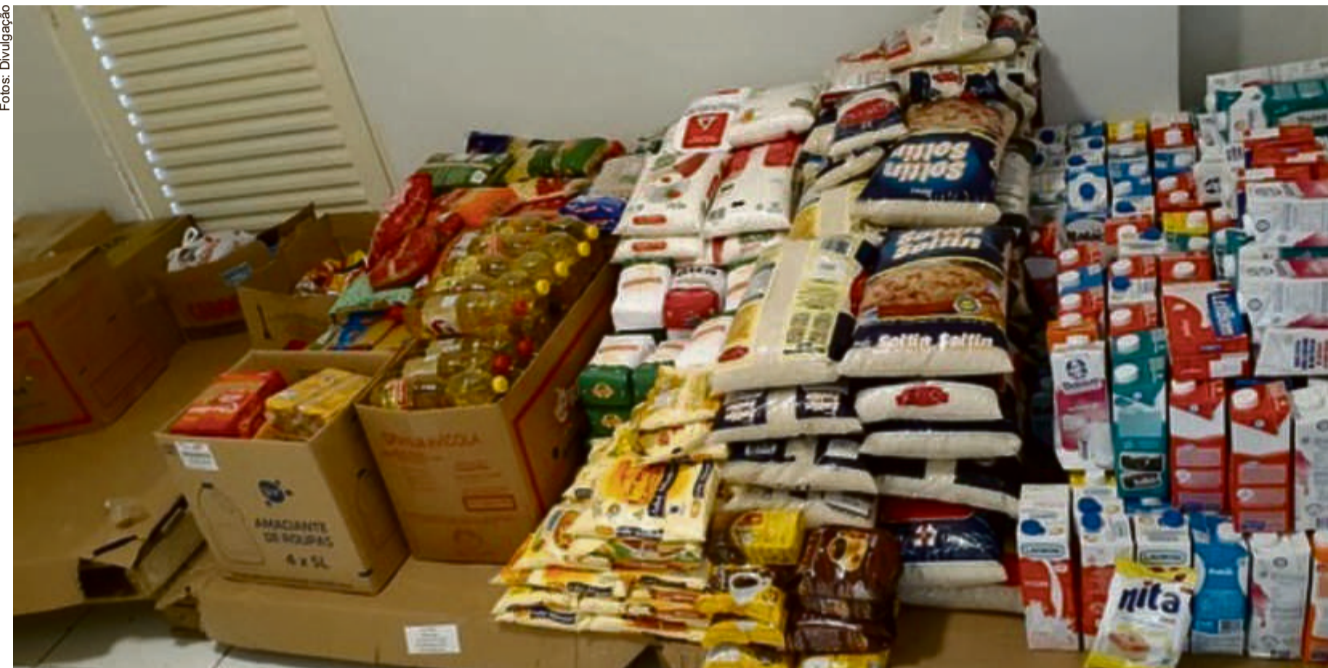
Campanha visa arrecadar duas toneladas de alimentos que serão distribuídas para em estado de vulnerabilidade

“Com a pandemia, começamos perceber que muitas pessoas que já se encontravam em estado de neces-