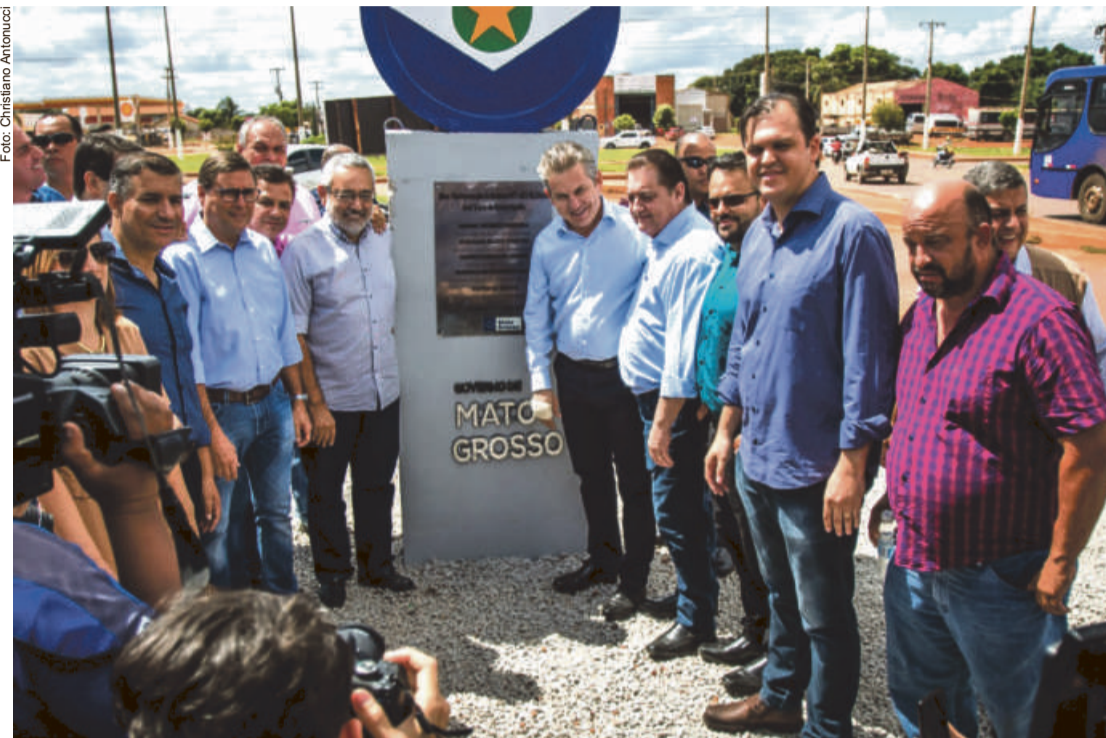
Governador Mauro Mendes mantém inaugurações e lançamento de obras mesmo durante a pandemia

O bom ambiente econômico vem se traduzindo em obras. As melhorias de infraestrutura logística seguem em ritmo acelerado e ocorrem em todas as regiões. Por meio Secretaria de Estado de Infraestrutura e Logística (Sinfra), estão sendo executadas 76 obras em 2.020 quilômetros de rodovias em Mato Grosso.