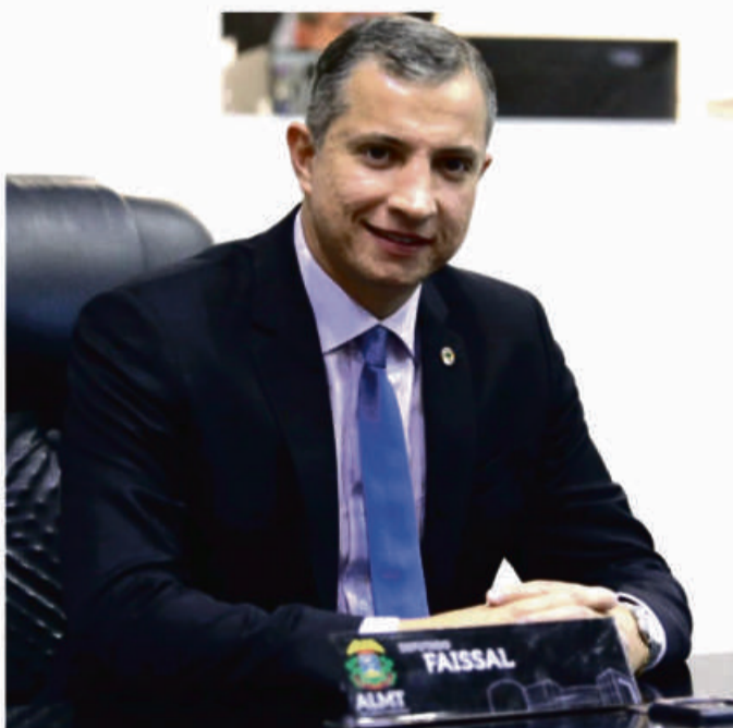
Deputado Faissal Caill