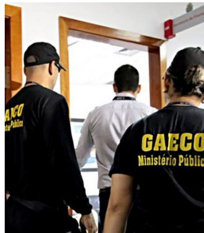
Nos bastidores já se comenta sobre uma possível operação que deve desgastar ainda mais a Casa