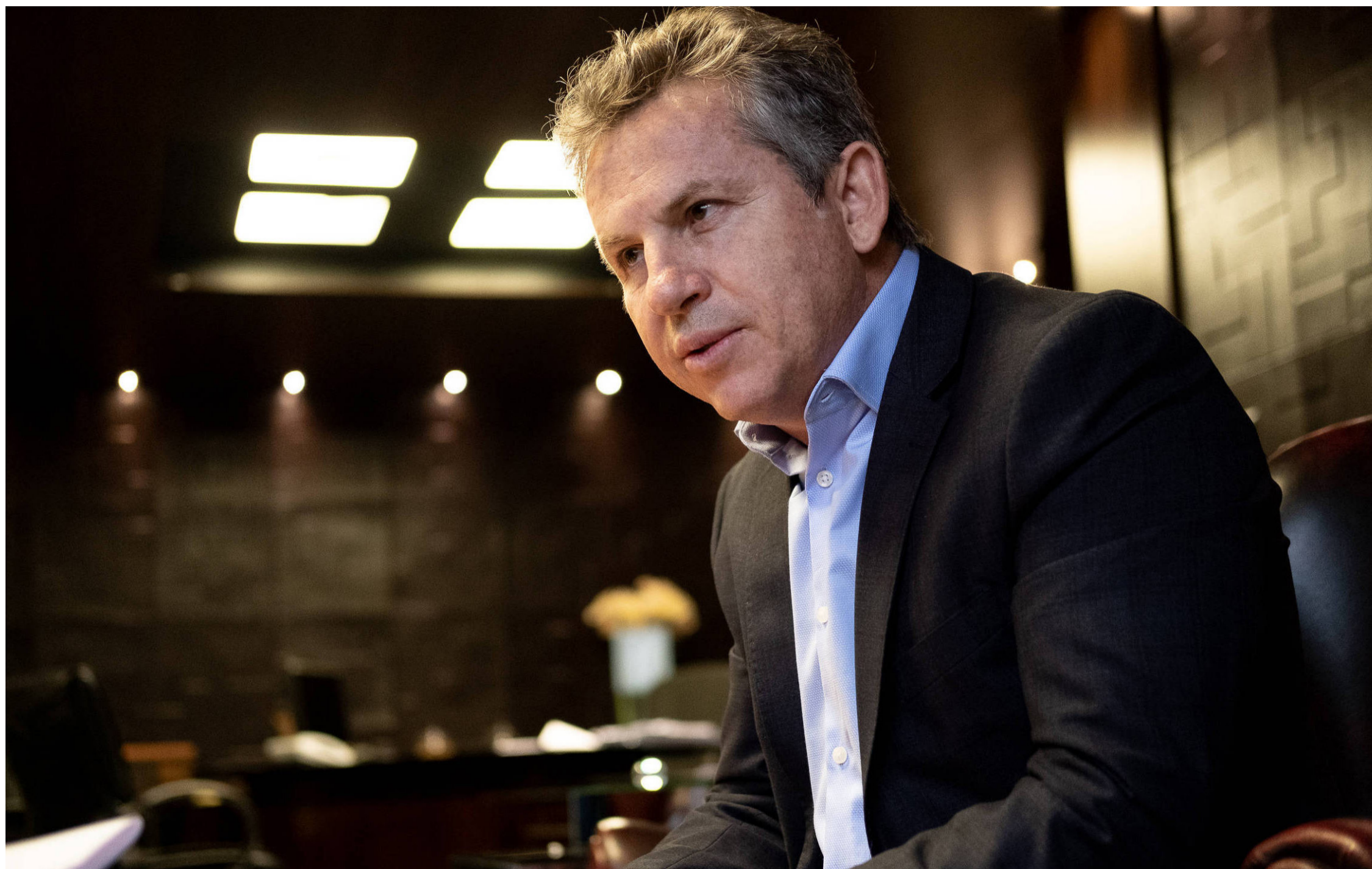
Governador Mauro Mendes