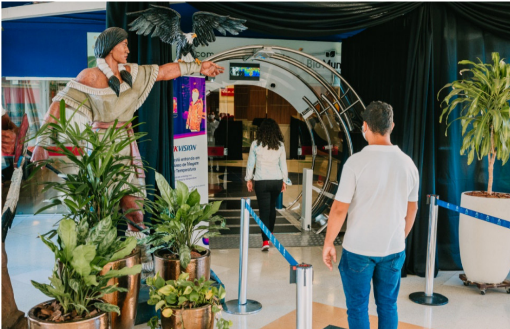
A câmara de descontaminação instalada no Shopping 3 Américas é da empresa de biossegurança e tecnologia Camel, contratada para este devido serviço

Shopping 3 Américas será o primeiro da Capital de Mato Grosso a apresentar tecnologia inovadora e recente no Brasil para desinfecção de suas áreas comuns, com triagem organizada e com auxílio de inteligência artificial em suas entradas. Por meio de uma câmera termográfica, pioneira em território nacional, o projeto piloto ficará localizado na entrada da passarela que liga os cinemas à praça de alimentação para demonstrar como a junção de tecnologias pode trazer segurança no