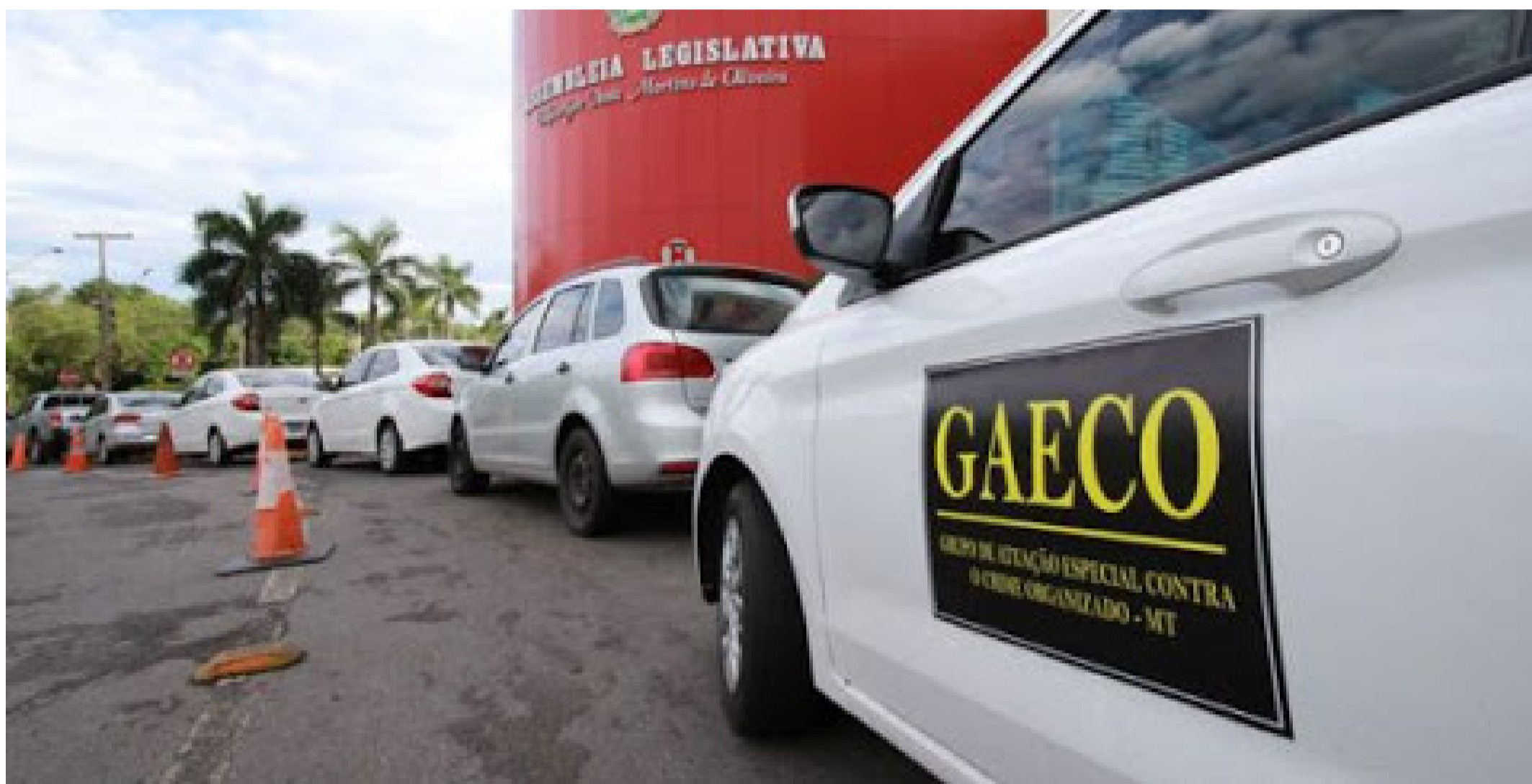
O Gaeco é figura constante na Assembleia, que foi alvo de diversas operações policiais