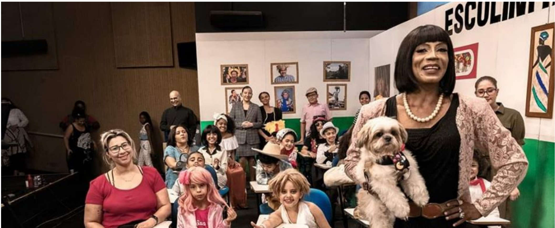
Sucesso da personagem é tantos que ela ganhou o quadro a Escolinha da Almê na TV Centro América