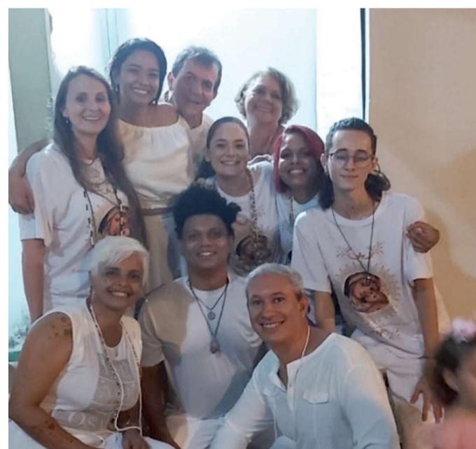
Turma reunida para celebração