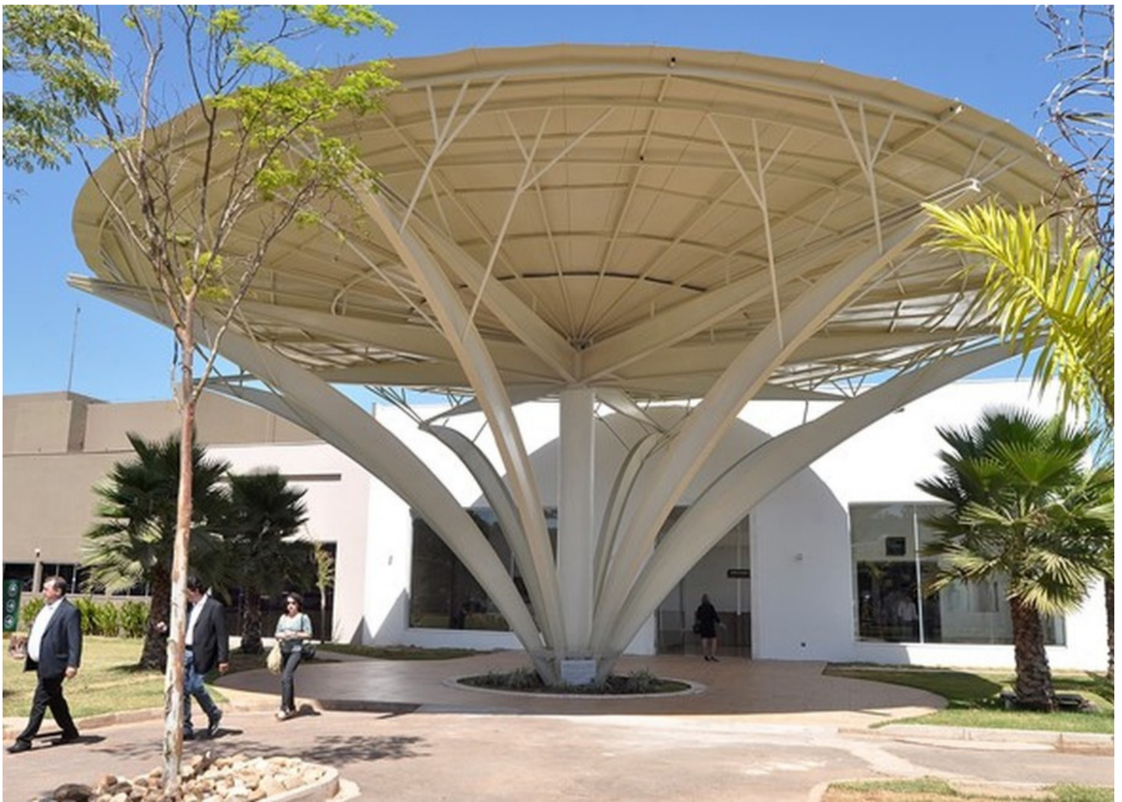
Situação do HCan está desesperando pacientes e familiares, isso porque os pacientes estão voltando para casa por conta da falta de medicamentos.