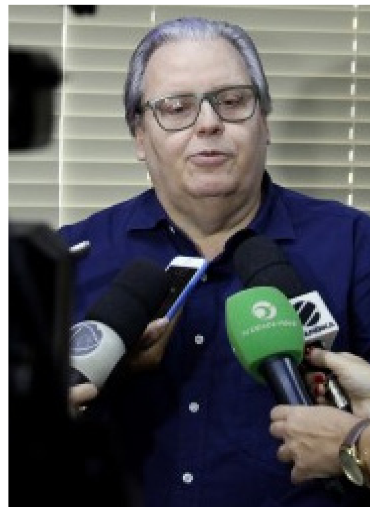
“Temos uma dívida de pouco mais de R$3,5 milhões, referente aos dois meses de pactuação de serviços e que já está em processo de liquidação”, diz Póssas

Por fim, o secretário também pontuou sobre o IVQ - Índice de Valorização de qualidade pago às unidades que atendem com a qualidade e segue rigorosamente os serviços contratados. “Esse recurso é pago a quem atende com dignidade e responsabilidade tudo o que foi contratado pela saúde pública de Cuiabá. O HCan possui R$ 693.414,41 para receber. Mas justamente pelo fato de escolherem o paciente, onde muitos que são regulados por nós acabam sendo enviados para casa e só são atendidos cerca de um ano depois, é que não pagaremos esse incentivo ao HCan no novo contrato. Por conta de situações como esta é que Cuiabá mudou as regras, só vai pagar pelo serviço executado com qualidade para o paciente SUS, pois a vida é nosso maior patrimônio”, finalizou.