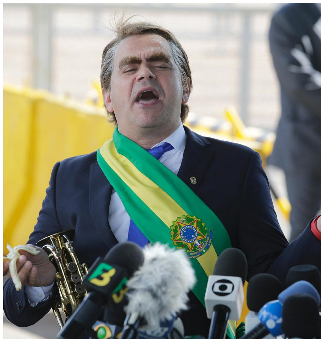
Jair Bolsonaro: "PIB? O que é PIB? Pergunta para eles (jornalistas) o que é PIB"

Frustração com o PIB O resultado do PIB de 2019 é menos da metade do projetado inicialmente pelos economistas. Em dezembro de 2018, às vésperas da posse do presidente Jair Bolsonaro, analistas do mercado financeiro renovaram a aposta na retomada e projetaram crescimento de 2,55%.