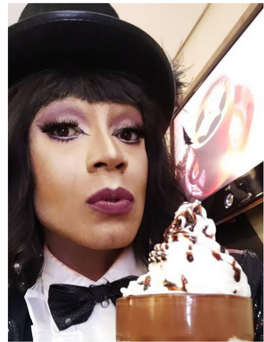
Personagem Almerinda se tornou garota propaganda de vários estabelecimentos comerciais e fatura muitos patrocinadores