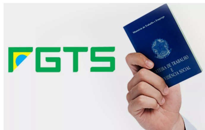
Fachada da UPA 24h

Da forma como os valores são reajustados atualmente, há a desvalorização dos recursos depositados nas contas. Para os associados que não encaminharam documentação à época do ajuizamento das ações coletivas, a ANABB disponibilizou as ações individuais com mesmo objeto.