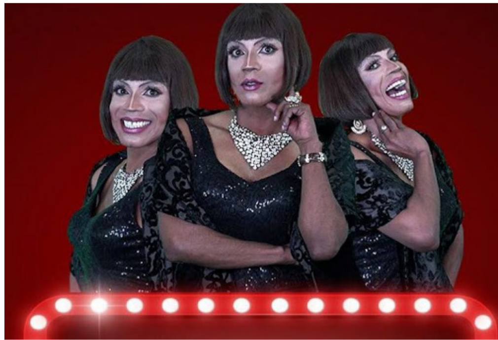
Personagem Almerinda completa 20 anos e para celebrar a data um grande espetáculo será realizado