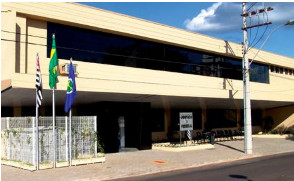
Tribunal de Justiça do Estado de São Paulo (TJSP)

Às vezes encontramos pessoas que a generosidade delas vai além de qualquer limite imaginável; no entanto, o comum é vermos pessoas normais e correntes, agindo de forma normal, como seres humanos que