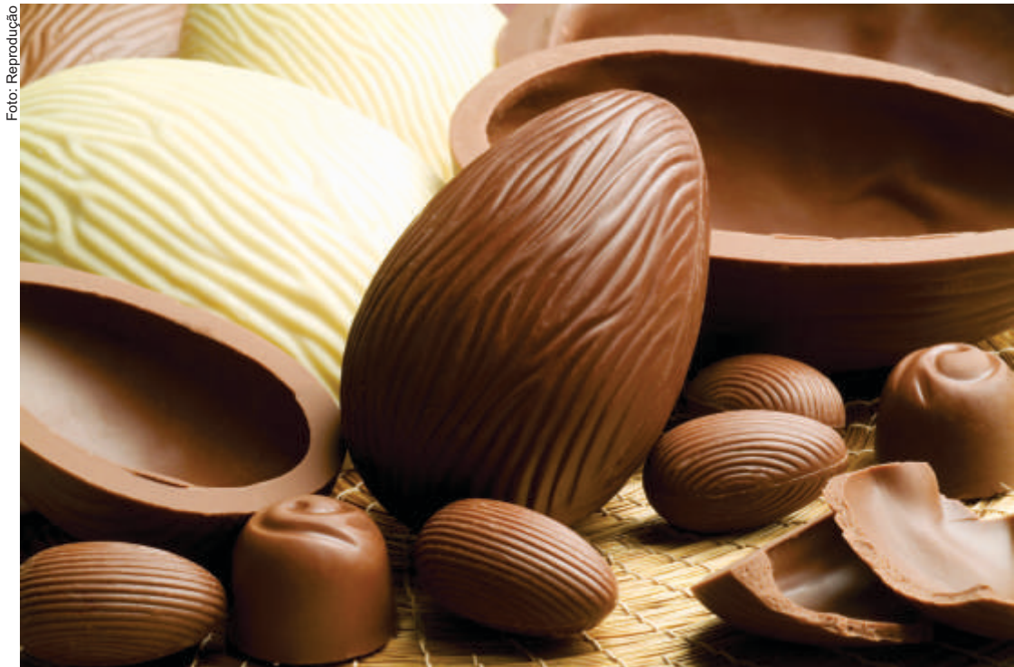
De acordo com a projeção da CDL, mais de 277 mil consumidores devem aquecer o comércio local durante a Páscoa — o que representa mais da metade da população cuiabana

Esse dado reforça a importância do atendimento presencial, da ambientação temática nas lojas e da experiência de compra co-