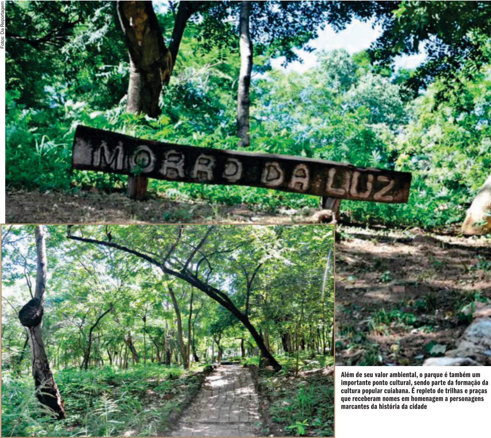
Além de seu valor ambiental, o parque é também um importante ponto cultural, sendo parte da formação da cultura popular cuiabana. É repleto de trilhas e praças que receberam nomes em homenagem a personagens marcantes da história da cidade