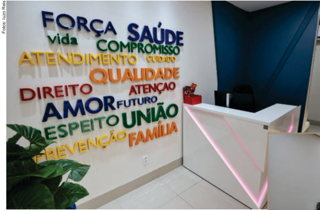
O ambulatório oferece atendimento multidisciplinar e é responsável pelo acompanhamento de pacientes inseridos no processo transexualizador

O levantamento integra o trabalho da Rede Trans Brasil em parceria com o projeto internacional Trans Murder Monitoring, que monitora assassinatos de pessoas trans e de gênero diverso em todo o mundo. Globalmente, foram registrados 350 assassinatos em 2024, sen-