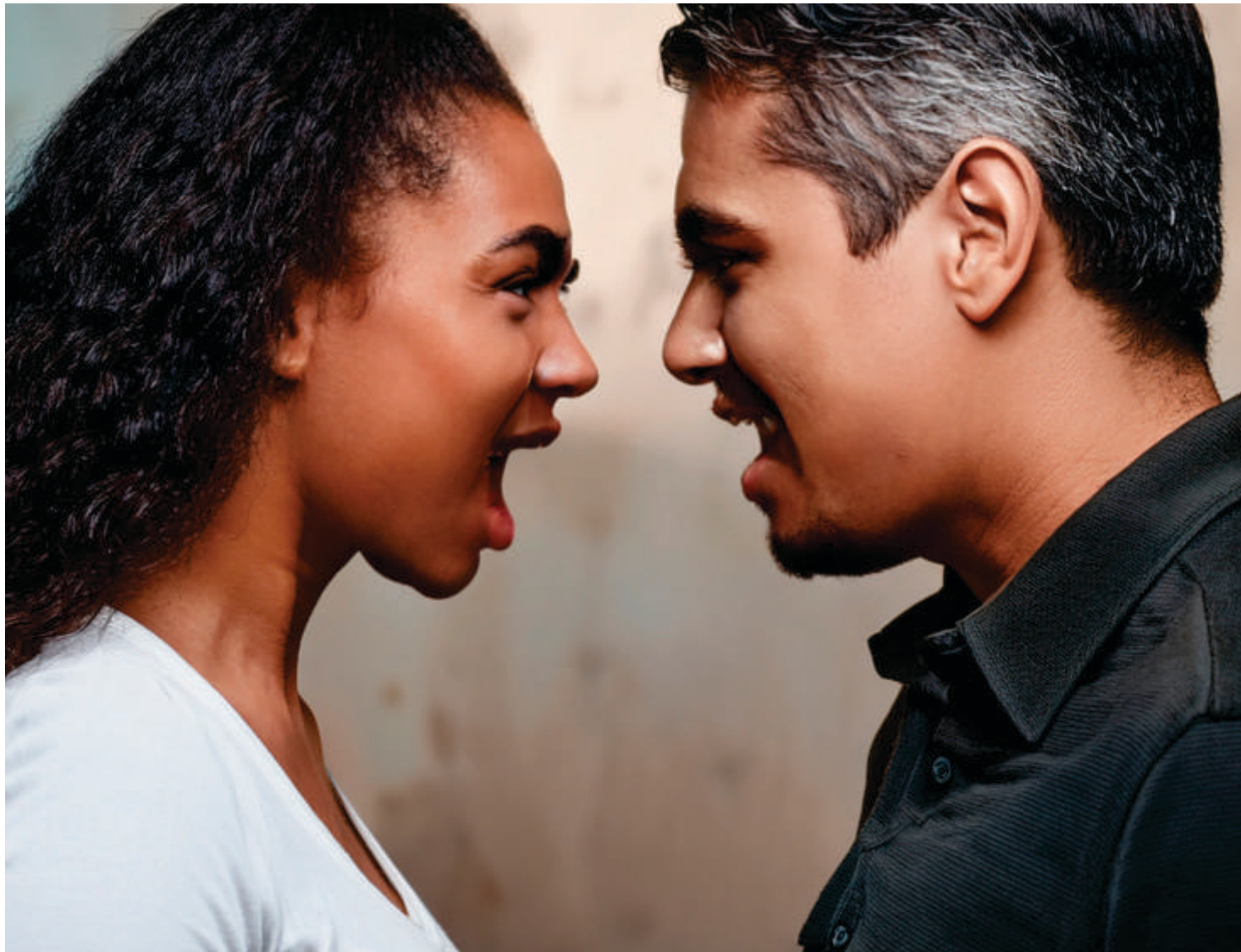
Imagem: Criada por Kleber Simioni utilizando recursos de Inteligência Artificial da Adobe

Foi assistindo essa história que pensamos: o que podemos fazer para mudar, de verdade, para protegermos nós, mulheres? Foi então que, depois de muita conversa, pensamos que a informação pode ser a resposta. A ideia que surge é a criação de um banco de dados com os nomes dos feminicidas, para que as mulheres que hoje não têm acesso às informações possam ter ciência de com quem estão se relacionando.