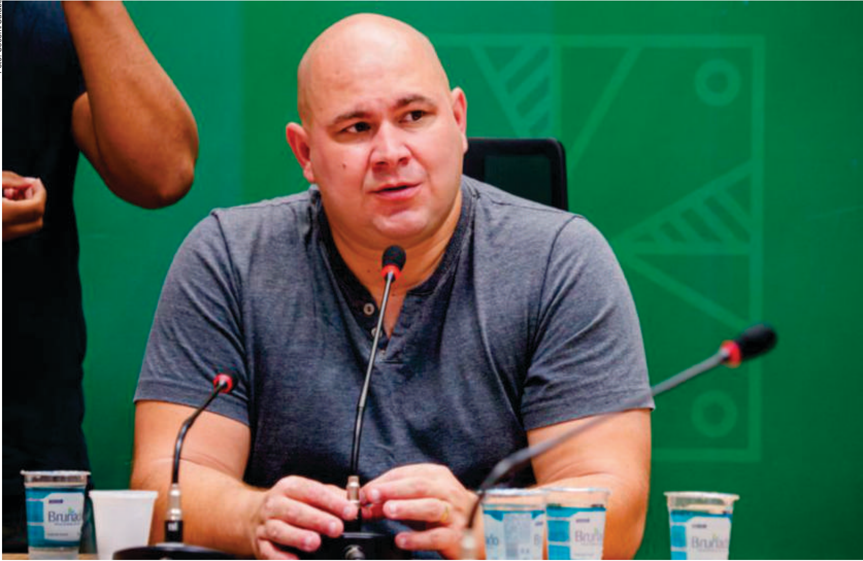
A gestão Brunini, embora reconhecida por sua coragem em enfrentar esses desafios e promover mudanças necessárias

Abílio Brunini, prefeito eleito de Cuiabá, tem se destacado no cenário político e administrativo da cidade com seu compromisso de reconstruir a capital mato-grossense. Após derrotar nas urnas o ex-prefeito Emmanuel Pinheiro, Brunini tem trabalhado para melhorar a infraestrutura urbana, promover ações sustentáveis e limpar as ruas da cidade. A principal bandeira do novo prefeito tem sido o "Cuiabá mais verde", com diversas iniciativas de arborização e melhorias no sistema de gestão de resíduos urbanos, buscando uma cidade mais limpa e sustentável. Entretanto, o caminho para a reconstrução de Cuiabá não tem sido sem obstáculos. Brunini, que vem enfrentando resistência de setores que estavam acostumados com antigas práticas de gestão, tem travado duras batalhas com antigos aliados políticos e empresários influentes ligados aos contratos públicos da prefeitura. "A limpeza da cidade não é só física, mas também administrativa. Estou fazendo o que é certo para Cuiabá e não me curvando a interesses que não beneficiam a população", afirmou Brunini em recente declaração. De acordo com informações exclusivas do Jornal Centro-Oeste Popular, fontes internas da Prefeitura de Cuiabá apontam para possíveis esquemas de remaneja-