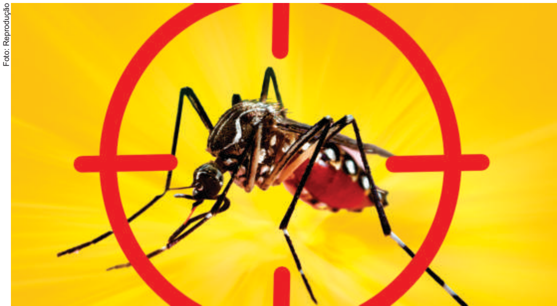
Na época das chuvas, os casos de dengue tendem a aumentar, e alertas são emitidos para a sociedade. Anualmente, os órgãos públicos federais e estaduais realizam campanhas de conscientização e distribuem materiais educativos sobre como eliminar o mosquito