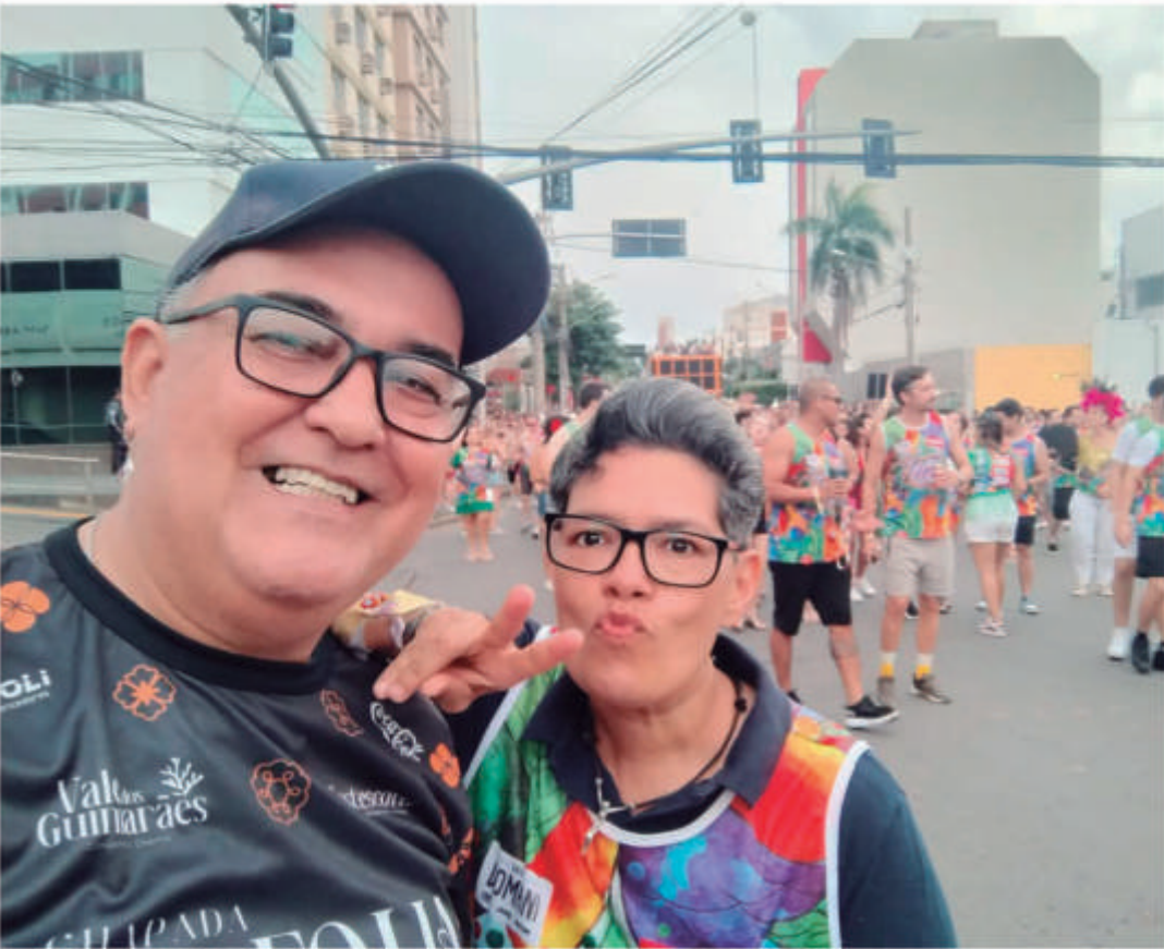
FERNANDO DO BADALADO SITE POCONÉ ONLINE COM MADONA CURTINDO A FOLIA EM CUIABÁ