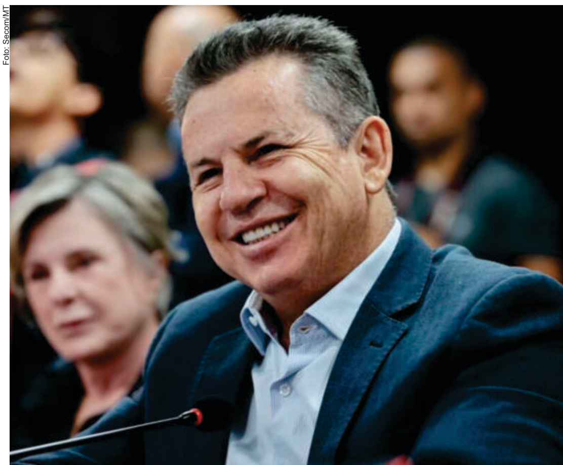
Um dos maiores destaques da gestão de Mauro Mendes tem sido o investimento em infraestrutura, com a recuperação e construção de rodovias essenciais para a integração do estado

A saúde pública também tem recebido atenção especial. Durante sua gestão, o governador tem investido em hospitais