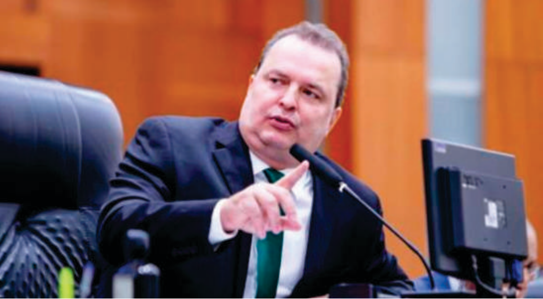
A proposta de homenagem do deputado seguirá para a segunda votação em sessão ordinária