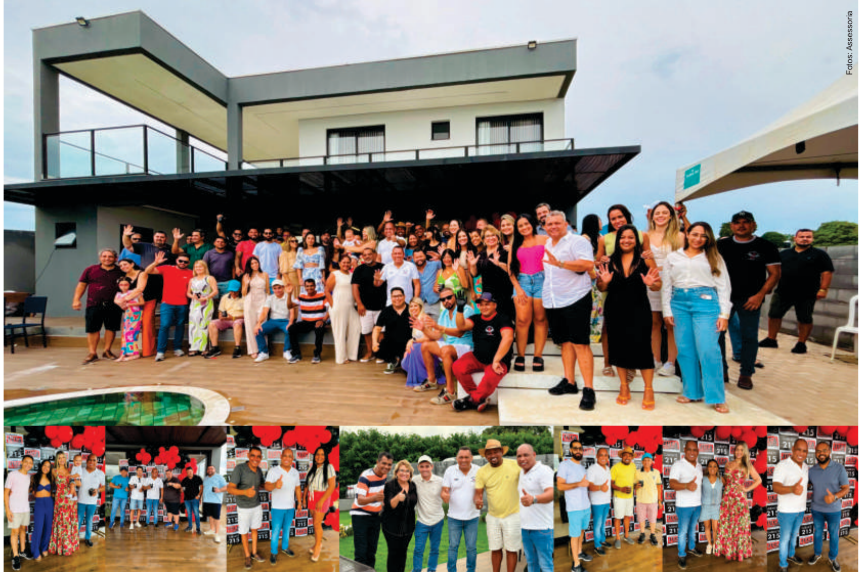
A confraternização também serviu como uma oportunidade para o deputado compartilhar suas expectativas e projetos para 2025. Ele falou sobre sua meta de visitar todos os 142 municípios de Mato Grosso durante o seu mandato

A confraternização também serviu como uma oportunidade para o deputado compartilhar suas expectativas e projetos para 2025. Ele falou sobre