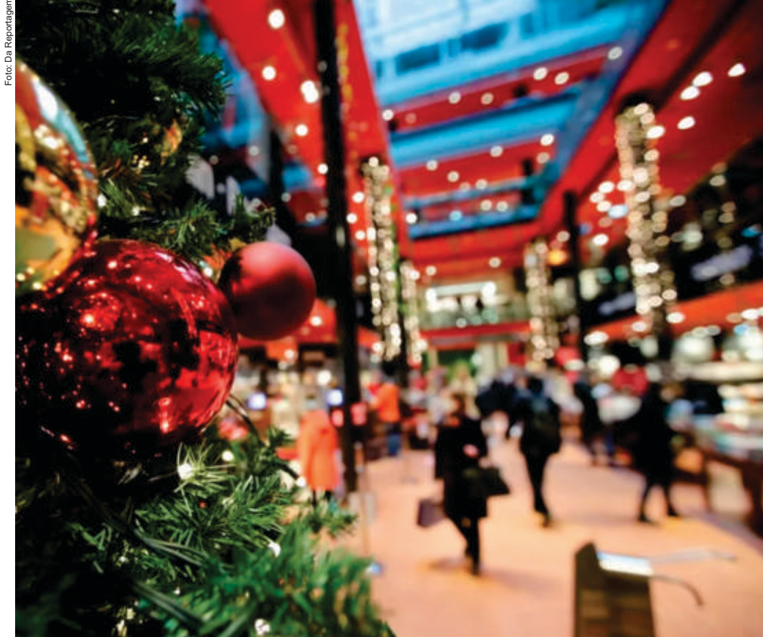
O crescimento das vendas neste Natal é favorecido pela menor taxa de desemprego desde 2012, que atingiu 6,4% no trimestre encerrado em setembro