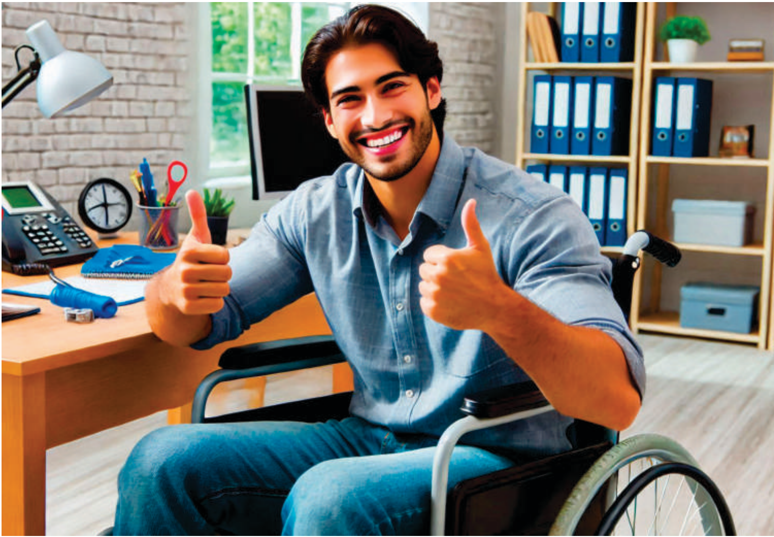
Imagem: Criada por Kleber Simioni utilizando recursos de Inteligência Artificial da Microsoft Design

Quando desenvolvidos de forma estratégica, os treinamentos e programas de inclusão de pessoas com deficiência no mercado de trabalho ajudam a revelar habilidades muitas vezes inexploradas pela falta de estímulo, como a liderança, inteligência emocional, gestão, socialização, compromisso, entre outras. O x