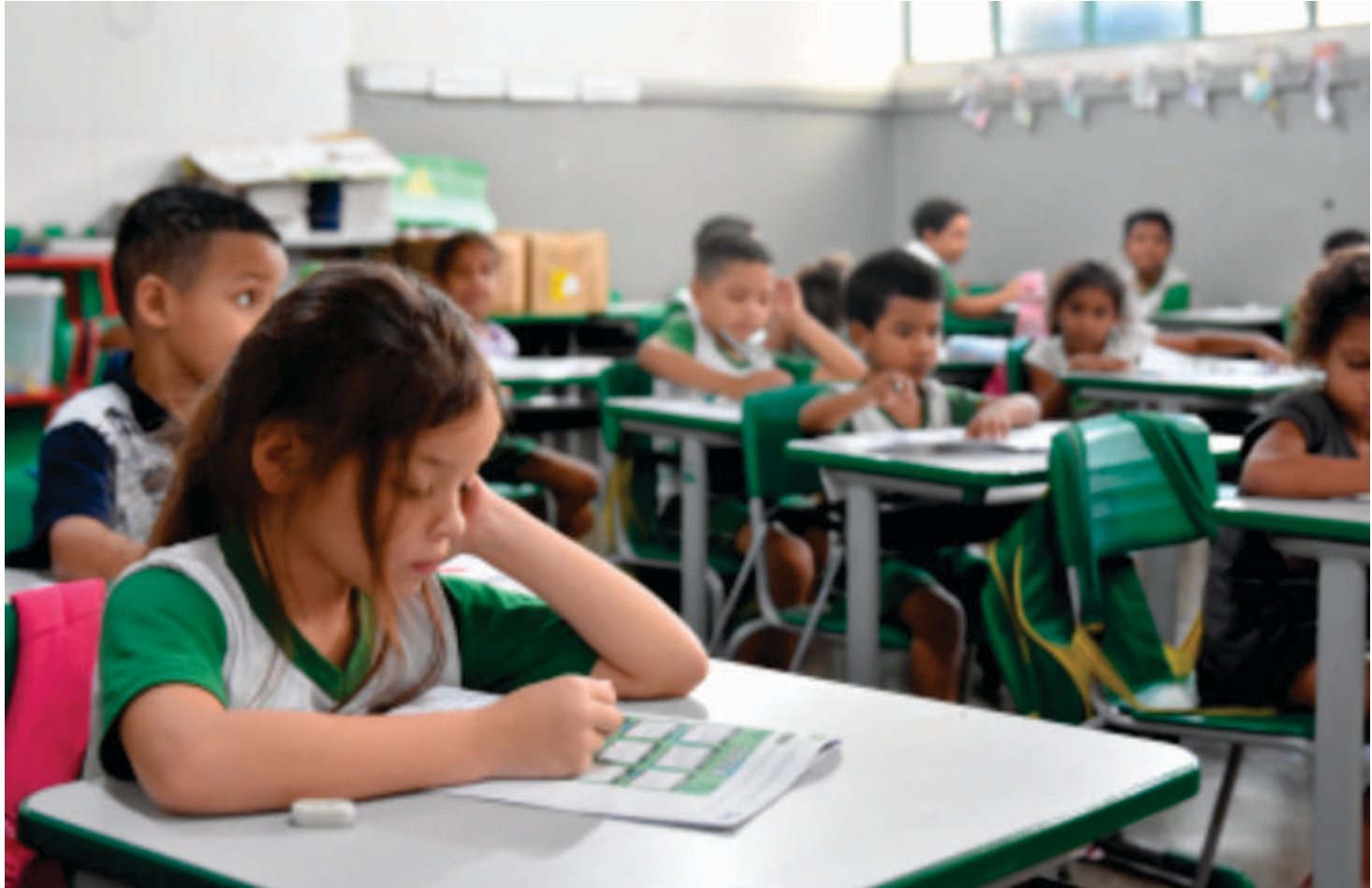
Entre os destaques, está o Programa de Aprendizagem Cuiabana (ProAC), que oferece suporte pedagógico aos alunos, e também o Programa de Monitoramento Pedagógico (PROMP), que acompanha o desempenho das escolas

Após um período em que as metas educacionais não foram alcançadas devido à pandemia do coronavírus, quando, por um tempo, não houve aulas e, posteriormente, as aulas foram ministradas de forma online, geraram-se lacunas educacionais que só seriam combatidas com programas e investimentos altos para que as metas fossem alcançadas. Segundo a secretária de educação, a integração entre tecnologia, métodos pedagógicos atualizados e o compromisso dos professores foi determinante para o sucesso.