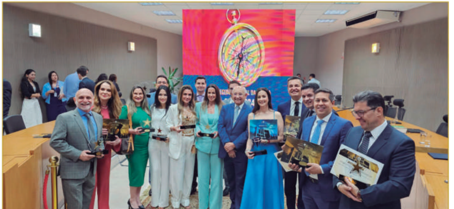
JUIZES QUE RECEBERAM O PRÊMIO UNIDADE JUDICIÁRIA DESTAQUE 2024.

Além do certificado, os servidores e magistrados das unidades premiadas terão notas de elogio registradas em suas fichas funcionais. Para o coordenador da CGJ, Flávio Paiva Pinto, o prêmio também promove boas práticas no Judiciário. □ Esse é um prêmio que reconhece o trabalho destes servidores e magistrados. As boas práticas merecem ser amplamente divulgadas. As unidades premiadas podem servir de exemplo e inspiração para as demais □.