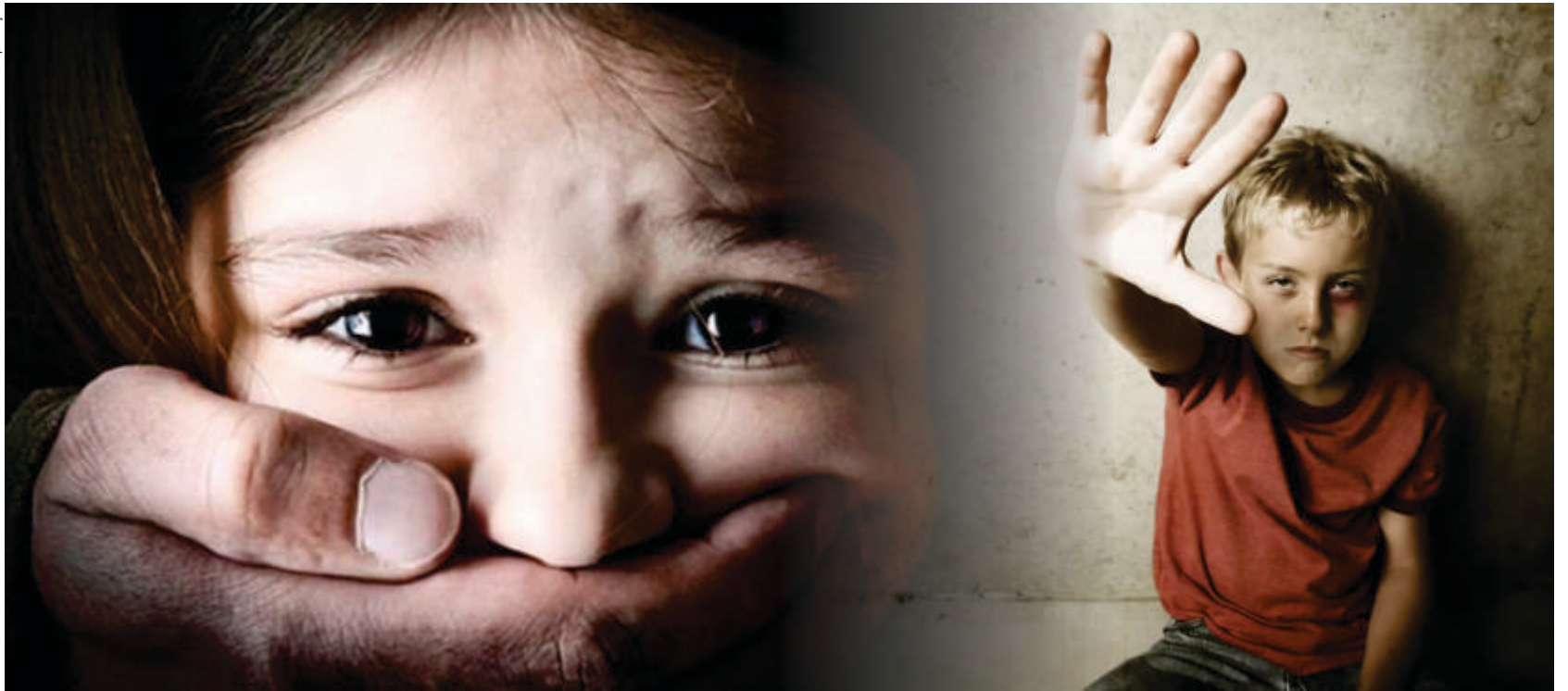
Geralmente, o adulto envolvido é alguém conhecido da criança, como um membro da família, padrasto ou uma pessoa com autoridade, como professor ou treinador

de Estupro. No entanto, Lula vetou um dispositivo que estabelecia a manutenção dos dados por dez anos após o cumprimento da pena. Na justificativa enviada ao Congresso Nacional, o presidente afirmou que a medida violaria, princípios constitucionais, como os direitos à intimidade, vida privada, honra e imagem do condenado. Lula argumentou ainda que estender o prazo para manter os dados disponíveis no cadastro após o cumprimento da pena contrariaria os princípios da proporcionalidade e do devido processo legal. O veto será analisado pelo Congresso, que poderá decidir pela sua manutenção ou derubada.