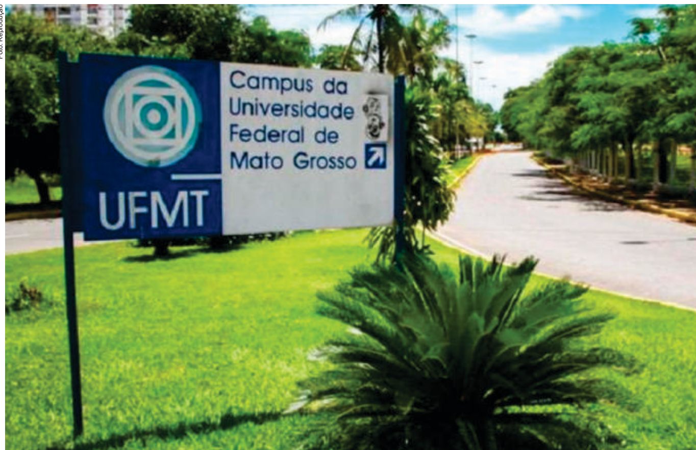
Com a decisão do Consepe, a UFMT reafirma seu compromisso em ouvir os anseios da comunidade acadêmica e agir de forma transparente

O incentivo, inicialmente aprovado em dezembro de 2023, havia sido revogado no dia 7 de novembro deste ano por meio de uma decisão ad referendum da reitoria. A justificativa foi uma recomendação do Ministério da Educação (MEC) e o entendimento do Supremo Tribunal Federal, que considerou a prática in-