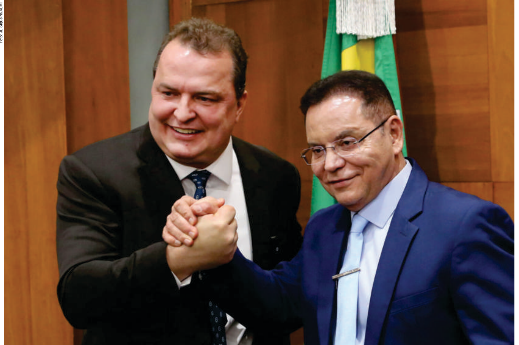
Tendo como uma das marcas da gestão, o trabalho independente, mas com responsabilidade e harmonia com os demais poderes, a Mesa Diretora tem contribuído com o desenvolvimento do Estado

“O Legislativo estadual tem assumido lugar de protagonismo no crescimento de Mato Grosso. Isso exige cada vez mais comunicação, transparência e proximidade com o público, pautando as ações do Parlamento”, disse o deputado.