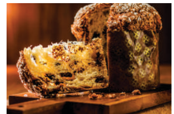
Em Cuiabá, a busca e a produção do produto já estão a todo vapor. Em destaque, está a produção caseira

A demanda por essa iguaria cresce disparadamente nos meses de novembro e dezembro.