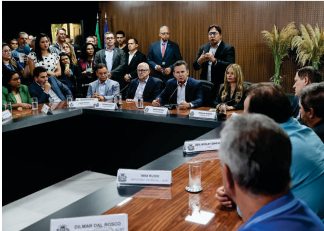
O Comitê Integrado de Combate ao Crime Organizado é mais um ponto de destaque dentro do projeto, que visa a articulação contra a criminalidade

Além disso, será implementado um centro de monitoramento para todas as penitenciárias do estado, com câmeras conectadas ao programa Vigia Mais MT. A implementação dessa tecnologia, que vem mostrando resultados no estado, permitirá que ações sejam acompa-