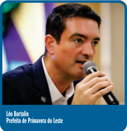
Léo Bortolin Prefeito de Primavera do Leste