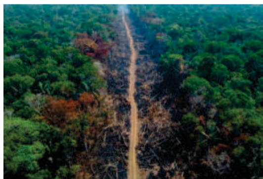
A redução das reservas legais comprometeria serviços ecossistêmicos essenciais para a economia matogrossense, como a polinização - que contribui para 35% da produção mundial de alimentos

Além disso, compromete os esforços de desenvolvimento sustentável e desconsidera a complexa realidade ambiental e legal da região. “Os impactos