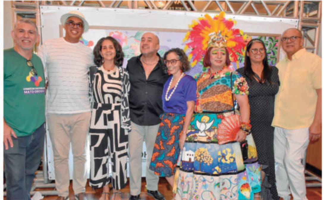
LANÇAMENTO DO COMITÊ DE CULTURA DE MATO GROSSO, OSCS CELEBRANTE, PARCEIRA COLETIVO HERDEIRAS DO QUARITERÊ E CONVIDADOS.