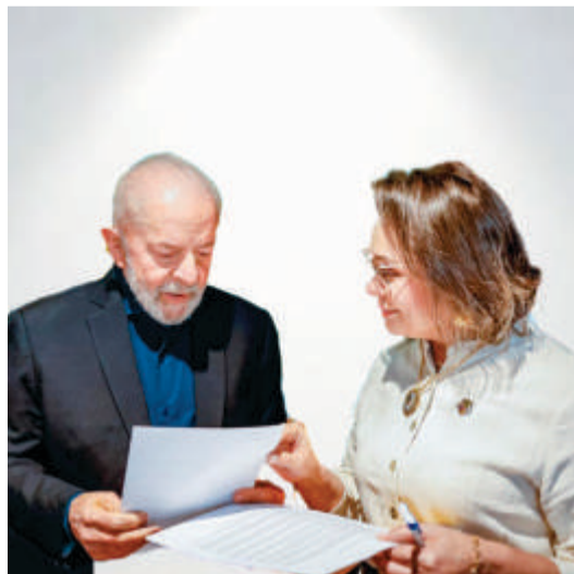
Na visita eles se encontraram, no Palácio do Planalto, com o presidente Lula, para entregar uma carta em mãos, solicitando a levada de uma filial da Rede Sarah para a capital mato-grossense