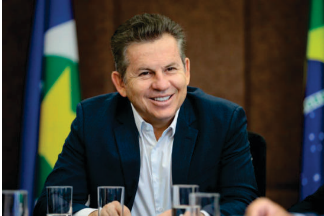
"O resultado dessa pesquisa é um bom indicador, pois aponta que continuamos no caminho certo na prestação de serviço à população", afirmou o governador Mauro Mendes

Por meio do programa SER Família e suas vertentes, idealizados pela primeira-dama do Estado, Virginia Mendes, o Governo também dá auxílio aos que mais precisam, com cestas de alimentos e transferência de renda, além de acesso a um progra-