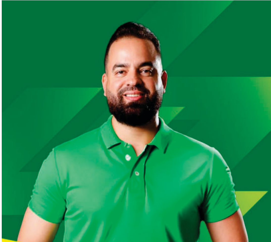
As expectativas para o Dia dos Pais apontam que o varejo online brasileiro deve movimentar R$6,33 bilhões durante a semana que antecede a celebração no domingo (11)

As causas sociais também fazem parte dos planos do candidato, mas agora um